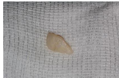
Slika 6. Frakturirani fragment