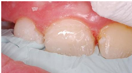
Slika 16. Caklinski sloj labijalno