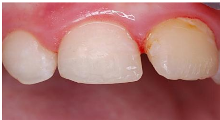
Slika 18. Konačan rezultat