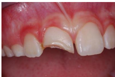
Slika 5. Frakturirani zub 11