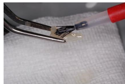
Slika 8. Lijepljenje fragmenta