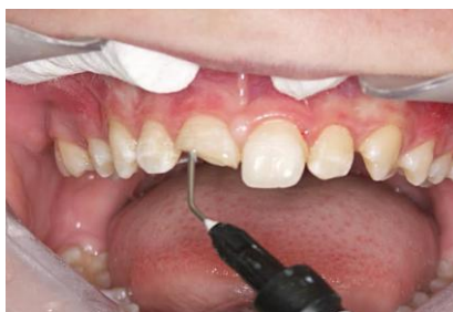
Slika 7. Nanošenje kompozita