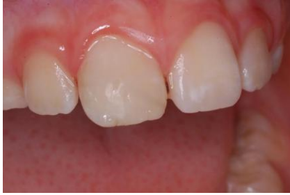
Slika 9. Završni izgled zalijepljenog fragmenta