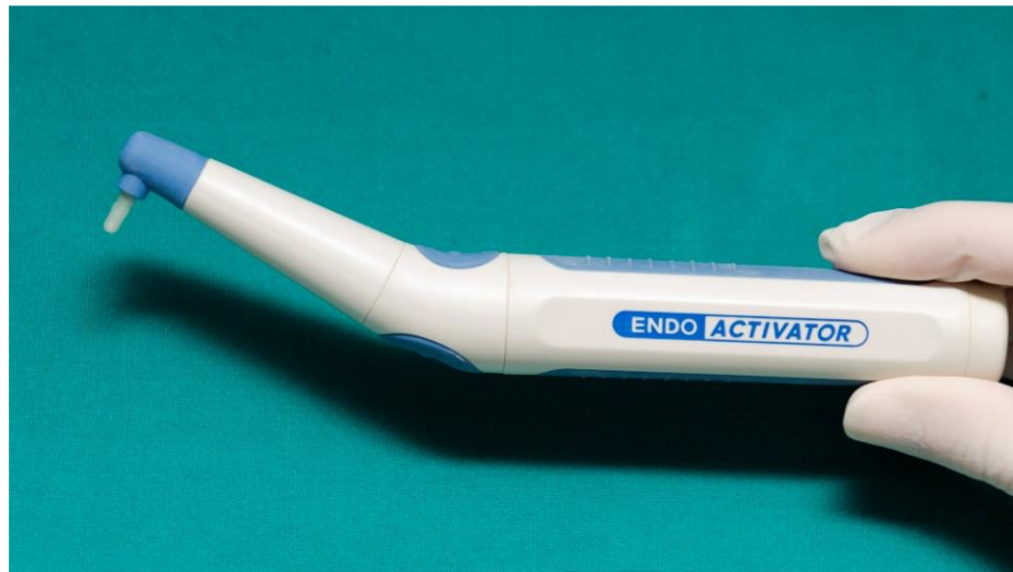
Slika 1. EndoAktivator (Dentstply Sirona)