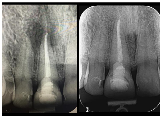
Slika 5. Rendgenski nalaz upalnog periapikalnog procesa zuba 11 (lijevo) i kontrolna rendgenska snimka nakon 10 mjeseci od endodontskog liječenja (desno) na kojoj je vidljivo kompletno cijeljenje upalnog periapikalnog procesa

Zacjeljivanje periapikalne lezije počinje u prvoj godini nakon zahvata (35), no za potpunu restituciju često je potrebno više godina (29). Udio potpuno zacjeljenih lezija varira od 75% (32) do 86% (36). Od svih zubi koji su s vremenom zacijelili, 50% do 70% zacijelilo je unutar prve godine (31), dok se postotak lezija koje su zacijelile između 2. i 4. godine diže na 90%. Nakon 6 godina, postotak se diže i na visokih 95% (29). Ostalih 5%, prema istraživanju Fristada i sur. (37), može cijeliti čak i u drugom i trećem desetljeću nakon tretmana. Navedena studija provedena je na zubima koji su endodontski revidirani 20-27 godina ranije te su kasne periapikalne promjene, s uspješnim ishodom, zabilježene kada je praćenje od 10 do 17 godina nakon tretmana korijenskog kanala produženo za dodatnih 10 godina. Perzistentne asimptomatske periapikalne radiolucencije, posebno one s prekomjernim punjenjem, općenito se ne bi trebale klasificirati kao neuspjeh jer će mnoge lezije zacijeliti nakon dužeg razdoblja promatranja (37).