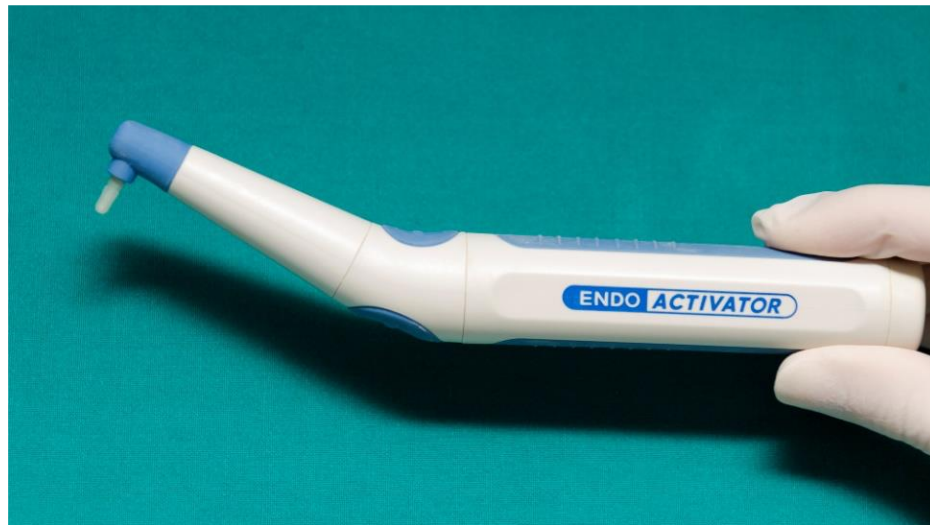
Slika 1. EndoAktivator (Dentply Sirona)