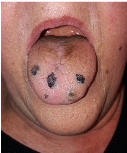
Slika 1. Oralni nalaz u pacijentice s autoimunom trombocitopenijom.