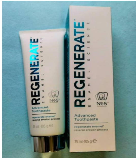
Slika 2. Regenerate Enamel Science zubna pasta