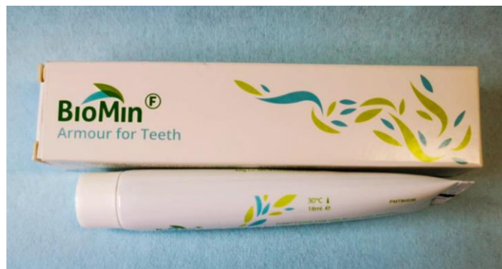
Slika 1. BioMin F zubna pasta

Na tržištu su preparati s bioaktivnim staklom dostupni u obliku paste, kao, primjerice, BioMin F (slika 1.), koja polako oslobađa kalcijeve, fosfatne i fluoridne ione i stvara acidorezistentan fluoroapatit te pasta Regenerate Enamel science (slika 2.) koja okreće erozijske procese u svrhu jačanja strukture zuba spajanjem kalcijeva silikata i natrijeva fosfata u kristalnu strukturu identičnu hidroksiapatitu (26, 27).