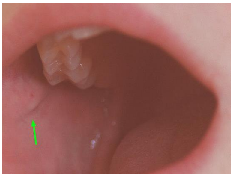
Slika 2. Otvor izvodnog kanala parotidne žlijezde, Papilla ductus parotidei

Podušna žlijezda slinovnica (glandula parotis) najveća je žlijezda slinovnica smještena u području parotideomaseterične regije i retromandibularne udubine. Može se podijeliti na površinski i duboki dio koje razdvaja grananje facijalnog živca unutar žlijezde. Izlučuje serozni sekret kroz izvodni kanal ductus parotideus koji se otvara u usnoj šupljini u području drugog gornjeg kutnjaka (12).