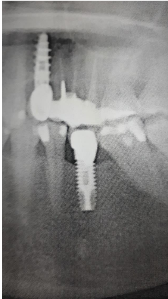
Slika 9. RTG snimka

Pacijent u dobi od 56 godina, po zanimanju pravnik, dolazi u ordinaciju dentalne medicine zbog problema pomičnosti metalkeramičke krunice na implantatu, na poziciji 35. Anamnestički se doznaje da je implantoprotetska rehabilitacija na poziciji 35 provedena prije 9 godina u drugoj stomatološkoj ordinaciji s nama poznatim implantoprotetskim sustavom s vanjskim spojem nadogradnje i implantata. Protetski rad je cementiran na nadogradnji, nepoznatim cementom.