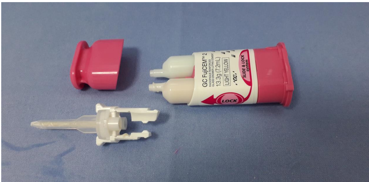
Slika 6. Staklenoionomerni cement za trajno cementiranje