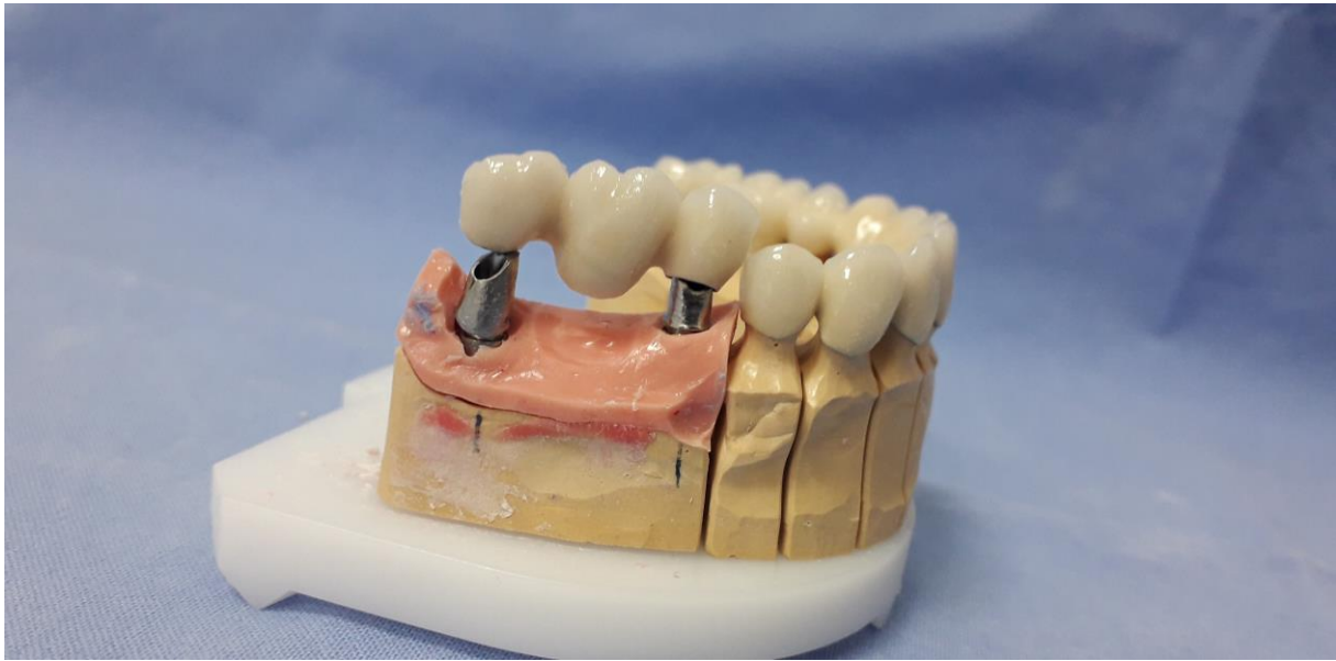
Slika 4. Metalkeramički most na cementiranje, nošen implantatima

U slučaju postavljanja implantata pod većim kutom, ako je divergentnost osi implantata i fiksacijskog vijka bataljka manja od 17 stupnjeva, poželjno je rad pričvrstiti cementiranjem. U toj situaciji je gotovo nemoguće dobro pričvrstiti protetski rad vijkom na individualiziranu nadogradnju (14).