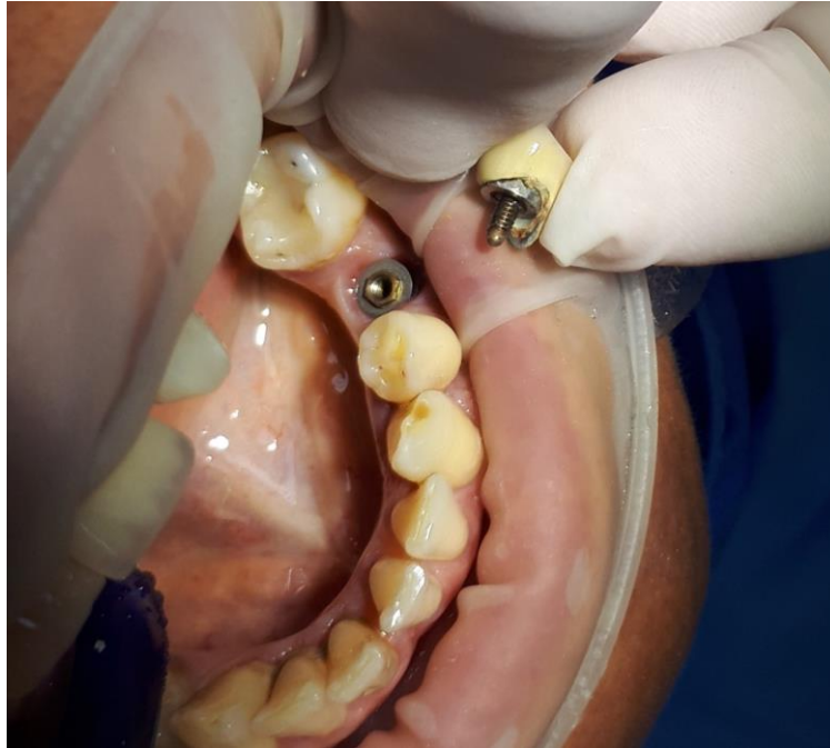
Slika 14. Krunica sa nadogradnjom

Jednom uklonjen stari fiksacijski vijak po mogućnosti je potrebno zamijeniti novim zbog opasnosti od oštećenja prilikom nošenja implantoprotetskog rada ili prilikom uklanjanja razlabavljenog vijka iz bataljka i krunice.