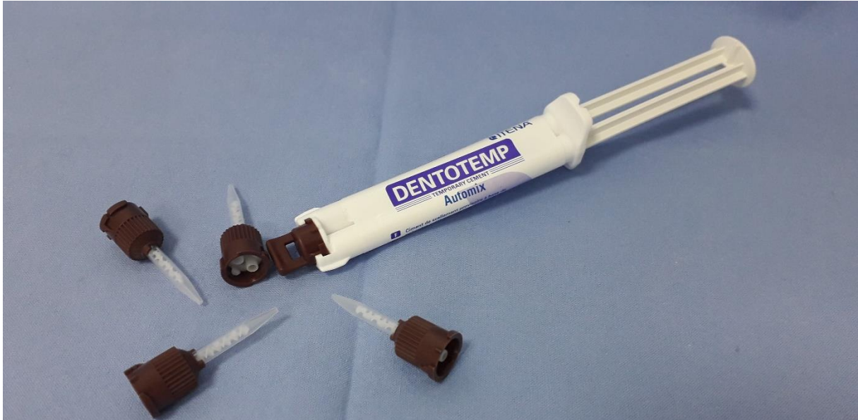
Slika 5. Privremeni cement na bazi cinkovog oksida