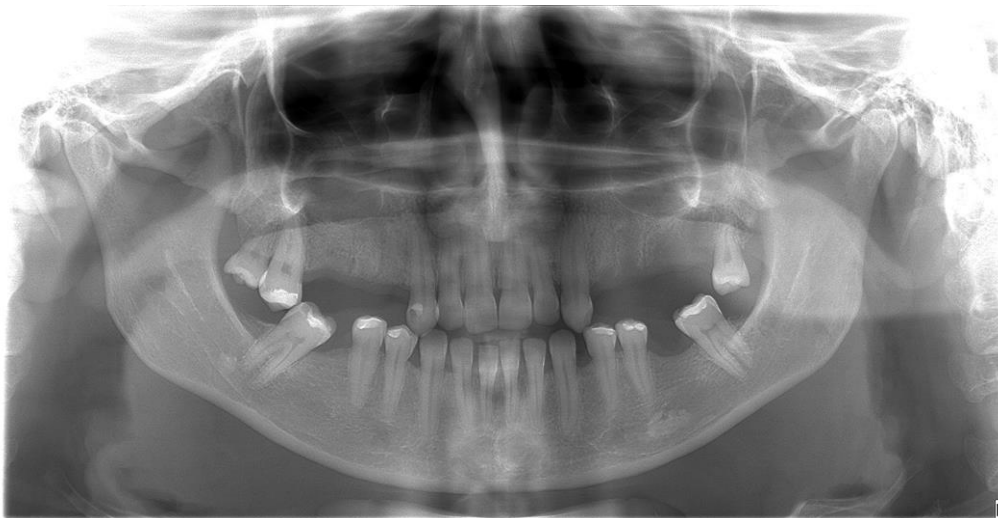
Slika 1. Ortopantomogram

No, najkorisniji prikaz dobiva se 3D snimkom korištenjem Cone-beam kompjuterizirane tomografije (CBCT - Cone beam computed tomography ). Takva snimka omogućava prikaz kosti i okolnih anatomskih struktura u gotovo svim slojevima i brojnim ravninama (Slika 2), za razliku od 2D snimki gdje ne možemo adekvatno odrediti horizontalnu dimenziju kosti, dok mjerenje vertikalne dimenzije nije precizno zbog distorzije prikaza i uvećanja (2).