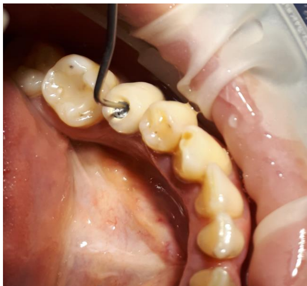
Slika 12. Sondiranje trepanacijskog otvora

Potvrdivši smjer trepanacije pomoću sonde, pažljivo se nastavilo proširivanje trepanacijskog otvora sve do dimenzija širine glave fiksacijskog vijka.