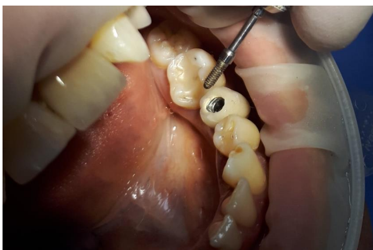
Slika 13. Fiksacijski vijak izvađen bez oštećenja

Fiksacijski vijak je potom u potpunosti uklonjen pomoću odgovarajućeg ključa, pazeći pritom da smjer trepanacije otvora i dimenzija otvora omogućuju nesmetano uklanjanje vijka iz bataljka i krunice (Slika 13).