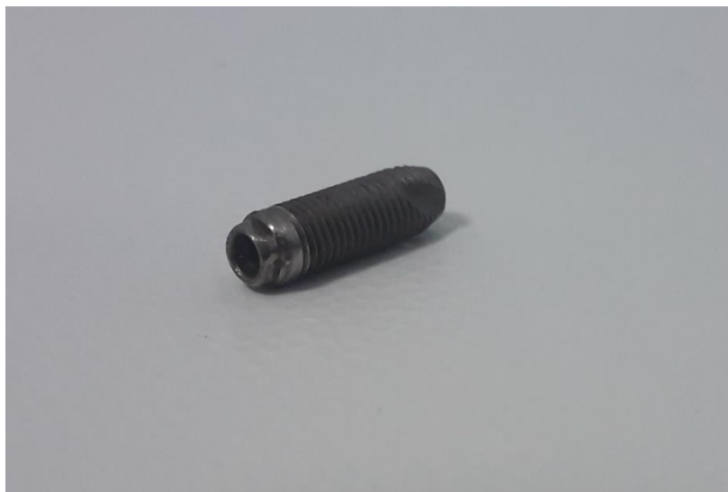
Slika 8. Implantat s vanjskim spojem

Vanjski spoj implantata i nadogradnje je bio prisutan u prvim implantološkim sustavima. Izgledao je poput ravnog dosjeda kombiniranog s antirotacijskim elementima, koje čini izbočina na implantatu, a udubljenje na nadogradnji (Slika 8). Najčešće korišteni antirotacijski element je šesterokutni heksagonski poligonalni oblik. Vijak je taj koji spaja spojne plohe, i vrlo je važno zatezati vijak prema preporuci proizvođača (19).