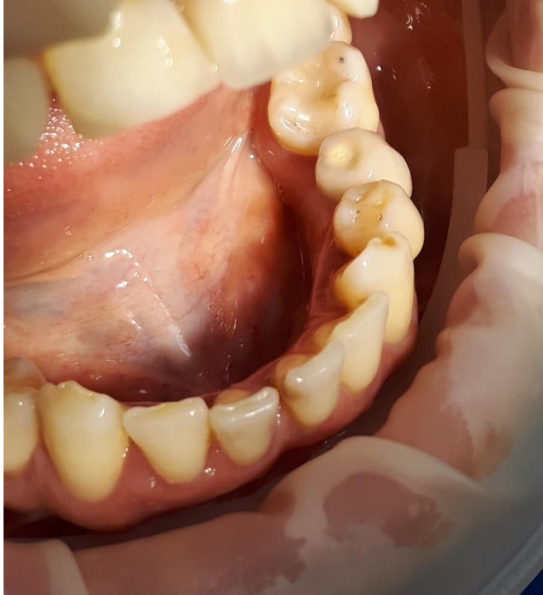
Slika 10. Prikaz implantoprotetskog rada

implantata, na RTG-u jasno je prikazan i fiksacijski vijak u ležištu unutar implantata, što predstavlja vrlo povoljnu situaciju za reparaturu rada.