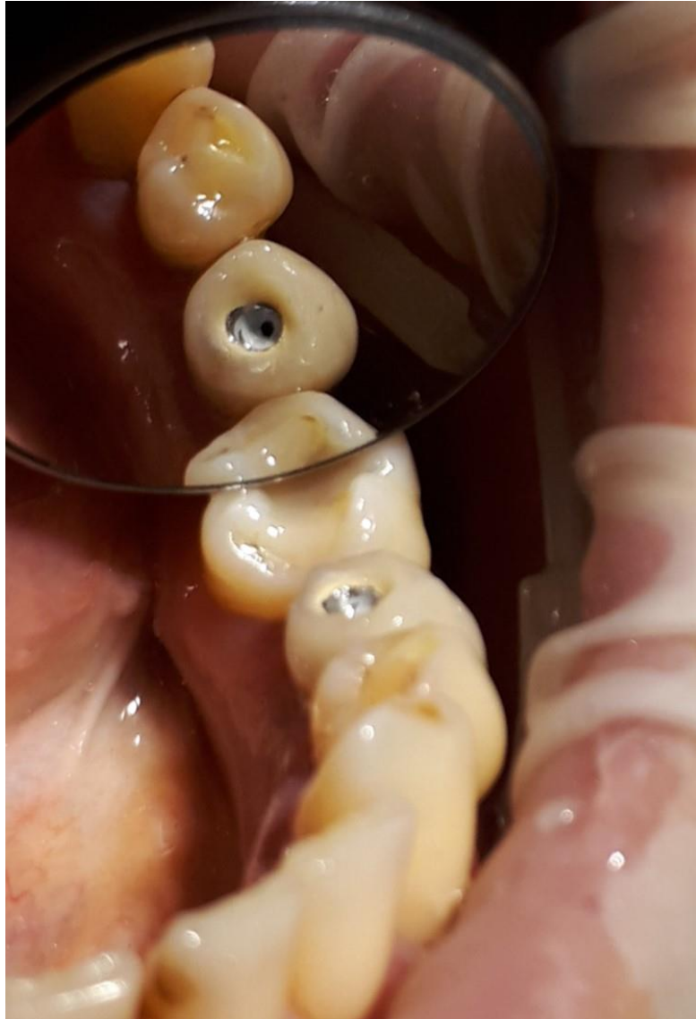
Slika 11. Prikaz metala, sloja cementa i trepanacijskog otvora

Nakon probijanja sloja cementa, stomatološkom sondom je sondiran trepanacijski otvor (Slika 12 – time potvrđujemo ili mijenjamo smjer trepanacije otvora prema fiksacijskom vijku bataljka).