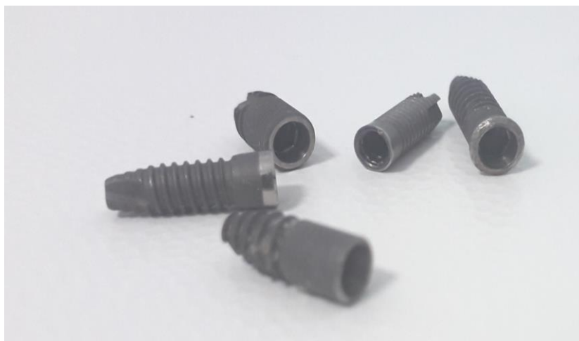
Slika 7. Implantati s unutarnjim spojem

Prednost unutarnjih spojeva jest stabilnija veza implantata i nadogradnje zbog manjeg mehaničkog opterećenja vijka, što je uzrok bolje raspodjele mehaničkih sila koje manje opterećuju okolnu kost, te smanjenog broja rotacijskih pomaka (17). Također, omogućuju bolju mehaničku stabilnost i estetske rezultate (18).