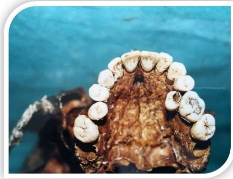
Slika 8. Ektopični lijevi i rotirani desni gornji drugi pretkutnjak