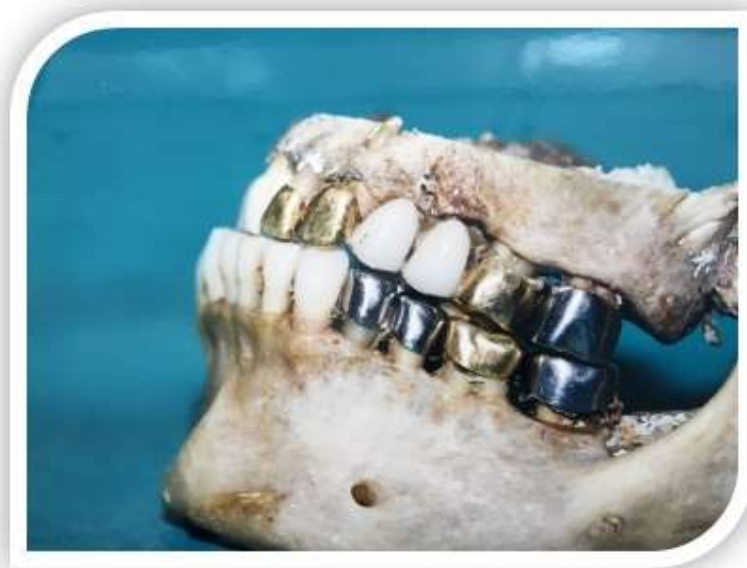
Slika 4. Malokluzija