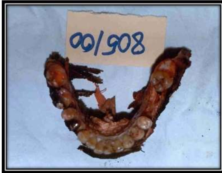
Slika 2. Očuvana donja čeljust