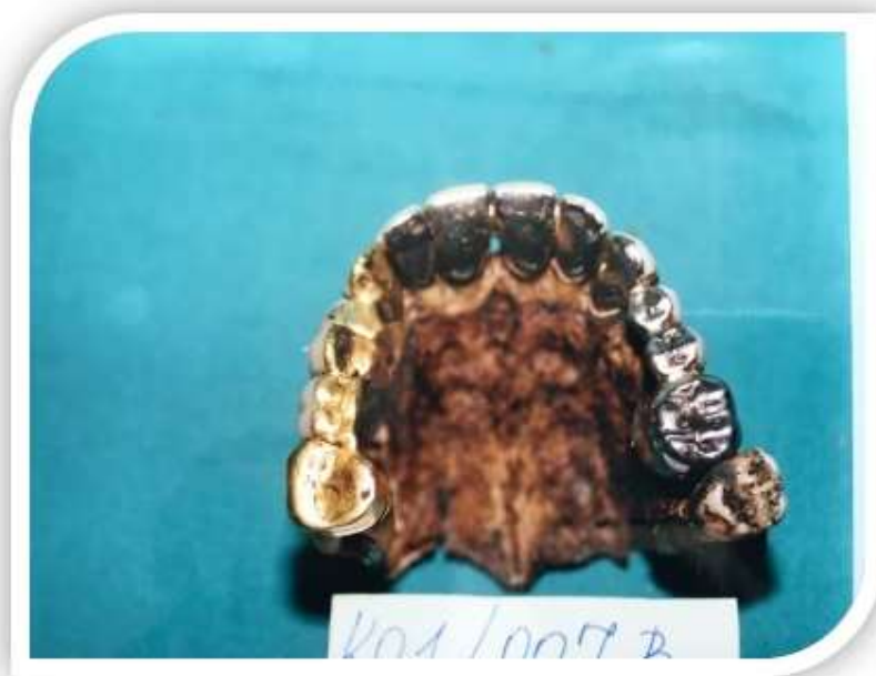
Slika 6. Metalni fiksno protetski nadomjestak

Arhiva Zavoda za dentalnu antropologiju Stomatološkog fakulteta Sveučilišta u Zagrebu