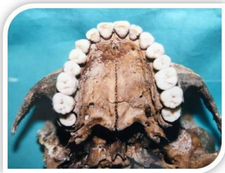
Slika 7. Impaktirani gornji treći molari