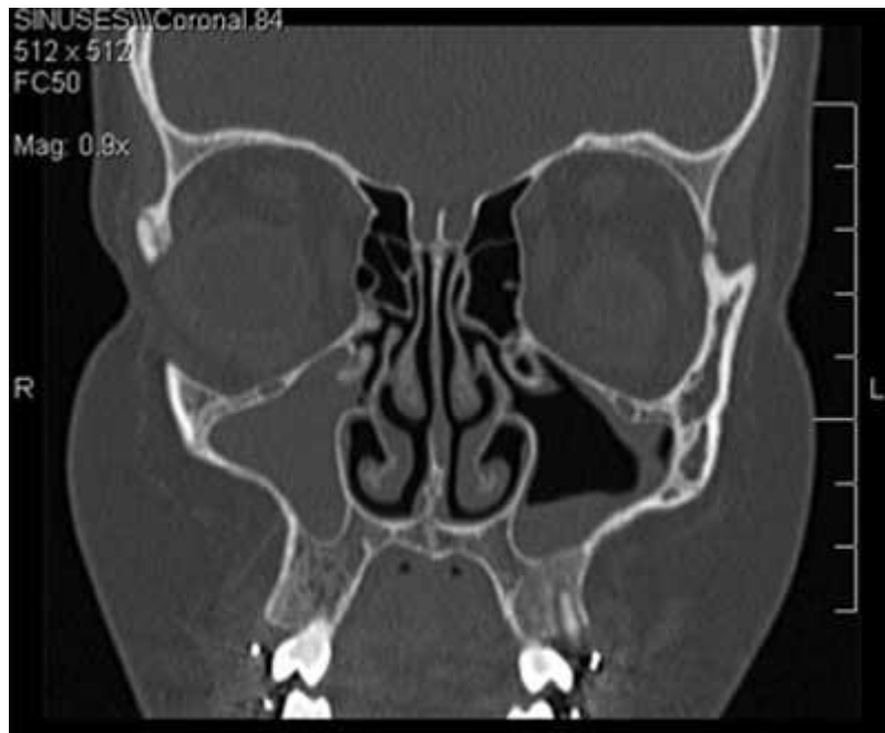
Slika 3. Maksilarni sinuitis na koronarnom presjeku CT-a

spomena (31). Ti podaci bi mogli upućivati na smanjenu osviještenost liječnika o prevalenciji odontogenih sinuitisa. Glavni je nedostatak ove dijagnostičke metode doza zračenja koja je viša nego pri ostalim metodama snimanja (20).