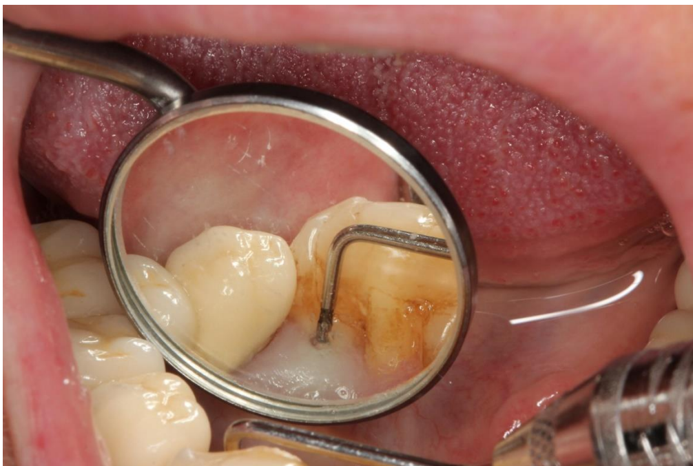
Slika 2. Predoperativno mjerenje PD lingvalno.