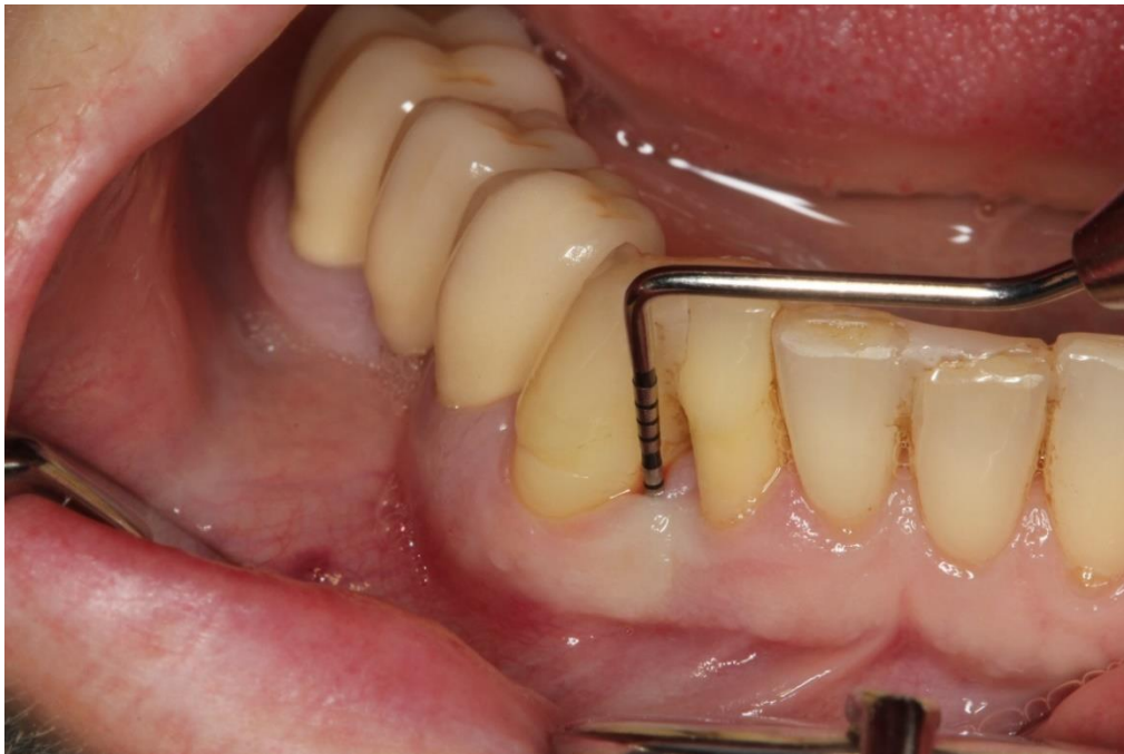
Slika 1. Predoperativno mjerenje PD mezijalno.

Klinički slučaj u kojem je primijenjena hijaluronska kiselina u kirurškoj terapiji parodontitisa može se vidjeti na sljedećim fotografijama (slika 1, 2, 3, 4 i 5).