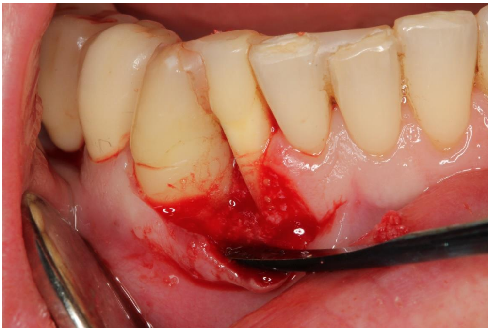
Slika 4. Primjena hijaluronske kiseline u području defekta.