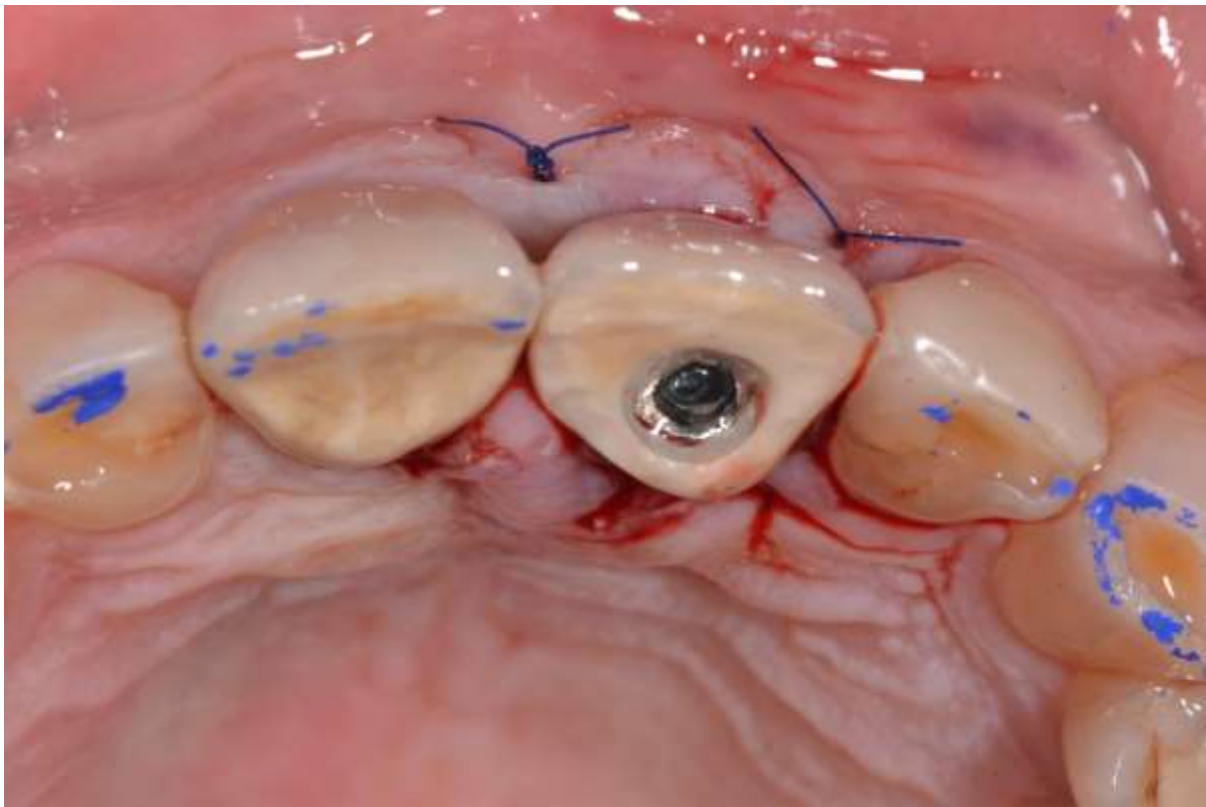
Slika 3. Rana zatvorena šavovima i provizorna krunica na implantatu učinjena od frakturirane krune zuba 21.