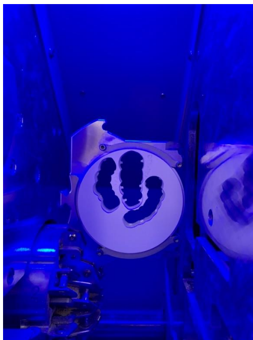
Slika 2. Blok cirkonij-oksidne keramike u glodalici

Ne sadržava staklenu fazu. Izrađuje se isključivo strojno u glodalici. (Slika 2). Ta vrsta keramike koristi se u dvoslojnim tehnikama izrade ili u monolitnom sustavu. Danas su na tržištu dostupni translucetni oblici i višebojni oblici. Cirkonij-oksidna keramika indicirana je za izradu osnovne konstrukcije za mostove koji obuhvaćaju cijeli zubni luk (45).