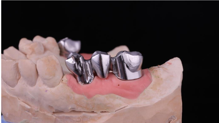
Slika 3. Baza tročlanog mosta na modelu.