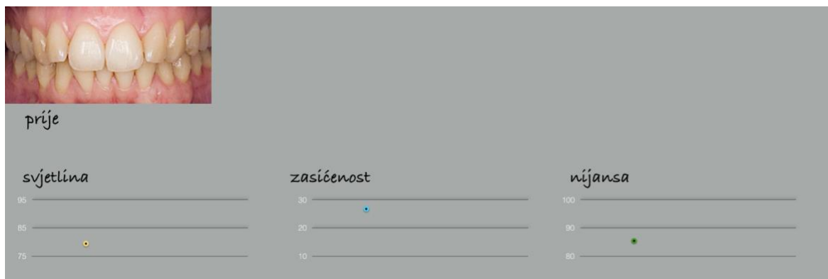
Slika 5. Zubi prije izbjeljivanja.