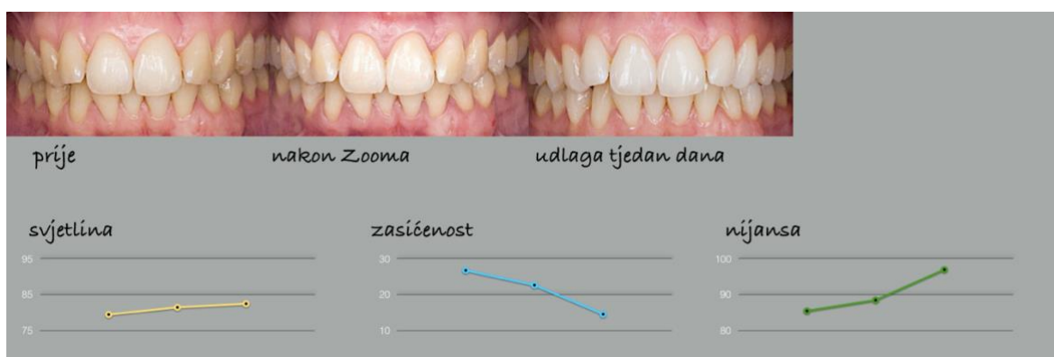
Slika 7. Nakon tjedan dana izbjeljivanja 16% karbamidovim peroksidom u udlagi. Preuzeto:

Preuzeto: prof. dr. sc. Dubravka Knezović Zlatarić.