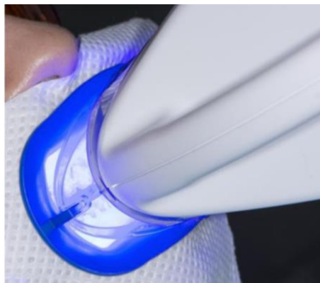
Slika 3. Kataliziranje reakcije oksidacije vodikovog peroksida LED izvorom svjetlosti.

(12). Pritom se koristi i LED lampa, kao dodatni izvor energije, koja katalizira kemijsku reakciju oksidacije vodikovog peroksida (Slika 3.).