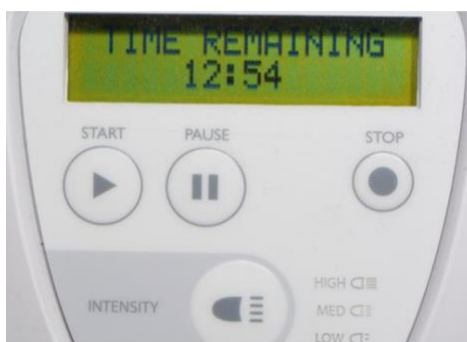
Slika 1. Programirana kontrola duljine intervala izbjeljivanja vidljiva na ekranu aparata za emitiranje LED svjetla.

Pri ovoj vrsti izbjeljivanja koriste se visoke koncentracije vodikovog peroksida (25-40%) ili karbamidovog peroksida (35-45%) (1). Moguće je koristiti i dodatni izvor energije (npr. laser, polimerizacijske lampe, profesionalne lampe za izbjeljivanje) koji katalizira kemijsku reakciju oksidacije vodikovog peroksida. Time se dodatno pospješuje učinak sredstva za izbjeljivanje i skraćuje vrijeme posjeta. Prilikom njihove primjene potrebno je pridržavati se uporabe propisane od strane proizvođača. Laser oslobađa energiju potrebnu za razgradnju vodikovog peroksida na vodu i slobodne radikale kisika te katalizira oksidaciju molekula čestica koje su uzrok obojenja (10). Međutim, zbog skupoće uređaja, laser se izrazito rijetko koristi. Lampe za polimerizaciju su iste one koje se koriste za izradu kompozitnih ispuna. Prije njihove primjene mora se znati snaga navedene lampe te vrsta (LED, plazma ili halogena) (10). Profesionalne lampe za izbjeljivanje su proizvedene s ciljanom namjerom provođenja tog postupka. Zahvat se provodi jednoposjetno, obično kroz 3 seanse od 20 minuta, a estetski rezultati vidljivi su neposredno nakon završenog izbjeljivanja. Broj i duljina intervala se mogu prilagođavati ovisno o etiologiji i stupnju obojenja te proizvođačevim uputama (Slika 1.) (1).