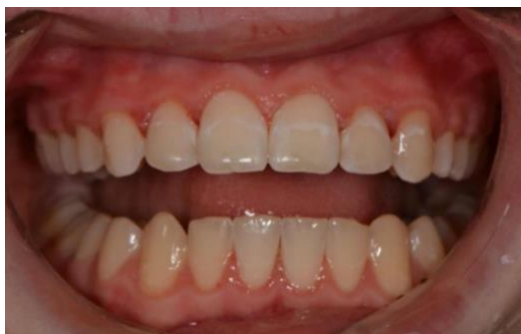
Slika 9. Bijele diskoloracije na zubima nakon intenzivnog izbjeljivanja u ordinaciji.

Nakon intenzivnog izbjeljivanja u ordinaciji se kod pacijenata sa završenom ortodontskom terapijom ponekad javljaju bijele, mutne diskoloracije na nekim zubima (Slika 9.).