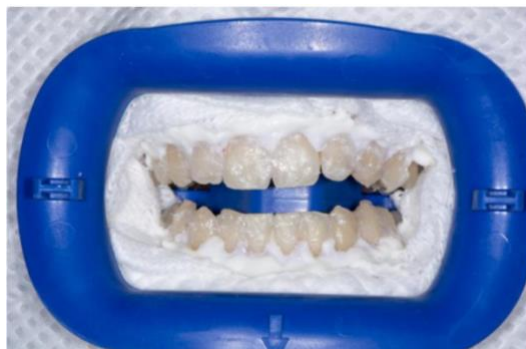
Slika 2. Zaštita mekih tkiva prije postupka intenzivnog izbjeljivanja u ordinaciji.

Izbjeljivanje u ordinaciji započinje namještanjem pacijenta u udobni položaj, postavom zaštitne pregače i detaljnim postupkom izolacije radnog polja i zaštite mekih tkiva (Slika 2.).