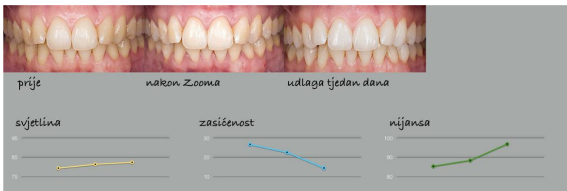
Slika 7. Nakon tjedan dana izbjeljivanja 16% karbamidovim peroksidom u udlagi.