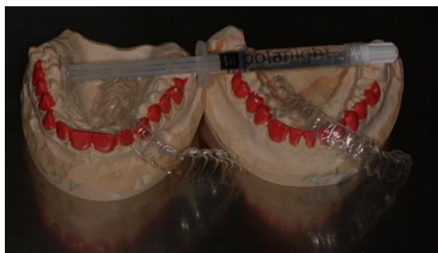
Slika 4. Udlage i sredstvo za izbjeljivanje koje pacijent koristi za izbjeljivanje kod kuće.

Nakon svakog završenog 15-minutnog ciklusa, stari gel se uklanja, a zatim novi nanosi. Da bi se izbjegla dehidracija zuba, između ciklusa i na kraju tretmana, svi se mogu premazati vaterolicama namočenim u vodu (10). I pacijent i stomatolog trebaju nositi zaštitne naočale za vrijeme tretmana. Osnovna prednost ovog postupka je vidljivost estetskog učinka neposredno nakon završenog zahvata, a s obzirom da je korištena koncentracija vodikovog peroksida svega 6%, rizik od nuspojava poput preosjetljivosti i iritacije mekih tkiva, sveden je na minimum (1). Slijedi izbjeljivanje kod kuće u trajanju od dva do tri tjedna, ovisno o stupnju obojenja, s 16% karbamidovim peroksidom. Pacijentima se daju upute da 14 dana za redom, minimalno 6 sati dnevno nose udlagu, dok gel stavljaju samo na vestibularne plohe zuba (Slika 4.) (1).