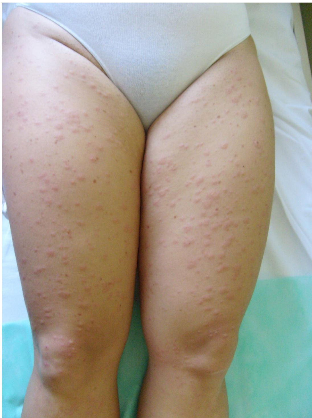
Slika 12. PUPPP ; papularne promjene donjih ekstremiteta.