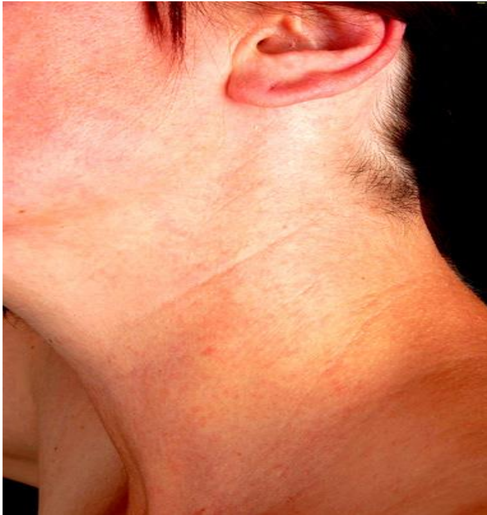
Slika 14. Prurigo gestationis „E“ tip; ekcematoidne promjene u području lica i vrata. Preuzeto: (13).

Kod ostalih bolesnica vide se eritematozne papule rasprostranjene po udovima i trupu (slika 15) koje osobito zahvaćaju područje potkoljenica i ruku. Promjene su pruritične pa je stoga čest nalaz linearnih ekzorijacija uz izrazito suhu kožu.