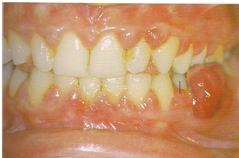
Slika 2. Epulis gravidarum ;

Ne postoji znanstveno dokazana korelacija između pojave ove lezije s određenim periodom trudnoće, iako pacijentice češće uočavaju promjenu u drugom ili trećem tromjesečju trudnoće. Lezija ima tendenciju brzog rasta, do dva centimetra promjera. Lezija je edematozna i hiperemična peteljkasta tvorba svijetlocrvene boje (slika 2) koja često krvari na dodir, ali ima tendenciju vrlo brzog cijeljenja (1,5).