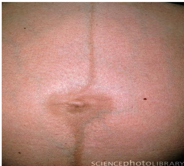
Slika 3. Linea fusca ; pigmentacija linee albe .

Hiperpigmentacije na koži tijekom trudnoće nastaju kao posljedica hormonalne stimulacije melanocita na lučenje pigmenta. Navedene promjene pojavljuju se na početku trudnoće, kod više od 90% trudnica te traju do poroda, a potom postepeno iščezavaju. Obično zahvaćaju područja koja su prirodno jače pigmentirana te se mogu uočiti na bradavicama dojki, pazusima, vanjskom spolovilu, unutrašnjoj strani bedara te na trbuhu u području linee albe . Pigmentirano područje linee albee između ksifoida i simfize nazivamo linea fusca ili smeđa linija (slika 3).