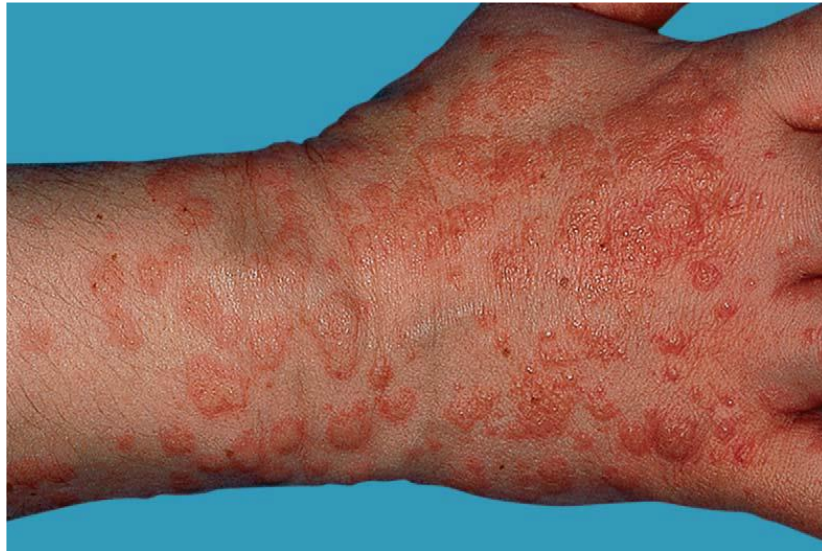
Slika 13. PUPPP ; oblik PUPPP-a s papulama i vezikulama.