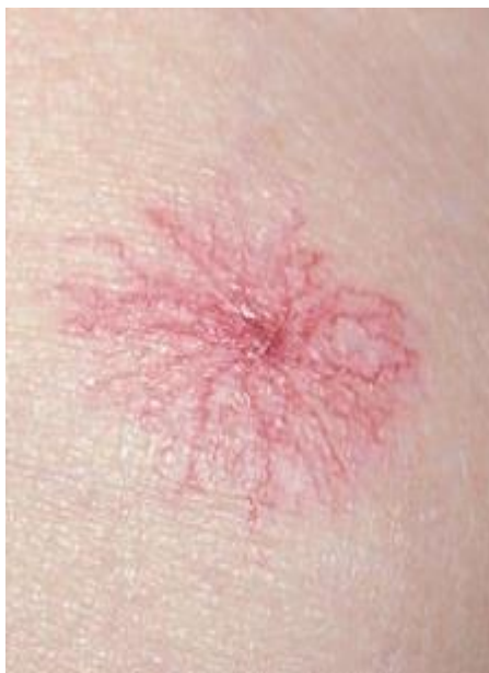
Slika 6. Spider nevus ; zrakasti crveni madež.

Pod utjecajem estrogena dolazi do pojave vaskularnih promjena kože, kao što su proširene kapilare na licu (teleangiektazije) i teleangiektatički madeži [„zrakasti“ crvenkasti nevus poput pauka – eng. spider nevus (slika 6)].