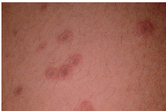
Slika 10. Herpes gestationis ; eritematozne i edematozne papulozne promjene.

ekstremiteta (dlanovi, stopala) te na leđima i prsima. Lice i sluznice su pošteđeni. Riječ je o eritematoznim, edematoznim papulama (slika 10), vezikulama, plakovima te bulama. Nakon puknuća vezikula/bula ostaju erozije prekrivene krustama. Ožiljci rijetko nastaju, no česte su rezidualne hiperpigmentacije. Pojava kožnih promjena ponekad je praćena općim simptomima poput povišene tjelesne temperature, zimice, slabosti te malaksalosti. Nakon poroda promjene nestaju.