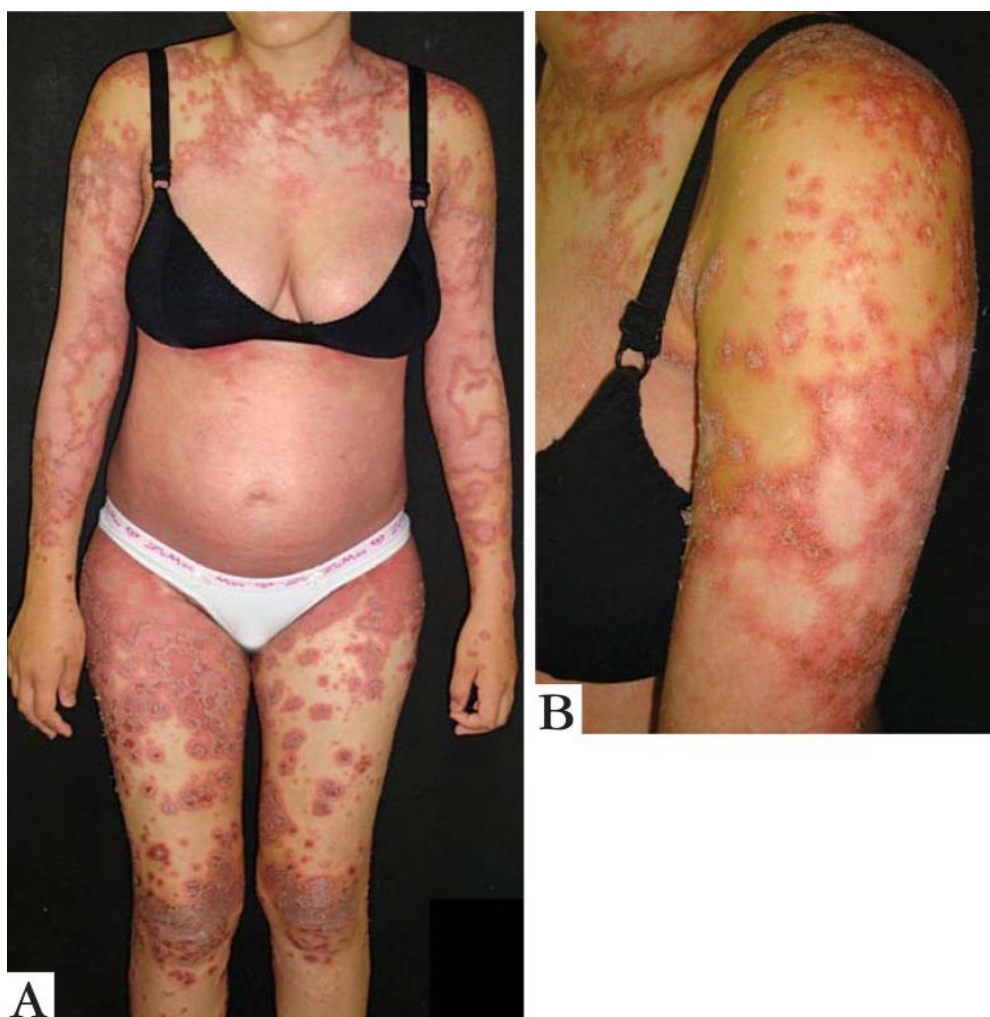
Slika 11. Impetigo herpetiformis ;

Izgled kožnih promjena kod impetigo herpetiformis je karakterističan. U početku nastaje nejasno ograničen eritem u intertriginoznim područjima, a potom uzdignuti plakovi koji su obrubljeni sitnim papulama (slika 11-A). Papule mogu konfluirati i poprimiti prstenasti izgled (slika 11-B). Središte lezije postaje erodirano i prekiveno krustama. Ožiljci ne nastaju, ali hiperpigmentacije često zaostaju.