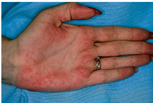
Slika 7. Palmarni eritem u trudnoći ; eritem dlana u trudnice.

Palmarni eritem (slika 7) javlja se u prvom tromjesečju trudnoće. Nastaje pod utjecajem estrogena i promjene tj. povećanja volumena krvi u trudnoći. Genetska predispozicija ima veliku ulogu u nastanku palmarnog eritema. Liječenje nije potrebno.