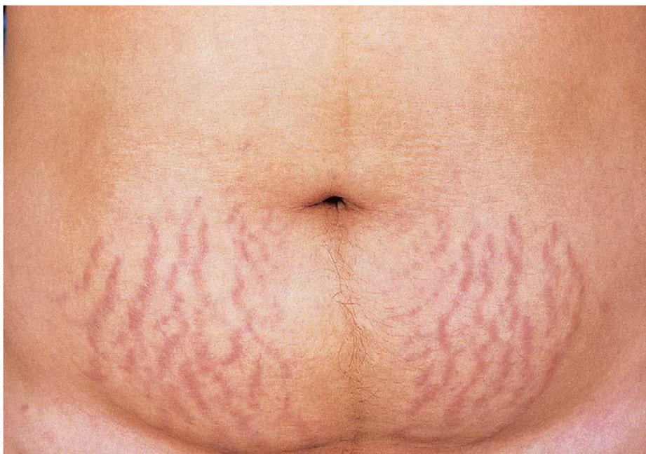
Slika 5. Striae gravidarum ; linearne promjene u području abdomena.

Strije su promjene na koži koje su posljedica oštećenja elastičnih vlakana kože s dehiscijencijom vezivnog tkiva, dok je epidermis intaktan. Strije najčešće nastaju između 6. i 7. mjeseca trudnoće. Postoje brojne teorije o nastanku strija. Govori se o utjecaju hormona, obiteljskoj sklonosti i rastezanju kože. Predilekcijska mjesta za nastanak strija u trudnoći su trbuh (slika 5), prsa i bedra. Makroskopski gledano, riječ je o lineranim, atrofičnim prugama koje nakon nekog vremena postaju elevirane. U početku su strije ljubičaste ili ružičaste boje, a nakon nekog vremena postanu bijele.