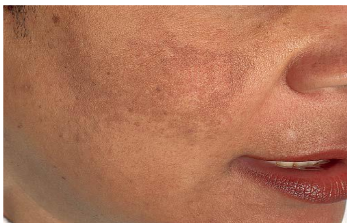
Slika 4. Melasma ; hiperpigmentacije u području obraza.

žena kao posljedica djelovanja hormona i sunčevog ultraljubičastog zračenja. Riječ je o ovalnim ili okruglim makulama koje su jasno ograničene od okolne kože, a koje mogu biti od žute do smeđe boje (slika 4).