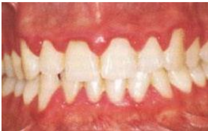
Slika 1. Trudnički gingivitis ; upalno promijenjena gingiva u trudnoći.

Glavni simptomi gingivitisa uključuju krvarenje, eritem, edematozno i hiperplastično oticanje gingive (slika 1). U najtežim slučajevima, moguća je pojava spontanog krvarenja i razvoj opsežnih ulceracije gingive (3).