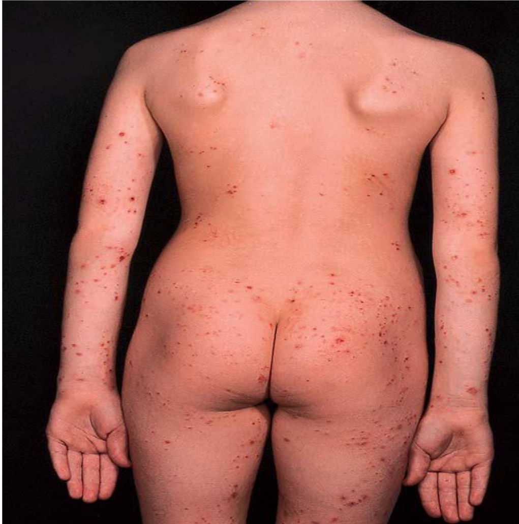
Slika 15. Prurigo gestationis „P“ tip; široko rasprostranjene eritematozne papule u području trupa i udova. Preuzeto: (8).

Eflorescencije reagiraju pozitivno na terapiju pa je prognoza za majku dobra, ali dijete ponekad može razviti atopijske promjene kože. Pri liječenju atopijskih erupcija u trudnoći, koriste se lokalni kortikosteroidni pripravci, a u težim se slučajevima primjenjuju sistemski kortikosteroidi uz antihistaminike. Kao dodatno sredstvo primjenjuje se i UVB terapija, u ranim stadijima trudnoće kod težih slučajeva (6,8,12).