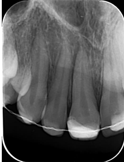
Slika 6. Rendgenski nalaz 12,11,21,22 nakon repozicije i imobilizacije fleksibilnim splintom

prekrivanje pulpe kalcij hidroksidom preko kojeg je apliciran kompozitni zavoj. Ozljeda sanirana.