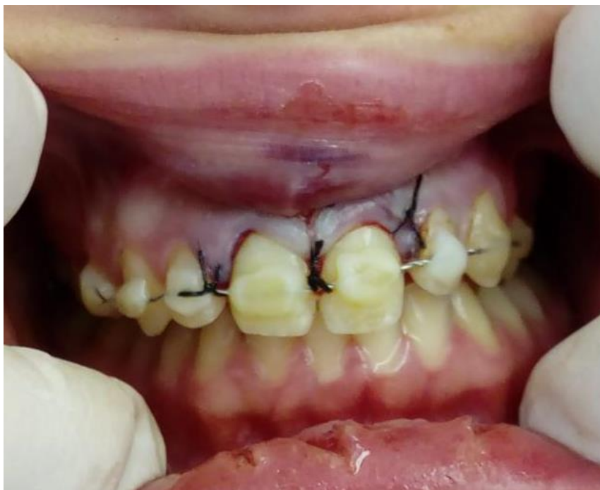
Slika 7. Imobilizacija fleksibilnim splintom od 15 do 24 i šavovi na gingivi i gornjoj usni