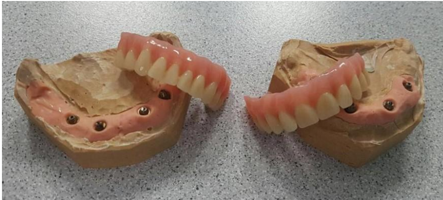
Slika 5. Trajne fiksne proteze. Preuzeto s dopuštenjem autora: izv. prof. dr. sc. Mato Sušić

što smo odredili granice sinusa, postavljamo vodilicu i pristupamo izradi ležišta za posteriorne implantate po istim načelima kao i u mandibuli. Dakle, postavljamo ih na način da vrhovi implantata koji su smješteni dublje u kosti međusobno konvergiraju u obliku slova V, a da su implantati, prema uputama na vodilici, u otklonu od aksijalne osi maksimalno 45°. Preparaciju radimo što je posteriornije moguće, imajući u vidu da ostavimo sigurnosnu zonu od 4 mm između implantata i sinusnog zida. Nakon pripreme ležišta i postave posteriornih, prelazimo na postavu anteriornih implantata, prema istim pravilima kao za mandibulu. Ostatak protokola ostaje isti. (Slika 5. Trajne fiksne proteze, Slika 6. Trajne fiksne proteze u ustima)