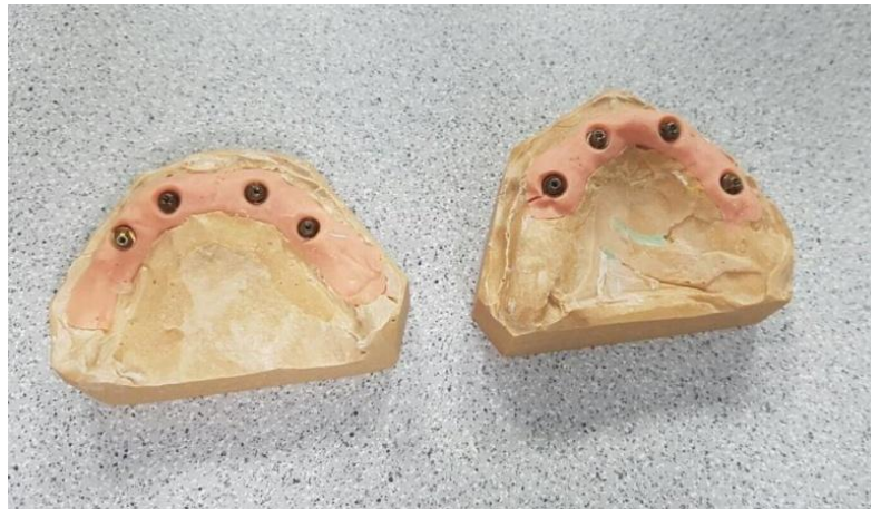
Slika 4. Modeli s replikama.

Nakon registracije međučeljusnih odnosa provjeravamo dosjed žiga, kako bi bio identičan u ustima i na modelu. Rade se dvije provjere. Prva uključuje provjeru na pacijentu. Skine se provizorij i žig se u komadu postavi na implantate gdje ne smije biti napetosti pri zatezanju. Rendgenski se provjere dosjedi. Zatim se žig diskom podijeli na 4 dijela, svaki se posebno stavi na svoj implantat i prostori između njih popune hladnopolimerizirajućim akrilatom. Vraćamo provizorij pacijentu, a žig tehničaru. Novi žig proba se na modelu i promatra se postoje li odstupanja. Ukoliko postoje, radi se modifikacija modela. Izvadi se ona replika u modelu na kojoj cilindar ne leži dobro i taj se dio sadre skine nožićem. Problematična replika se sada učvrsti za odgovarajući cilindar. Ostali cilindri na žigu se zategnu. Prazni se prostor u modelu puni sadrom ili akrilatom i tako smo dobili popravljene model. Tehničar izrađuje protezu u vosku. Skidamo provizorij i provjeravamo prototip proteze u vosku. Ako smo zadovoljni estetikom, fonetikom, funkcijom i podrškom usnama, šaljemo u laboratorij za izradu titanske konstrukcije. U idućoj posjeti provjeravamo dosjed titanske konstrukcije. Kad je rad gotov i stigao u ordinaciju, posljednji put skidamo provizorij. Učvršćujemo trajni rad bez napetosti i provjeravamo dosjed na rendgenu. Ukoliko je sve u redu otvore pečatimo teflonom i kompozitom. Preporučuje se pacijentu izraditi zaštitnu noćnu udlagu i predati u istom posjetu kad i gotov rad.