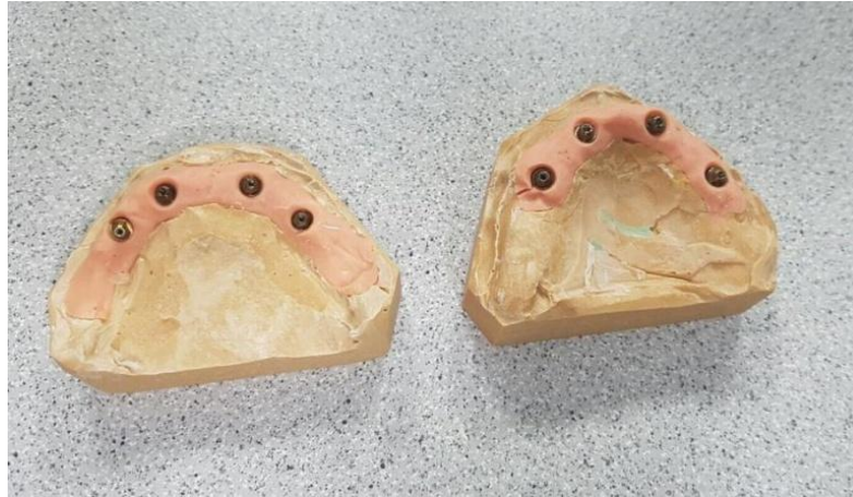
Slika 4. Modeli s replikama.

Nakon registracije međučeljusnih odnosa provjeravamo dosjed žiga, kako bi bio identičan u ustima i na modelu. Rade se dvije provjere. Prva uključuje provjeru na pacijentu. Skine se provizorij i žig se u komadu postavi na implantate gdje ne smije biti napetosti pri zatezanju. Rendgenski se provjere dosjedi. Zatim se žig diskom podijeli na 4 dijela, svaki se posebno stavi na svoj implantat i prostori između njih popune hladnopolimerizirajućim akrilatom. Vraćamo provizorij pacijentu, a žig tehničaru. Novi žig proba se na modelu i promatra se postoje li odstupanja. Ukoliko postoje, radi se modifikacija modela. Izvadi se ona replika u modelu na kojoj cilindar ne leži dobro i taj se dio sadre skine nožićem. Problematična replika se sada učvrsti za odgovarajući cilindar. Ostali cilindri na žigu se zategnu. Prazni se prostor u modelu puni sadrom ili akrilatom i tako smo dobili popravljene model. Tehničar izrađuje protezu u vosku. Skidamo provizorij i provjeravamo prototip proteze u vosku. Ako smo zadovoljni estetikom, fonetikom, funkcijom i podrškom usnama, šaljemo u laboratorij za izradu titanske konstrukcije. U idućoj posjeti provjeravamo dosjed titanske konstrukcije. Kad je rad gotov i stigao u ordinaciju, posljednji put skidamo provizorij. Učvršćujemo trajni rad bez napetosti i provjeravamo dosjed na rendgenu. Ukoliko je sve u redu otvore pečatimo teflonom i kompozitom. Preporučuje se pacijentu izraditi zaštitnu noćnu udlagu i predati u istom posjetu kad i gotov rad.