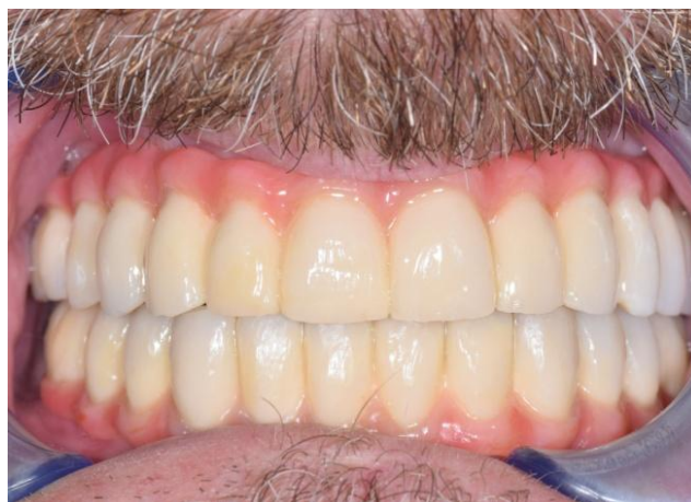
Slika 6. Trajne fiksne proteze u ustima.