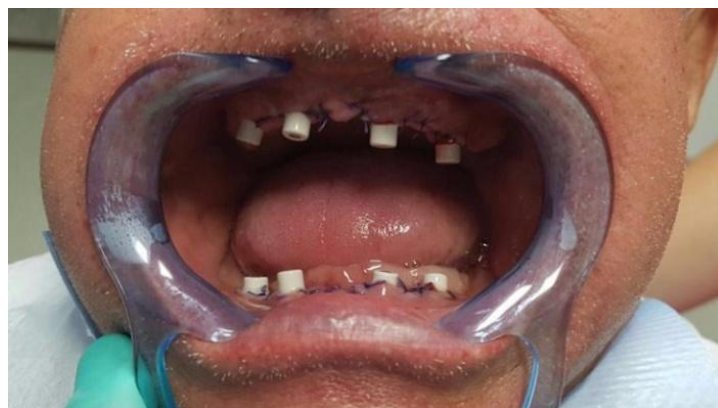
Slika 3. Healinzi.