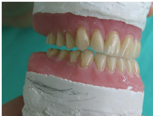
Slika 3. U završnoj protuzijskoj kretnji centralni incizivi i eventualno očnjaci su u kontaktu.