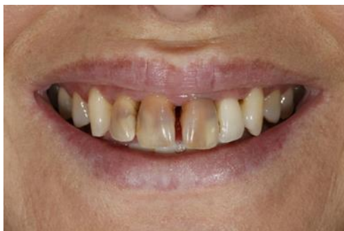
Slika 8. Endodontski uzrokovana diskoloracija zubi 12,11,21. Prije protetskog tretmana. Preuzeto: ljubaznošću Futura Dent Estetica

Endodontski uzrokovane diskoloracije uzrokovane su nestručnom trepanacijom sa zaostalim pulpnim tkivom ili nedovoljnim čišćenjem i brtvljenjem kanala. Zaostali dijelovi vitalnog tkiva u kavumu pulpe, uslijed nedostatne preparacije kaviteta dovode do prodiranja krvi u dentinske tubuluse, gdje krv hemolizira i dovodi do promjene boje zuba (Slika 8). Vrijeme do endodontskog tretmana i širina dentinskih tubula su u direktnoj vezi s intenzitetom promjene boje. Diskoloracija je naročito izražena u mlađih pacijenata zbog širokih kanala i širih dentinskih tubulusa (22).