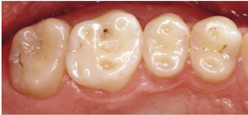
Slika 3. Zubi prije preparacije za keramički onleji. Preuzeto s dopuštenjem izdavača: (12)