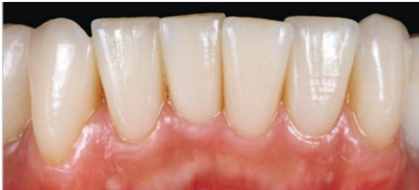
Slika 2. Ljudske (IPS d.SIGN, Ivoclar Vivadent) nakon cementiranja.

Ljudske se cementiraju adhezivnom tehnikom jer se izrađuju od keramika savojne čvrstoće ispod 400 MPa i nemaju retencijski oblik preparacije. Adhezivnim cementiranjem nastaje kemijska veza između ljudske i kompozitnog cementa. Time se mehaničko opterećenje prenosi na zub, dok se keramika rasterećuje (11). Adhezivni, odnosno kompozitni cementi otporni su na trošenje, imaju nisku topljivost, modeliraju se u izrazito tankom sloju te imaju visoku veznu čvrstoću. Zbog prirodne boje odlikuju se odličnim estetskim svojstvima (3, 11). S obzirom na način polimerizacije razlikuju se svjetlosno polimerizirajući, kemijski polimerizirajući i dvostruko (dualno) polimerizirajući cementi. Kako su ljudske tanki i translucetni nadomjesci koji omogućuju prodor svjetlosti, cementiraju se svjetlosno polimerizirajućim cementima. Kod njih terapeut sam određuje trenutak početka polimerizacije što je bitno jer je cementiranje ljudski zahtjevan postupak. Kod kemijskih i dvostruko polimerizirajućih cementata s vremenom je moguća promjena boje zbog aromatskih amina u njihovom sastavu. Danas su na tržištu sve više dostupni cementi koji ne sadrže aromatske amine (13). O izboru boje cementa ovisi završni izgled nadomjeska, osobito ako se radi o vrlo tankim i transparentnim ljudskama. Na tržištu su dostupne try-in paste za probu koje odgovaraju boji cementa te olakšavaju izbor odgovarajuće boje prije završnog cementiranja (14).