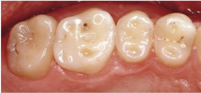
Slika 3. Zubi prije preparacije za keramički onleji.