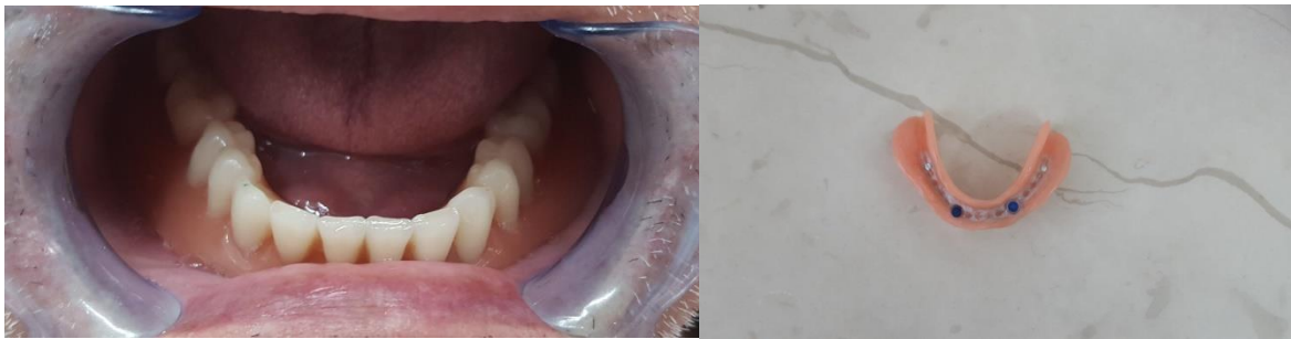
Slika 4 i Slika 5. Pokrovnna proteza nošena implantatima, RP-5.

Gross upozorava na vertikalnu udaljenost retencijskih elemenata od implantata (39). U slučajevima velike međučeljusne udaljenosti postoji potreba za nadoknadom velike količine mekih i tvrdih izgubljenih tkiva. Međutim, retencijski elementi (uglavnom prečke) trebaju biti što bliže implantatima kako bi se izbjegao nepovoljni okretni moment i smanjio biomehanički rizik gubitka implantata. Nadalje, Gross upozorava na veličinu distalnog sedla, koje bi trebalo biti što manje i bliže implantatu ili kvalitetno poduprto tkivnim ležištem. Slike 4 i 5 prikazuju donju pokrovnu protezu na implantatima.