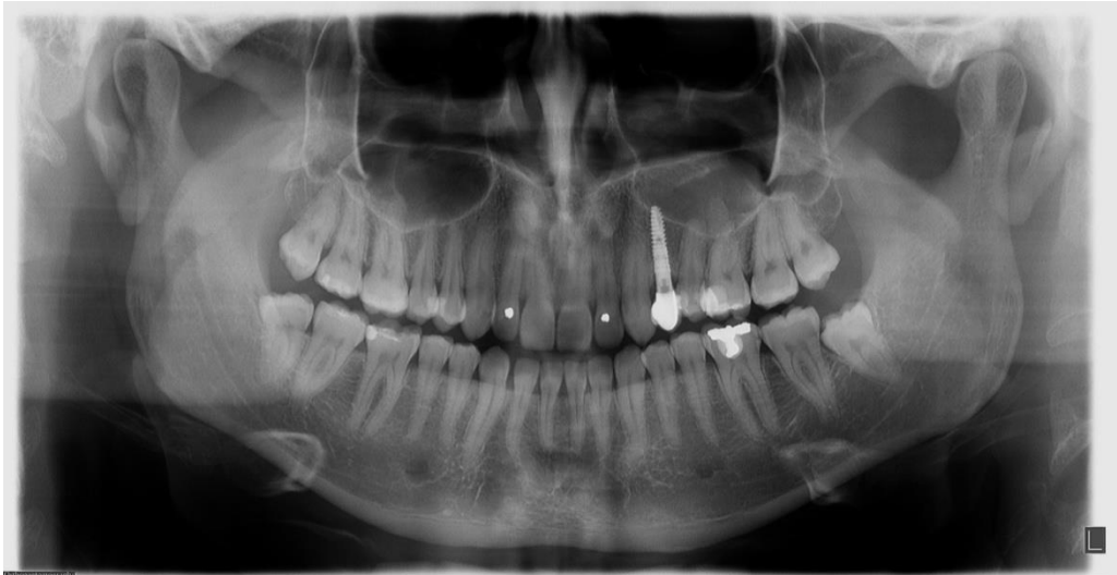
Slika 1. Solo kruna nošena implantatom 24.

Okluzija bi trebala biti dizajnirana tako da se smanje okluzijske sile na minimum te da se sve sile optimalno rasporede na prirodne zube (5). Stoga bi sve kretanje mandibule trebale biti vođene prirodnim zubima, bez ikakvih kontakta na krunici za vrijeme funkcijskih kretnji (26). Važno je osigurati opterećenje po aksijalnoj osi, smanjenje nagiba kvržica, široke fose 1-1,5mm (sloboda u centru) i okluzalne plohe manje površine (uže) (9, 11, 26). Da je širina okluzalne plohe važna pokazalo je istraživanje Balshia i suradnika gdje je za nadoknadu jednog molara bolje rezultate pokazalo korištenje dva implantanta (86). Pri nadoknadi jednog zuba preporučuje se 10 \mu m slobode od antagonista u položaju maksimalne interkuspidacije/habitualne okluzije (11).