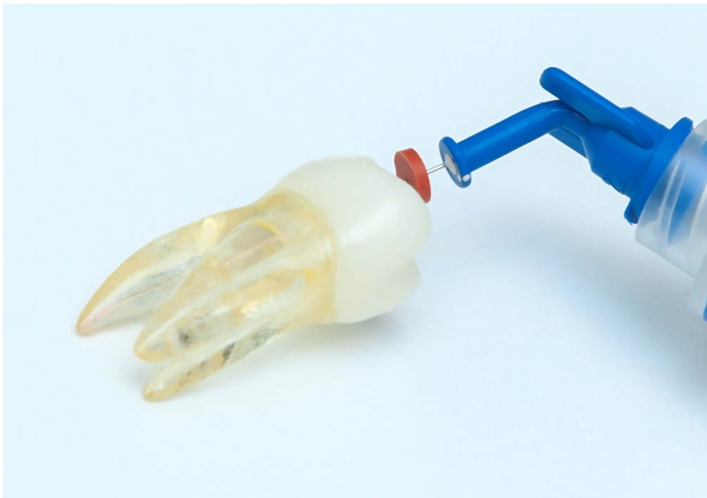
Slika 6. Igla štrcaljke u plastičnom zubu

kontinuirane tehnike. Obje metode pokazale su se kao učinkovite u uklanjanju debrisa iz kanala na ex vivo modelima kroz 3 min (46, 70).