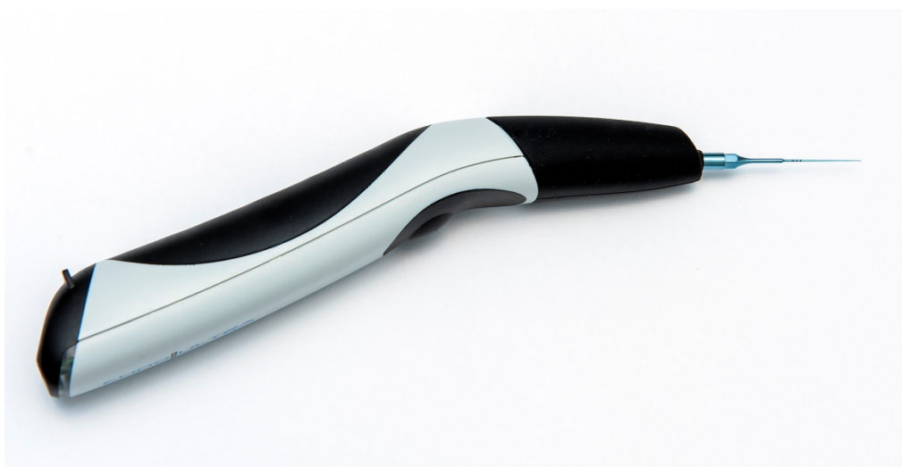
Slika 5. EndoUltra® je bežični ultrazvučni kolječnik za ispiranje kanala