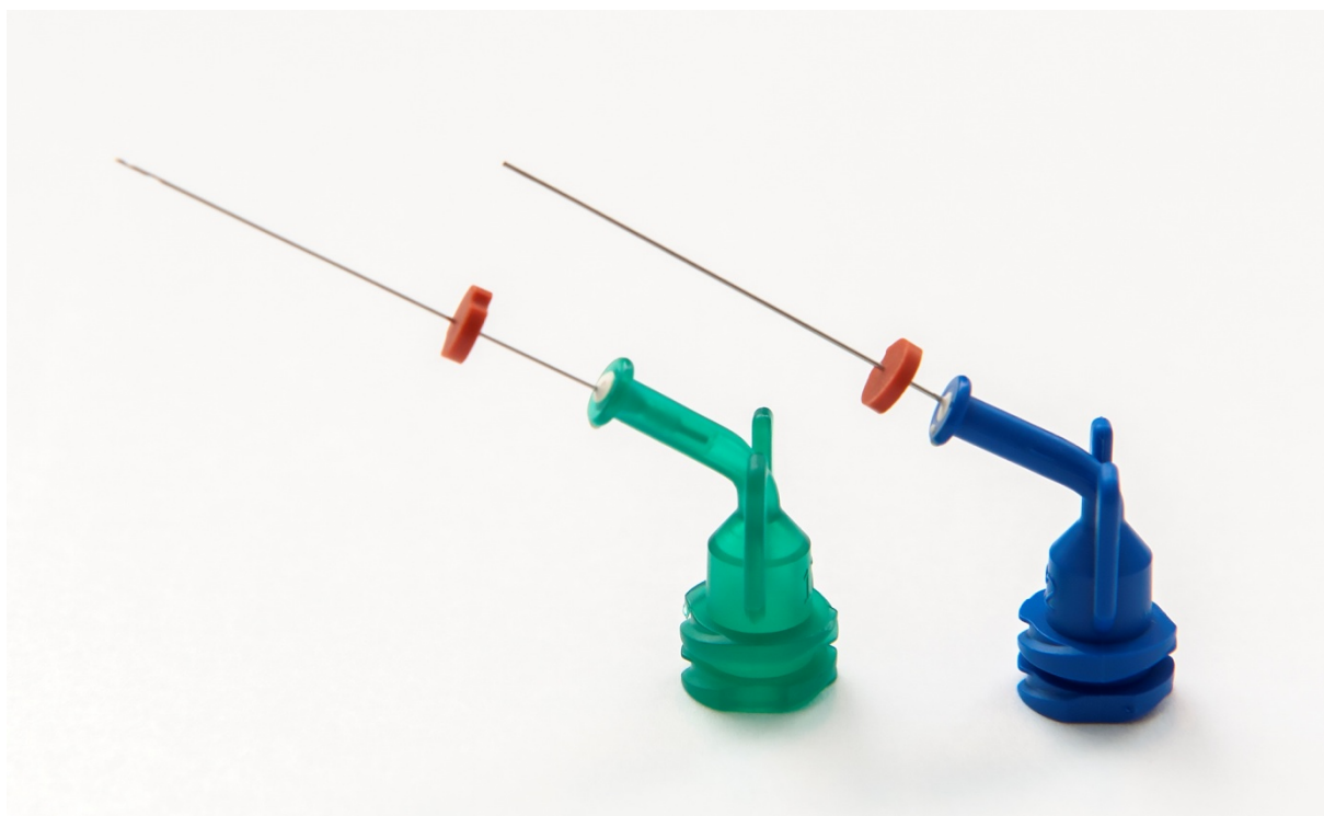
Slika 3. Posebno konstruirane igle za ispiranje korijenskog kanala, Ultradent™, SAD