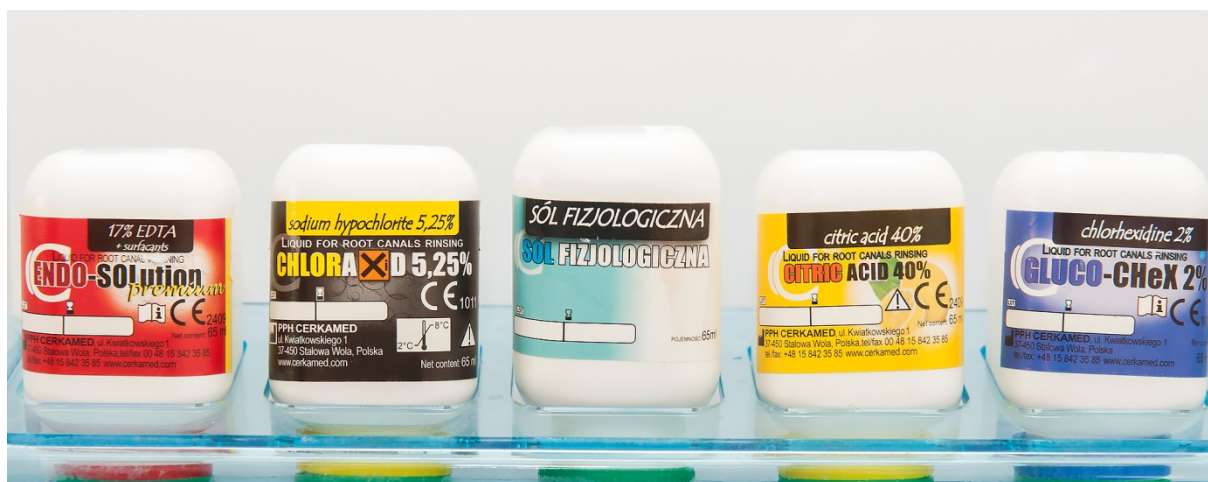
Slika 1. Tekućine za ispiranje korijenskih kanala

QMix® tekućinu preporuča se koristiti tijekom završnog ispiranja, nakon NaOCl-a. MTAD i QMix® počinju se sve više koristiti kao finalni irigansi umjesto EDTA-e i NaOCl-a jer je dokazano da upotreba NaOCl-a nakon demineralizirajućeg irigansa uzrokuje dentalnu eroziju (28, 31).