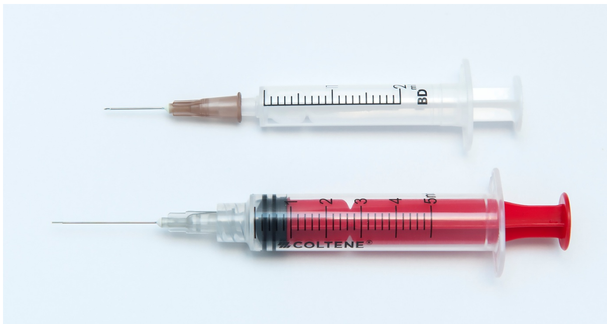
Slika 2. Štrcaljke za ispiranje korijenskog kanala