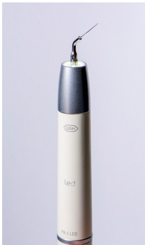
Slika 4. Piezo ultrazvučni uređaj za irigaciju, W&H™, Austrija

oblika kanala dovedena je na minimum. Instrumenti veći od #20 ne preporučaju se za upotrebu, osim u jako širokim kanalima, zbog smanjene mogućnosti proizvodnje mikrostrujanja i zapinjanja instrumenta u kanalu (46).