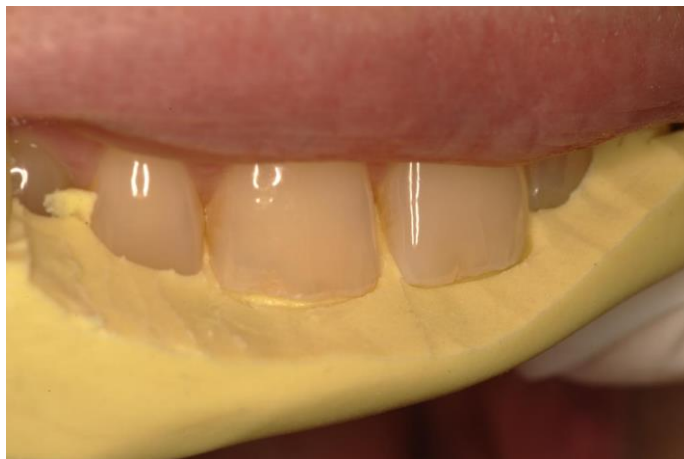
Slika 4. Silikonski ključ izrađen od kondenzacijskog silikona.