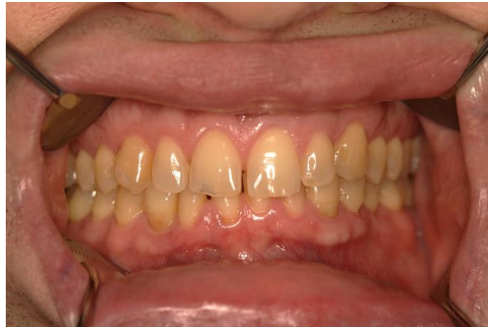
Slika 1. Trošenje zubi nastalo kombinacijom različitih mehanizama. Vidljivi cervikalni defekti, translucenost incizalnih bridova, erozivne promjene.

Mnoga istraživanja pokazala su da je etiologija nekarijesnih oštećenja generalno multifaktorijalna (8). Interakcijom kemijskih, bioloških, mehaničkih i bihevioralnih čimbenika dolazi do pojave više od jednog oblika trošenja kod pojedinog pacijenta (Slika 1). Pojedinom mehanizmu ne može se pripisati određeno nekarijesno oštećenje (20).