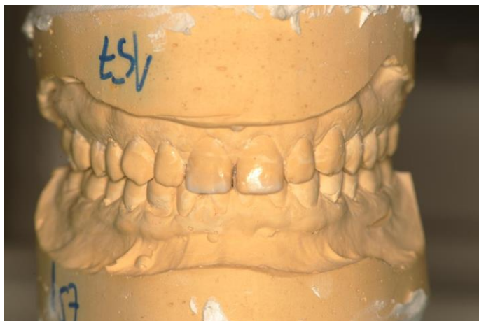
Slika 2. Wax-up na sadrenom modelu.

Pacijentu je moguće trodimenzionalno prikazati kakav će biti konačan izgled kompozitne restauracije. To se radi pomoću wax-upa, tj. tehnike nanošenja voska na studijski model koji je prethodno izrađen na temelju alginatnog otiska u svrhu dijagnostike i planiranja (Slika 2). U artikulatoru je moguće provjeriti i funkciju budućeg nadomjestka te njihov smještaj u maksimalnoj interkuspidaciji (MI) i kliznim kretanjama da bi se izbjeglo postojanje okluzijskih interferenci (Slika 3). Navoštenu model moguće je prenijeti u usta pacijenta radi lakše vizualizacije izrada budućeg rada. Izradi se privremeni predložak, mock-up, od kemijski polimerizirajućeg akrilata ili svjetlosno polimerizirajućeg kompozita. Za izradu mock-upa, ali i konačne restauracije koristi se silikonski ključ (Slika 4). To je otisak navoštenog sadrenog modela pomoću prozirnog ili neprozirnog silikonskog materijala. Silikonski ključ puni se odabranim materijalom i postavlja u usta pacijenta do stvrđavanja. U slučaju korištenja prozirnog silikonskog materijala, svjetlosna polimerizacija provodi se preko silikonskog ključa (34). Slika 5. prikazuje izgled konačne restauracije gornjih središnjih sjekutića kompozitnim materijalom nakon rekonstrukcije uz uporabu silikonskog ključa.