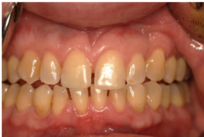
Slika 5. Restauracija gornjih središnjih sjekutića kompozitnim materijalom.