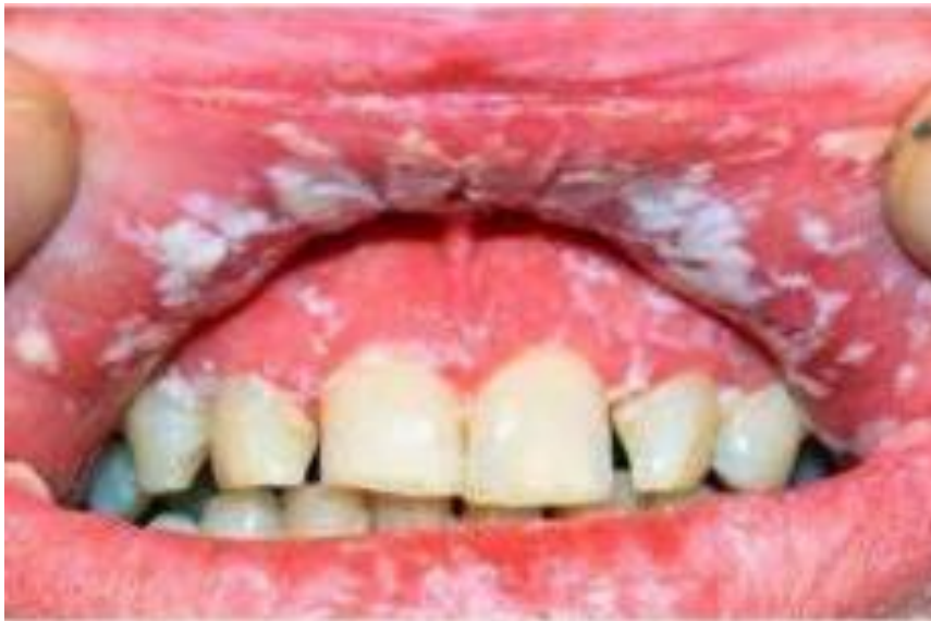
Slika 3. Akutna pseudomembranozna kandidijaza. Preuzeto sa (32).

Upotreba antibiotika širokoga spektra može dovesti do pojave kandidijaze u usnoj šupljini. Najčešće je uzrokovana Candidom albicans , a uz upotrebu antibiotika predisponirajući faktori mogu biti loša oralna higijena, kserostomija, totalne proteze, terapija imunosupresivima ili kortikosteroidima (29). Uz antibiotsku terapiju najčešće vežemo akutnu pseudomembranoznu kandidijazu koja je karakterizirana bjelkastim lezijama na sluznici usne šupljine, eritematoznom podlogom nakon struganja lezije ili plitkim ulceracijama. Može se pojaviti i akutna atrofična kandidijaza kod koje je prisutan atrofični epitel sluznice, eritematozni dijelovi i depapilacija jezika (30).