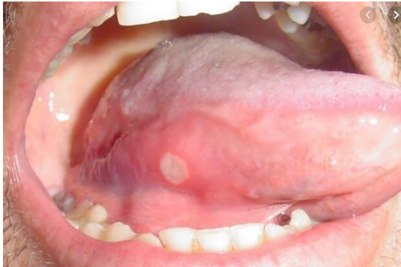
Slika 2. Afte major. Preuzeto sa (31).

Antibiotici mogu uzrokovati i sindrom pekućih usta, glositis ili nespecifične oralne ulceracije i mukozitis. Sindrom pekućih usta stanje je koje je još poznato pod imenom stomatopiroza, a definirano je osjećajem pečenja usnica, jezika i nepca, ali bez vidljivih oštećenja oralne sluznice. Ovaj je sindrom povezan sa psihičkim simptomima, osobe koje pate od njega obično su anksiozne, depresivne, razdražljive ili imaju strah od razvoja karcinoma. Osjećaj pečenja pojačava se prema kraju dana, a nakon jela se smanjuje ili ostaje isti (29).