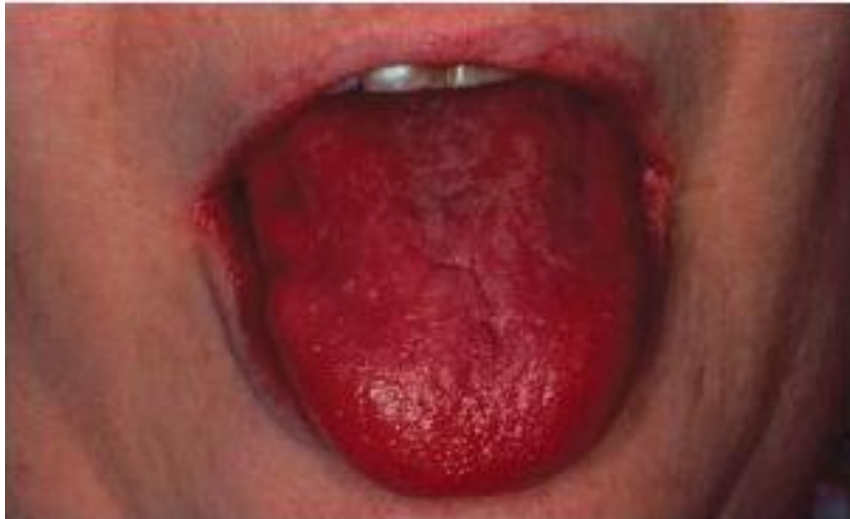
Slika 4. Akutna atrofična kandidijaza. Preuzeto sa (33).

Od ostalih promjena oralne mukoze nakon terapije antibioticima mogu se pojaviti Lingua villosa i Lingua villosa nigra , poremećaj okusa (metronidazol, sulfonamidi), angularni heilitis (tetraciklini) te uvećanje žlijezda slinovnica (sulfonamidi) (29, 30).