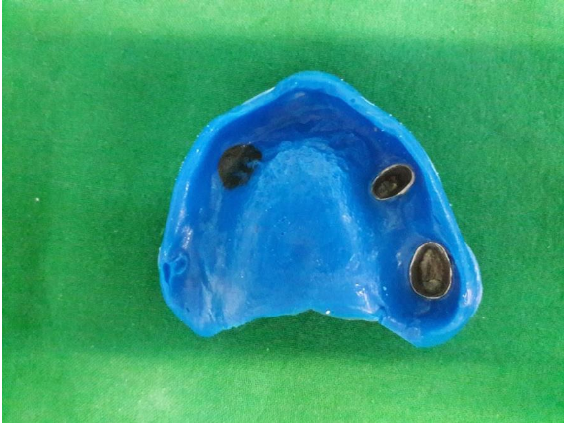
Slika 9. Funkcijski otisak za gornju djelomičnu protezu s kunicama unutar otiska.

Funkcijski rubovi na otisku donje čeljusti napravljeni su također pomoću termoplastičnog materijala (Kerr Impression compound material, Kerr, Bioggio, Švicarska), a završno je otisak napravljen kondenzacijskim silikonom rijetke konzistencije (Xantopren L, Heraeus Kulzer, Hanau, Njemačka). Otisak je uziman kombinacijom pasivnih (masiranje obraza i usana) i aktivnih (gutanje sline, postavljanje jezika na vrh gornje usnice, oblizivanje gornje usnice od kuta do kuta usana) kretnji.