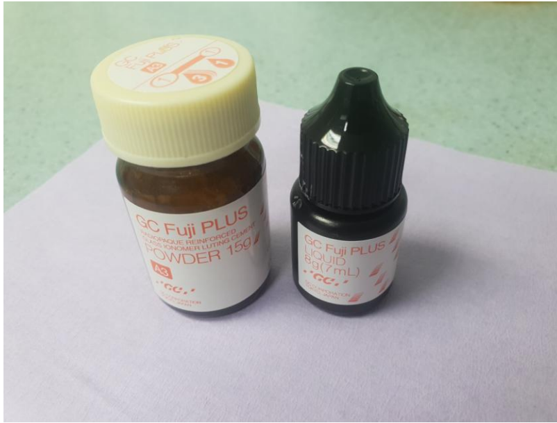
Slika 5. Staklenoionomerni trajni cement ( GC Fuji PLUS )

Pojavom bezmetalnih protetskih konstrukcija i visoko postavljenim estetskim standardima, u modernoj stomatologiji sve se više koriste kompozitni cementi. Njihova je prednost u odnosu na druge trajne cemente adhezija na tvrda zubna tkiva i nadomjestak, netopljivost u vlažnom mediju, krase ih izuzetna mehanička i estetska svojstva, boja i translucencija. Čine tzv. monoblok: zub (nadogradnja) – kompozitni cement – nadomjestak. Zbog izuzetnih mehaničkih svojstava, kompozitnim cementima cementirani nadomjesci podnose veće vrijednosti žvačne sile. Prema načinu polimerizacije, kompozitni cementi mogu biti kemijski i svjetlosno polimerizirajući, ovisno o kemijskom sastavu. Sve češće dolaze u dualnom obliku gdje su oba načina polimerizacije moguća. Sastoje se od umjetne smole, odnosno od metaakrilata i nekih drugih metaakrilatnih monomera, anorganskih punila, katalizatora, stabilizatora i pigmenata. U sastavu mogu biti i samojetkajuće komponente kao i aktivatori za kemijsko ili svjetlosno stvrdnjavanje ili oboje (82, 83).