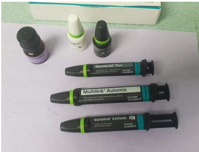
Slika 6. Kompozitni trajni cementi

kod potpunokeramičkih radova potrebno je pripremiti keramiku fluorovodičnom kiselinom i silanom. Danas se te dvije komponente mogu naći u jednom proizvodu što skraćuje i olakšava pripremu (73).