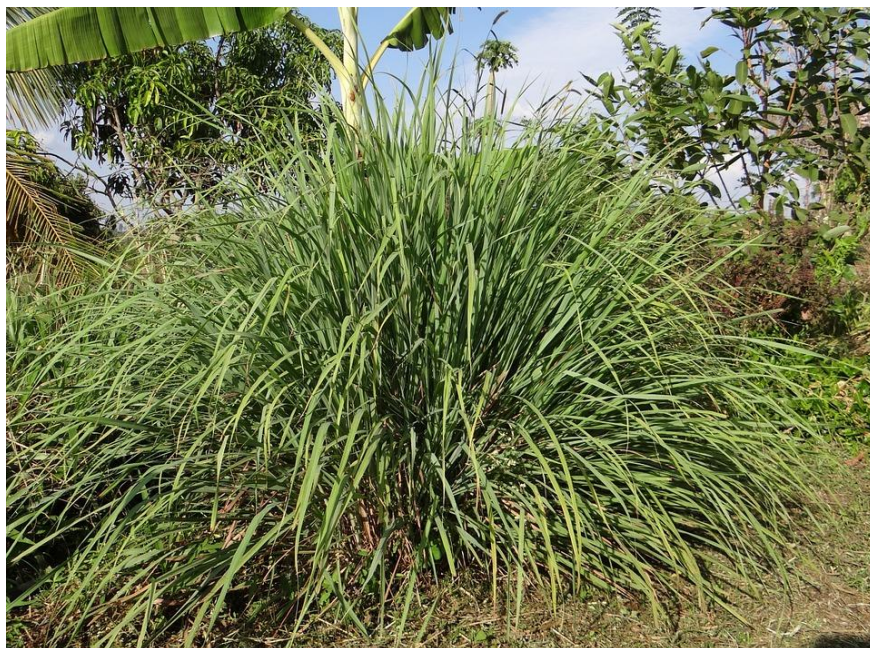
Slika 7. Limunska trava. Preuzeto s dopuštenjem izdavača iz: (7).