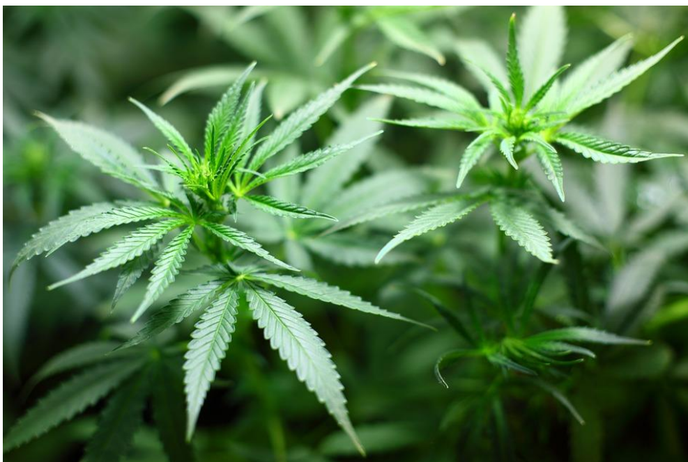
Slika 9. Kanabis.

Pušenje je najvažniji bihevioralni faktor za stanje parodontitisa. Dublja inhalacija, prolongirani kontakt i vrijeme apsorpcije, koji se povezuju s pušenjem kanabisa (Slika 9.), mogli bi sudjelovati u etiologiji parodontne bolesti. Provedena je prospektivna kohortna studija na 903 sudionika na Novom Zelandu. Sudionici su podijeljeni u tri skupine. 293 sudionika nisu konzumirala kanabis, 428 njih bilo mu je eksponirano ponekad, a često njih 182. Pronađeni gubitak pričvrstka u spomenutim grupama iznosio je redom 6,5 %, 11,2 % i 23,6 %. Autori zaključuju da bi kanabis mogao predstavljati faktor rizika za parodontnu bolest, a taj je faktor neovisan o pušenju duhana (56).