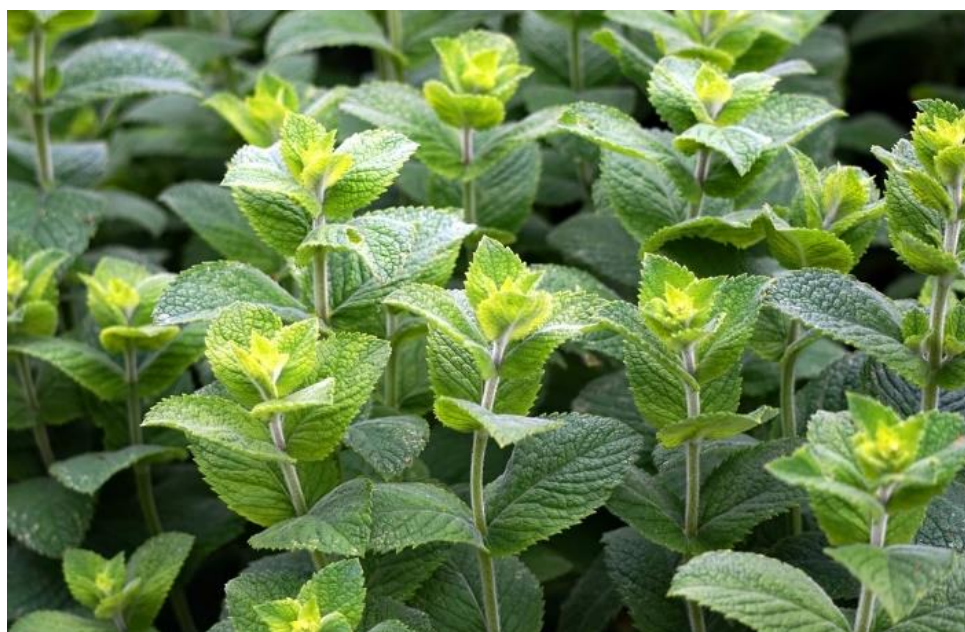
Slika 17. Menta. Preuzeto s dopuštenjem izdavača iz: (7).

Eterično ulje mente (Slika 17.) ima snažno antibakterijsko i protugljivično djelovanje te djeluje rashlađujuće na sluznicu. Pomaže u prevenciji oralnog mukozitisa kod pacijenata na kemoterapiji te je sigurno i dobro tolerirano u obliku otopina za ispiranje (122).