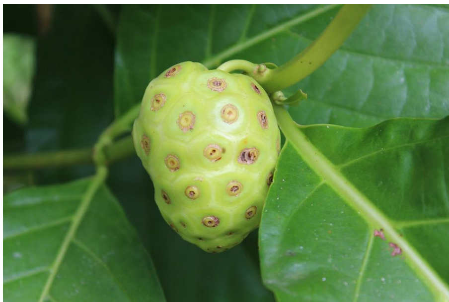
Slika 18. Voće biljke Morinda citrifolia .

kemomehaničke obrade kanala. Rezultati su pokazali kako nije bilo razlike u broju aerobnih i anaerobnih bakterija između triju ispitanih otopina (153).