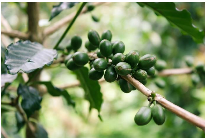
Slika 13. Voće zelene kave. Preuzeto s dopuštenjem izdavača iz: (7).

Dokumentiran je i antibakterijski potencijal smjese triju ajurvedskih biljaka Terminalia chebula , Terminalia bellirica , Emblica Officinalis , znane kao trifala, te njihov pojedinačni potencijal. Prema ajurvedskoj formuli, trifala se priprema kombinacijom jednakih omjera osušenih plodova spomenutih biljaka. Svrha istraživanja bila je odvojeno odrediti utjecaj vodenih ekstrakata trifale te biljaka koje ona sadrži na broj Sm . Svi ispitanici dobili su sve četiri otopine za ispiranje, 15 ml svježe pripremljene 10%-tne otopine. Uzorci sline prikupljeni su 5 minuta i sat vremena nakon ispiranja. Sve četiri otopine pokazale su utjecaj na smanjenje broja Sm , međutim ajurvedska formula trifala pokazala je najbolje rezultate među danim otopinama (83).