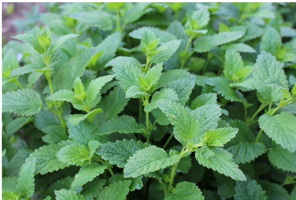
Slika 16. Matičnjak.

Hrast Quercus persica , odnosno njegovo voće (žir) sadrži škrob, proteine, ulja i tanine s visokim sadržajem amiloze i amilopektina. To se voće pokazalo korisnim u liječenju anemije, proljeva, a neke studije indiciraju i njegovo antiviralno, antibakterijsko i protuupalno djelovanje. Ti učinci pripisuju se njegovoj fenolnoj komponenti, posebice flavonoidima i taninima. Sugerira se da taninske komponente voća tog hrasta in vitro imaju značajne učinke na replikaciju virusa pomoću različitih mehanizama djelovanja i s minimalnom citotoksičnosti (113).