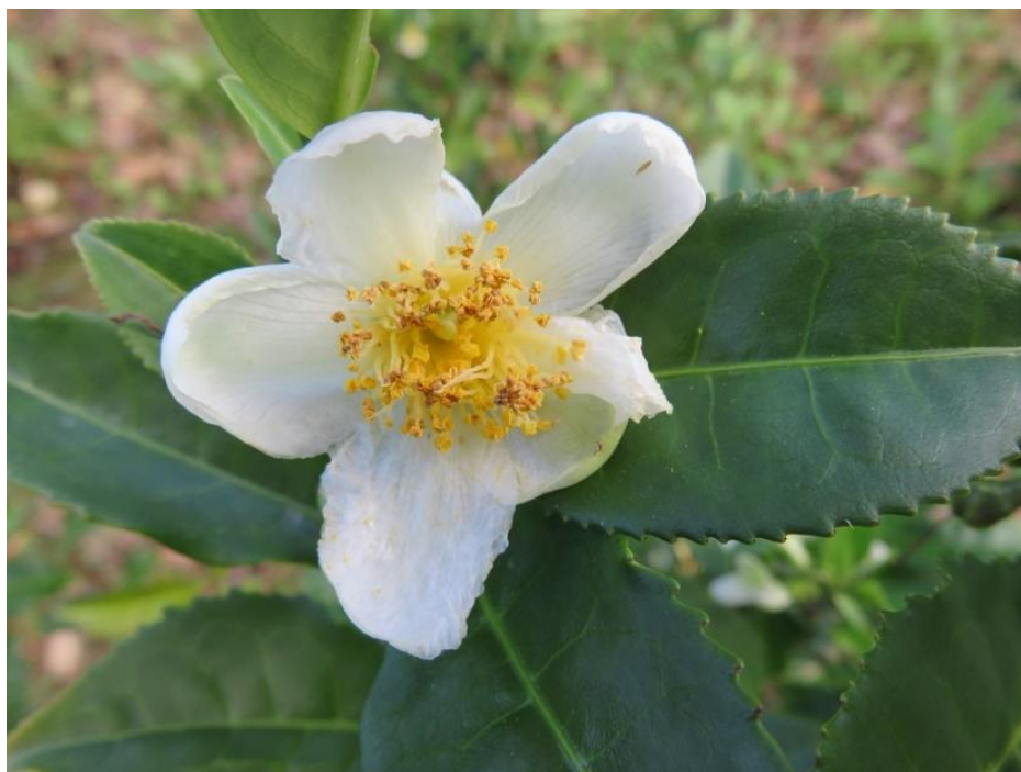
Slika 2. Zeleni čaj. Preuzeto s dopuštenjem izdavača iz: (7).

Zeleni čaj također pokazuje inhibitornu aktivnost na MMP, konkretno MMP-13 in vitro , kao i nim i aloe vera u ranije spomenutom istraživanju. Za to je odgovoran njegov glavni katehin epigalokatehin-galat (EGCG). Metanolni ekstrakt zelenog čaja i EGCG (95%-tne čistoće) testirani su in vitro na sposobnost inhibicije MMP-9 i/ili inhibicije njegova otpuštanja iz neutrofila. Ekstrakt čaja i EGCG potpuno su inhibirali aktivnost MMP-a te dodatno smanjili otpuštanje enzima iz stimuliranih neutrofila za 62,01 % odnosno 79,63 %, a iz nestimuliranih za 52,42 % odnosno EGCG za 62,33 %. Preporučuju se, dakako, daljnje studije in vivo kako bi se zeleni čaj implementirao u proizvode za oralnu higijenu (14).