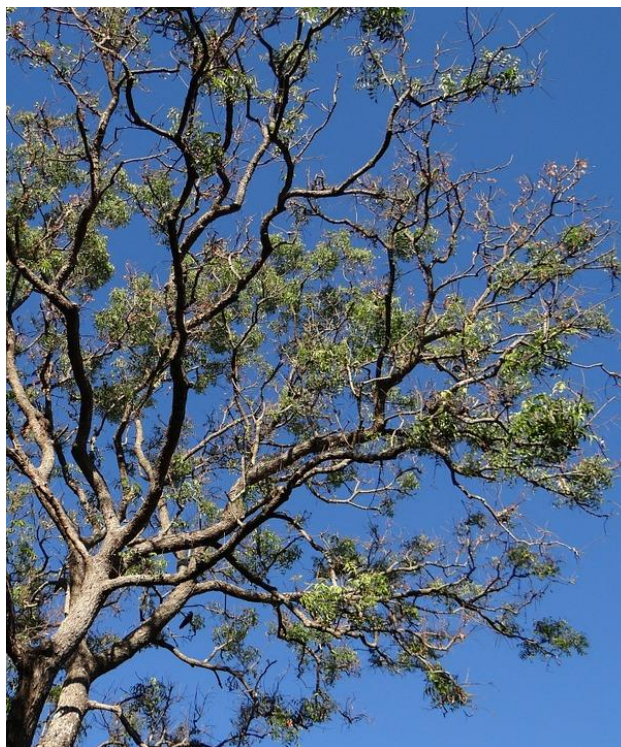
Slika 1. Drvo nima.

imale su SRP, dok je na jednu stranu luka dodatno postavljen neapsorbirajući čip nima. Rezultati su pokazali statistički značajno smanjenje Porphyromonas gingivalis na strani s nimom (6).