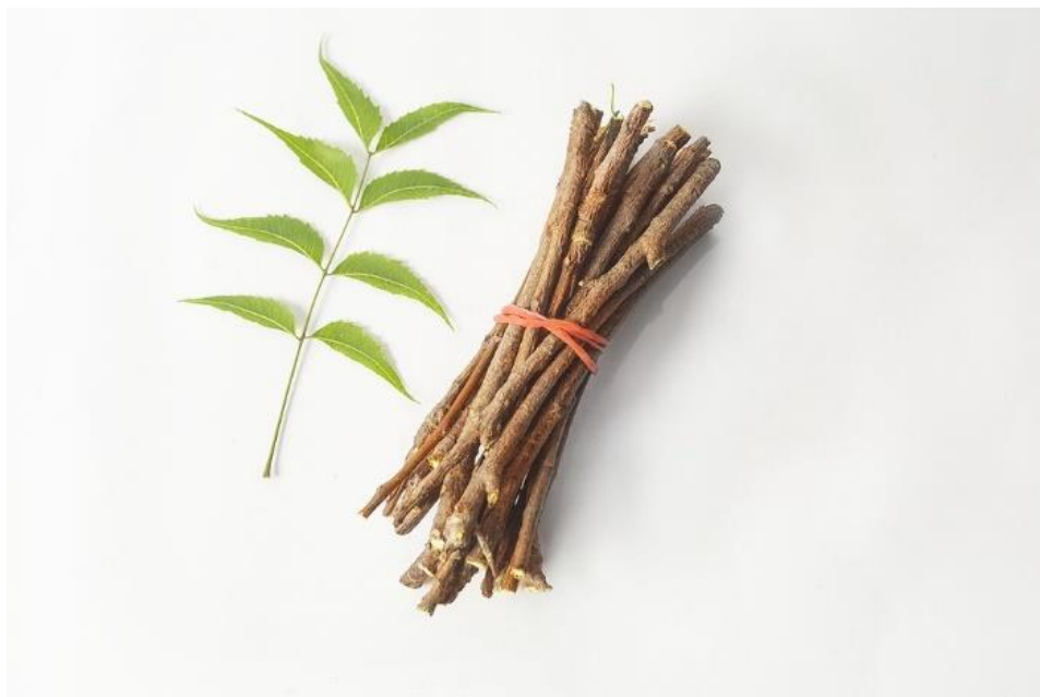
Slika 10. Arak ( Salvadora persica ). Preuzeto s dopuštanjem izdavača iz: (7).

Osim vodenog ekstrakta, i ulje nima u 5%-tnoj koncentraciji pokazalo se učinkovitim protiv formiranja plaka. S obzirom na to da CHX ima svoje nuspojave u vidu obojenja zuba, biljne alternative bez nuspojava ili s manje njih čine se kao privlačno rješenje (60).