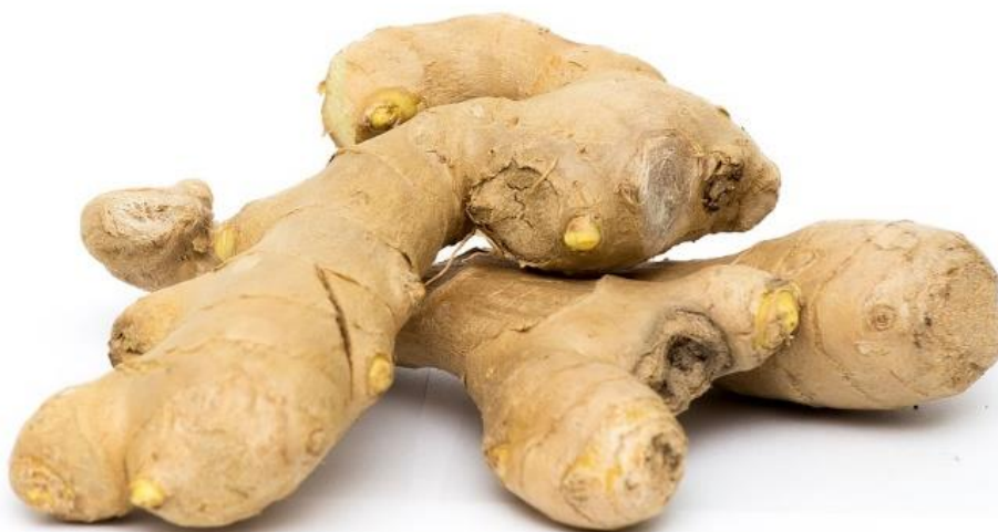
Slika 14. Gomolj đumbira.

Ekstrakt đumbira (Slika 14.) još je jedan zanimljivi prirodni antifungalni proizvod. Pokazuje potentno antifungalno svojstvo protiv flukonazol-rezistentne Ca izolirane kod pacijenata s genitalnom kandidijazom, dok izvješća o njegovim nuspojavama još ne postoje. Uspješan je protiv biofilma Ca i Candida krusei , no nistatin i flukonazol ipak su se pokazali boljima (96).