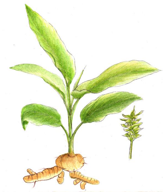
Slika 6. Curcuma longa . Preuzeto s dopuštenjem izdavača iz: (7).

Guimaraes i suradnici proučavali su kako kurkumin modulira imuni odgovor kod umjetno inducirane parodontne bolesti kod štakora. Nakon što je kurkumin dan štakorima oralnim putem, mjerila se ekspresija interleukina (IL)-6, tumor-nekrotizirajućeg faktora (TNF)- \alpha i prostaglandin E2 sintaze kako bi se analizirao imuni odgovor. Kurkumin je učinkovito inhibirao gene odgovorne za ekspresiju citokina. Time je značajno smanjio upalni infiltrat i povećao broj fibroblasta i kolagena. Iako su potrebna daljnja istraživanja, kurkumin je pokazao terapijski potencijal kod tog kroničnog upalnog stanja (27).