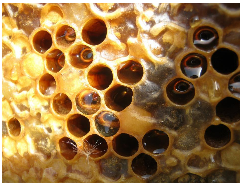
Slika 3. Pčelinji vosak u saću.

Zbog toga je otopina za ispiranje s propolisom ispitana s fiziološkom otopinom (negativna kontrola) i CHX-om (pozitivna kontrola). Praćeni su plak i gingivni indeks. CHX se pokazao boljim od propolisa u inhibiciji nastanka plaka. Propolis je bio uspješniji u marginalnom dijelu od CHX-a zbog poboljšanja gingivnih indeksa (16).