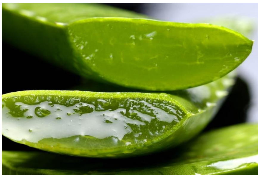
Slika 11. Listovi aloe vere bogati gelom. Preuzeto s dopuštenjem izdavača iz: (7).

dviju faza uklanjanja karijesa postojala statistički značajna razlika u broju mikroba u svim skupinama. Između druge i treće faze postojala je statistički značajna razlika u svim testnim skupinama (u kontrolnoj ne). Najuspješnijim u smanjenju broja mikroba pokazao se 2%-tni CHX, zatim 1%-tna otopina ulja čajevca i na kraju aloe vera. Autori zaključuju da bi se spomenuti prirodni agensi mogli koristiti u dezinfekciji kaviteta i prevenciji sekundarnog karijesa (79).