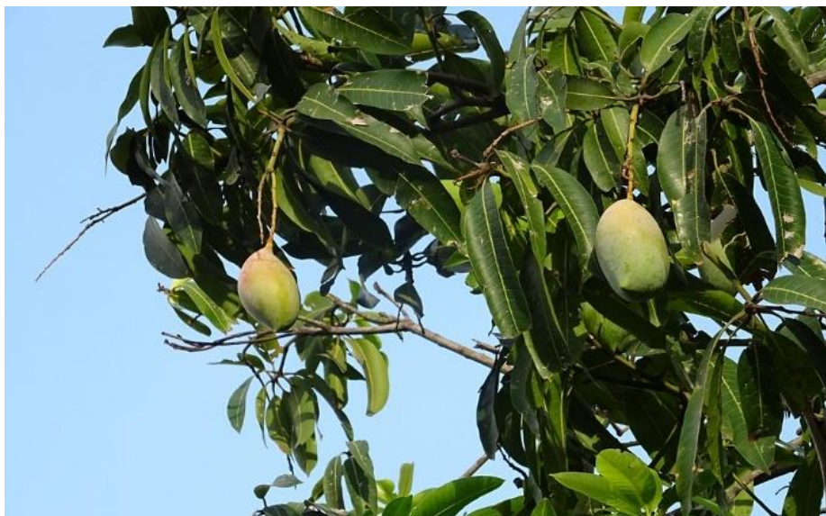
Slika 12. Biljka Mangifera indica (lišće i voće). Preuzeto s dopuštenjem izdavača iz: (7).

Mango i indijski orah te njihov antimikrobni i citotoksični učinak in vitro proučavali su Anand i suradnici. Koristili su etanolne ekstrakte i proučavali njihov učinak na Enterococcus faecalis (Ef), S. aureus , Sm , Escherichia coli i Ca . Citotoksični efekt određivao se na humanim gingivnim fibroblastima i fibroblastima pluća kineskih miševa. Indijski oraščić i mango pokazali su statistički značajno bolji učinak na testne patogene u odnosu na otopinu povidon-jodida te su bili značajno manje toksični (81).