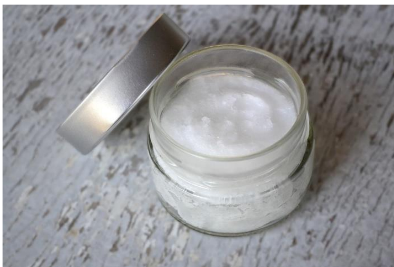
Slika 4. Kokosovo ulje.

Kokosovo ulje bilo je predmet još jednog istraživanja zbog svog sastava laurinske kiseline. Laurinska kiselina, koje u kokosovu ulju ima 45 – 50 %, ima dokazano protuupalno i antimikrobno djelovanje. Kod 60 ispitanika tinejdžerske dobi s plakom induciranim gingivitisom u dnevnu higijensku rutinu uvedeno je ispiranje uljem. Primijećena je statistički značajna razlika u indeksima plaka i gingive, koji su se smanjivali kako je istraživanje odmicalo u kasnije faze. Zaključak istraživanja bio je da bi kokosovo ulje, kao lako dostupna namirnica, moglo biti pomoćno sredstvo u reduciranju plaka i upale gingive (24).