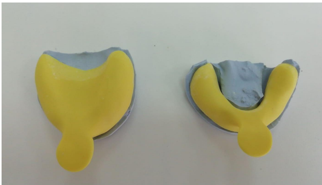
Slika 4. Individualne žlice na modelima

Izrada započinje tako da se model premaže sredstvom za izolaciju, a preostali zubi, bezubi grebeni i nepčani dio prekriju se svjetloružičastim voskom debljine 0,5 milimetra. Nakon toga na model se stavlja smjesa samovezujućeg akrilata. Rubovi individualne žlice moraju zaobići nabore sluznice i završiti 2 do 3 milimetra ispod granične zone (20).