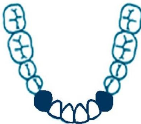
Slika 4. Šesteročlani most za nadoknadu donjih centralnih i lateralnih sjekutića, obostrano sidren na očnjacima

Gubitak donja četiri sjekutića nadomješta se sidrenjem na očnjacima. Sanacija gubitka više od četiri zuba ovisi o tome koji su zubi izgubljeni kao i o topografskom odnosu preostalih zubi. Ako se radi o manjku više od četiri zuba u nizu, indicirana je djelomična proteza (4). Ukoliko u donjoj čeljusti nedostaju tri inciziva, a preostali inciziv je parodontološki loš i avitalan zub, indicirana je ekstrakcija preostalog inciziva i izrada mosta sidrenog na očnjacima (Slika4.) . Složenija je situacija kada nedostaje očnjak i još dva susjedna zuba. U tom slučaju nužno je uključiti sekundarne nosače koji imaju očuvan potporni aparat. Ako nedostaje očnjak i još tri susjedna zuba, izrada mosta je kontraindicirana. Posebni su slučajevi gdje nema tri, četiri ili pet zuba pri čemu između rezidualnih grebenova postoji središnji nosač. Neki od tih mostova se segmentiraju u slučaju očuvanog potpornog aparata zuba. Ako je koštana potpora zuba nosača oslabljena, preporučuje se izrada jednokomadne mosne konstrukcije koja rigidno povezuje nosače (3).