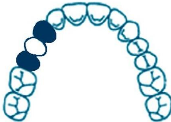
Slika 1. Tročlani most obostrano sidren na očnjaku i drugom premolaru

Gubitak jednog zuba iz statičkih razloga treba riješiti obostranim sidrenjem, tj. mostom od tri člana (Slika1.) . Nema dvojbe da je ovo statički najpovoljnije rješenje (11).