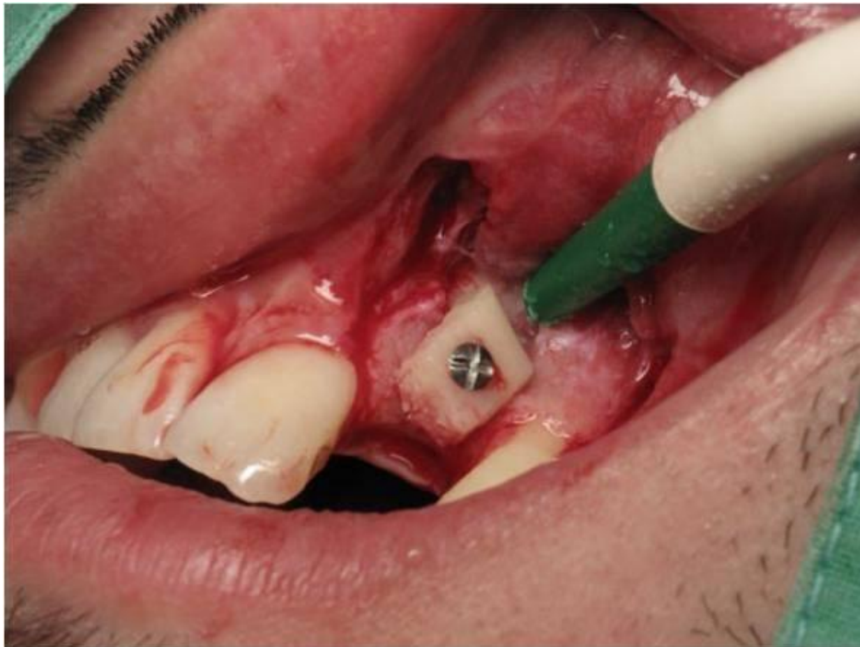
Slika 5. Kombinacija ksenogenog materijala i autolognog transplantata.