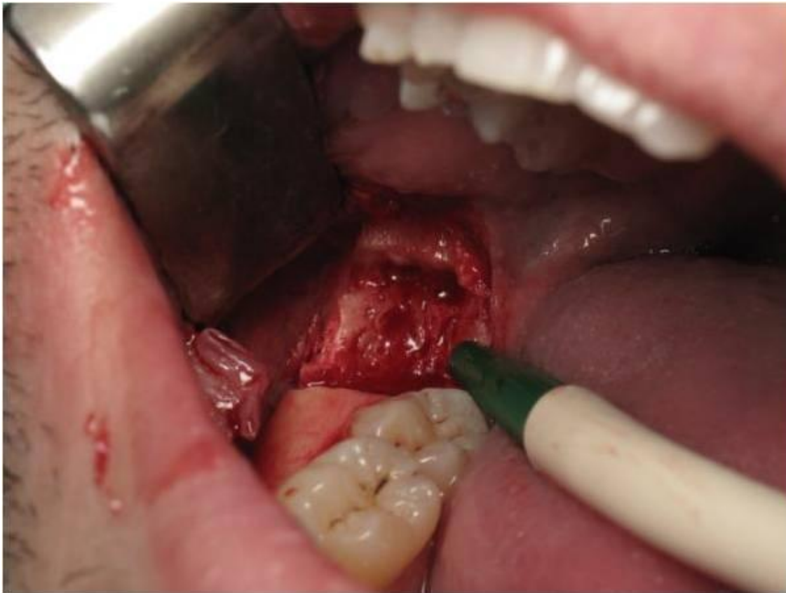
Slika 4. Uzimanje autolognog transplantata s ramusa mandibule.

Autogeni transplantati jesu transplantati koji se na istoj osobi prenose s jednog mjesta na drugo, a obuhvaćaju kortikalnu i spužvastu kost. Potiču cijeljenje kosti osteogenezom i/ili osteindukcijom, pa i osteokondukcijom, postupno se resorbiraju i zamjenjuju novom košću. Ova je vrsta transplantata „zlatni standard“ zbog apsolutne biokompatibilnosti i prisutnosti osteoprogenitornih stanica, to jest potencijalne teškoće histokompatibilnosti i prijenosa bolesti ne postoje. Autogeni se transplantati mogu uzeti s intraoralnih i ekstraoralnih mjesta. Intraoralni autogeni transplantati najčešće se uzimaju s mandibularne simfize, tubera maksile i ramusa mandibule (slika 4). Ekstraoralni autogeni transplantati uzimaju se s kriste ilijake, rebra i metafiza tibije (28).