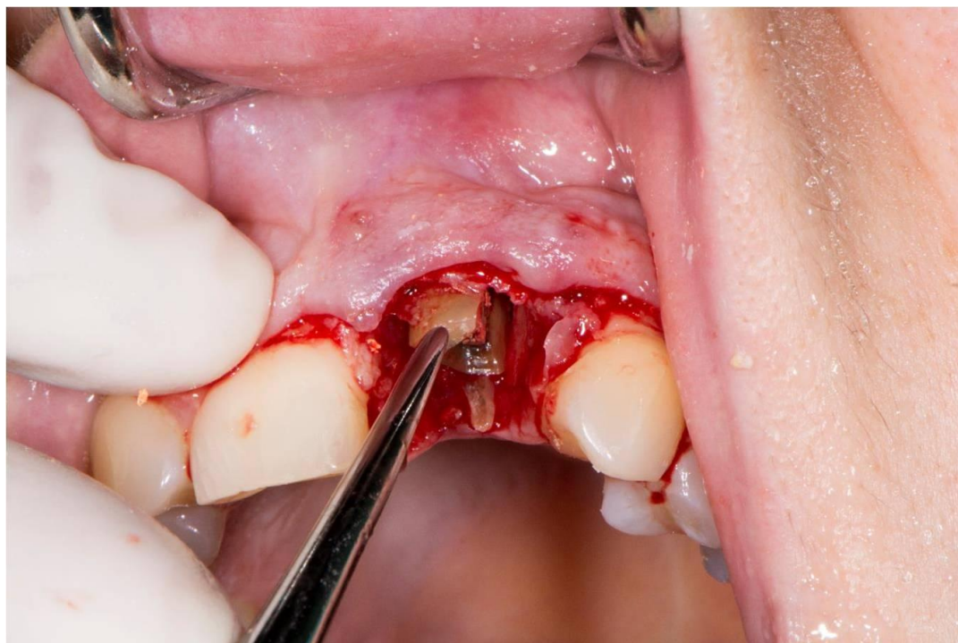
Slika 2. Atraumatska ekstrakcija zuba.