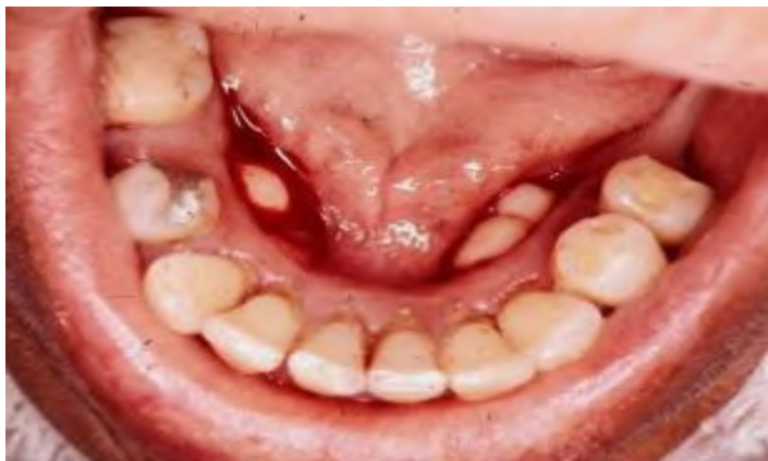
Slika 7. Prikaz koštanog izbočenja nakon odljuštenja sluznice.