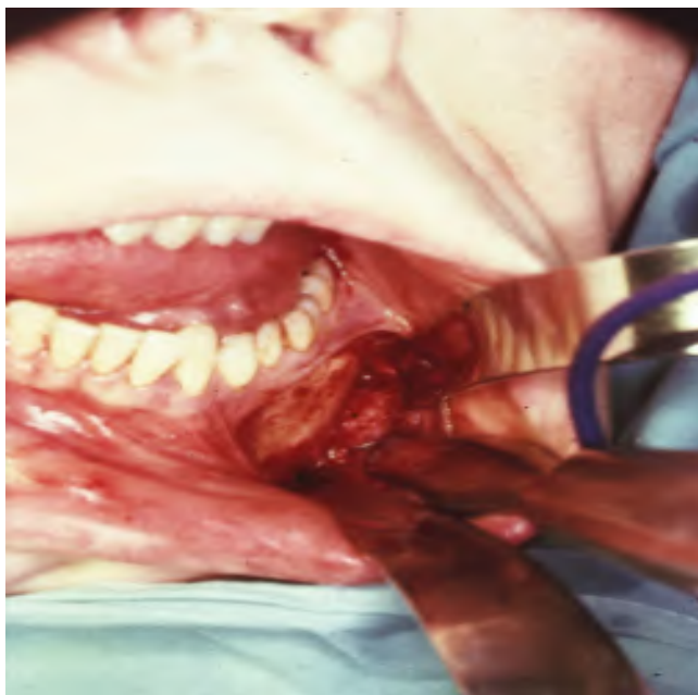
Slika 12. Intraoperativni prikaz koštane promjene.