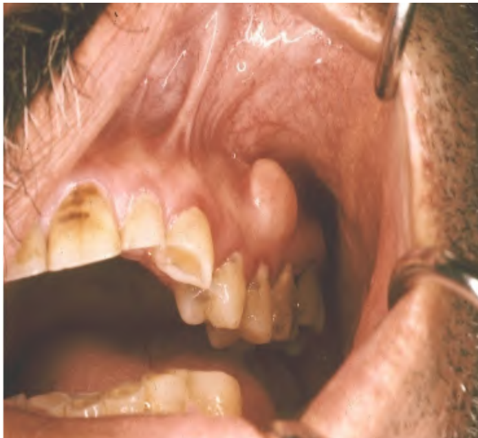
Slika 8. Periferni osteom sa širokom bazom. Preuzeto s dopuštenjem autora: Goran Knežević.

je promjena vezana uz zub (15). Dijagnoza se postavlja na temelju kliničkog, histološkog i rendgenskog nalaza. Histološkim nalazom isključuje se odontom, osteoblastom, fokalna cemento-osealna displazija te cemento-osealna displazija, a klinički treba biti zamijećen rast, ekspanzija i pomicanje zuba kako bi se postavila dijagnoza. Idiopatska osteoskleroza u tinejdžerskim godinama ima istu kliničku, radiološku i histološku manifestaciju kao i centralni osteom te ih nije moguće razlikovati u toj dobi. Moguće ih je razlikovati u zrelijim godinama kada idiopatska skleroza dosegne konačnu veličinu, a centralni osteom nastavlja rasti (15).