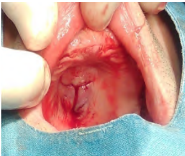
Slika 2. Rez u obliku slova Y.