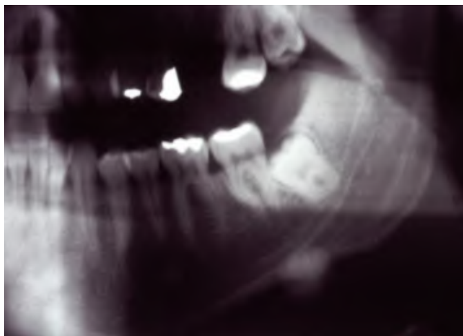
Slika 10. Dio ortopantomograma pacijenta s centralnim osteomom.