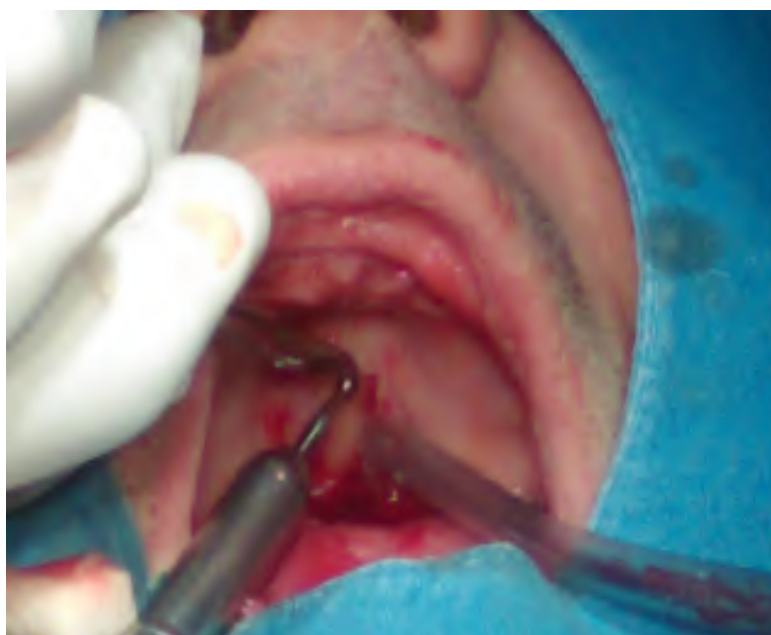
Slika 4. Ljuštenje promjene.