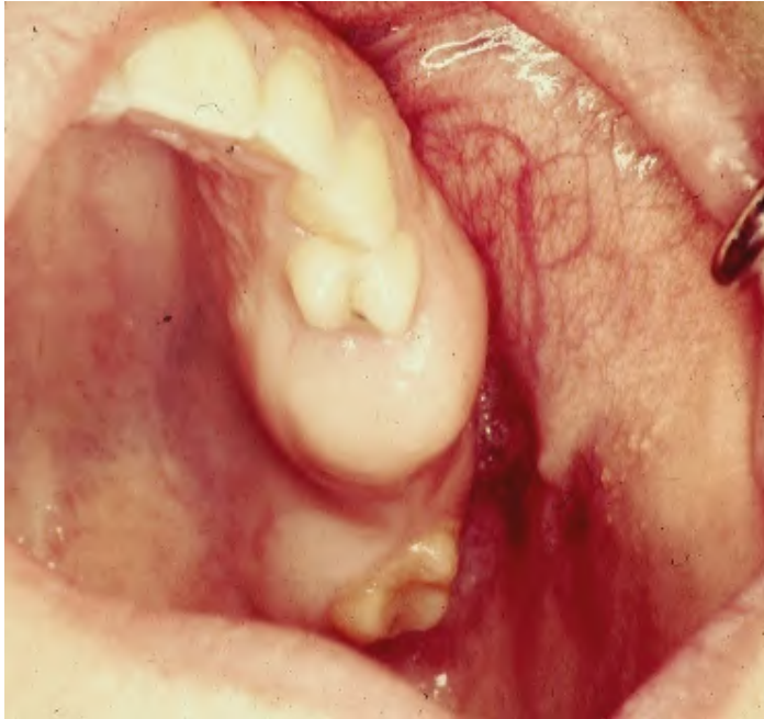
Slika 9. Centralni osteom.