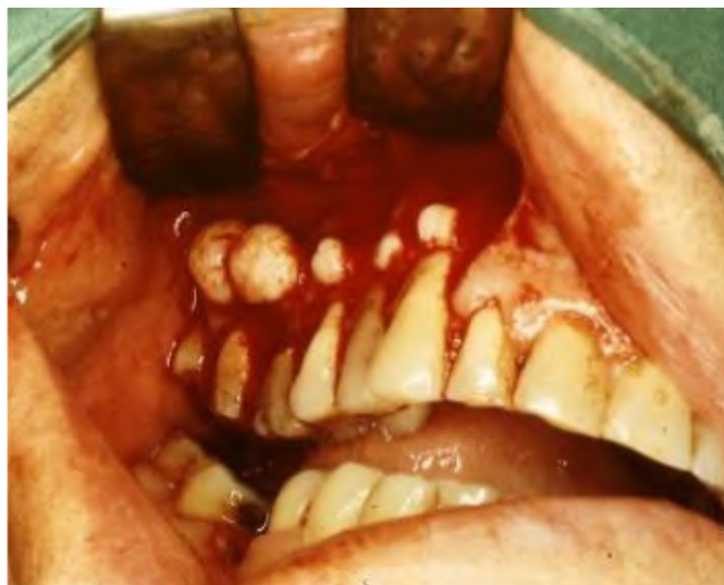
Slika 14. Intraoperativni prikaz multiplih osteoma.