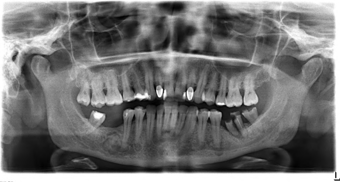
Slika 15. Fibrozna displazija.