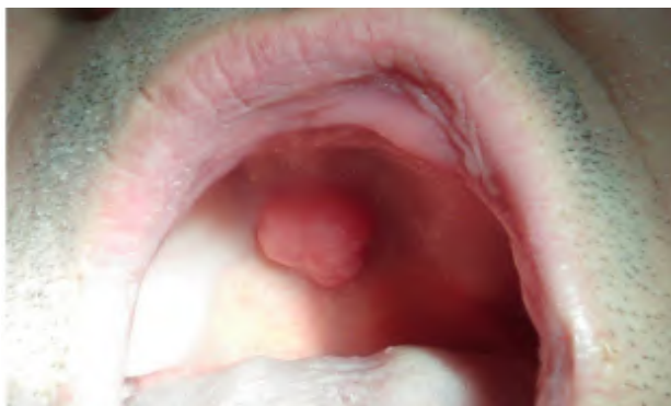
Slika 1. Klinički nalaz palatinalnog torusa.