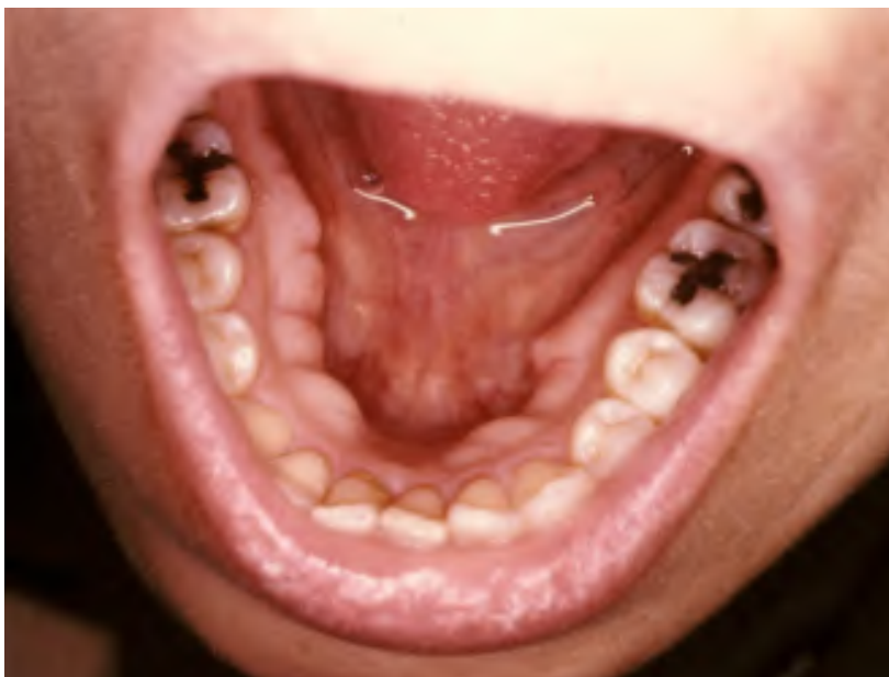
Slika 6. Klinički nalaz torusa mandibularisa. Preuzeto s dopuštenjem autora: Goran Knežević.

manje od 2 cm, od 2 do 4 mm, te iznad 4 mm ili manje od 3 mm, od 3 do 6 mm i veće od 6 mm (3).