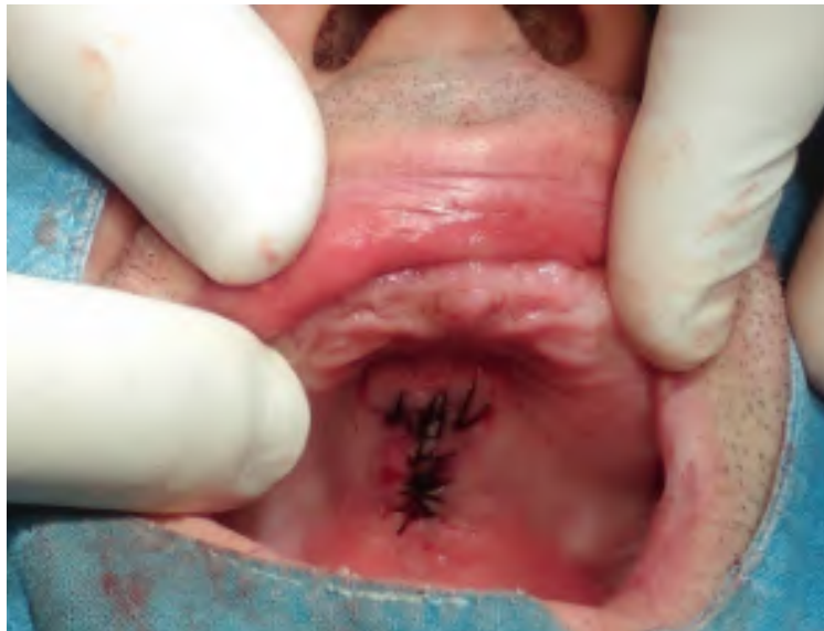
Slika 5. Sašivena rana.