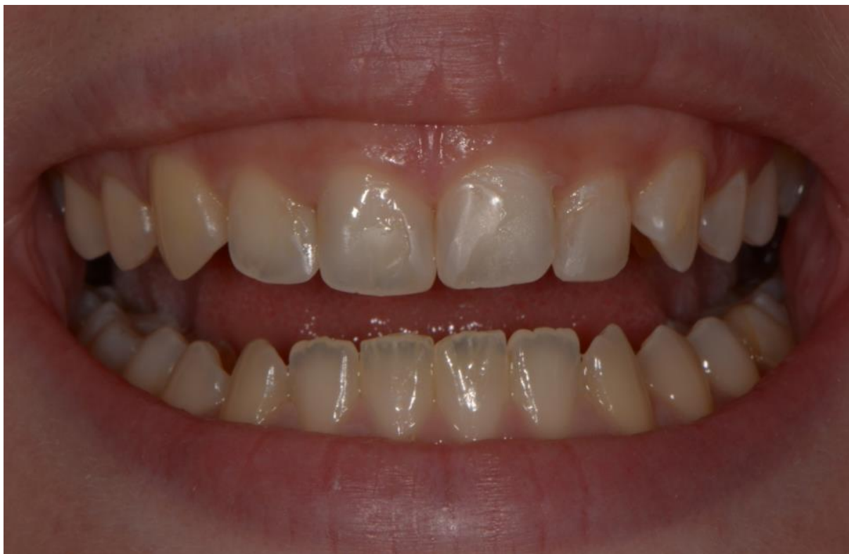
Slika 8. Izgled zuba pacijentice nakon terapije. Vidljiva je razlika u prozirnosti i boji opskrbljenih gornjih zuba naspram netretiranim donjim prednjim zubima.