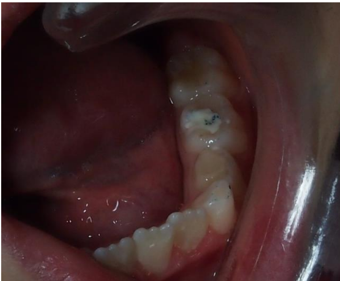
Slika 4. Kavitet mliječnog zuba nakon izrade ART ispuna.