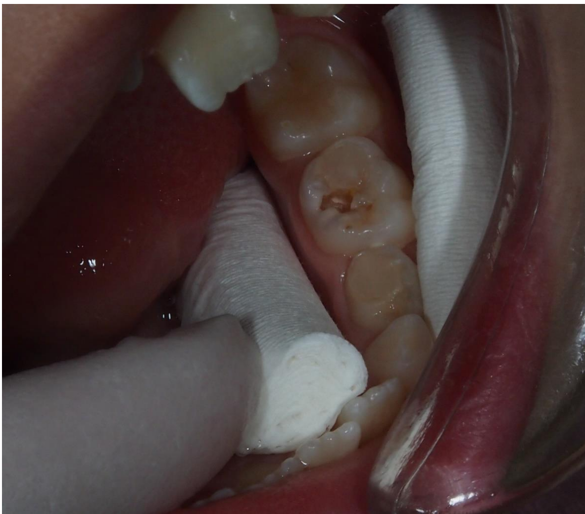
Slika 3. Kavitet mliječnog zuba nakon uklanjanja inficiranog dentina.