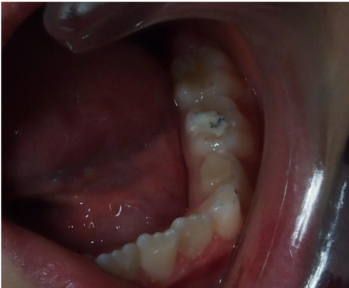
Slika 4. Kavitet mliječnog zuba nakon izrade ART ispuna.