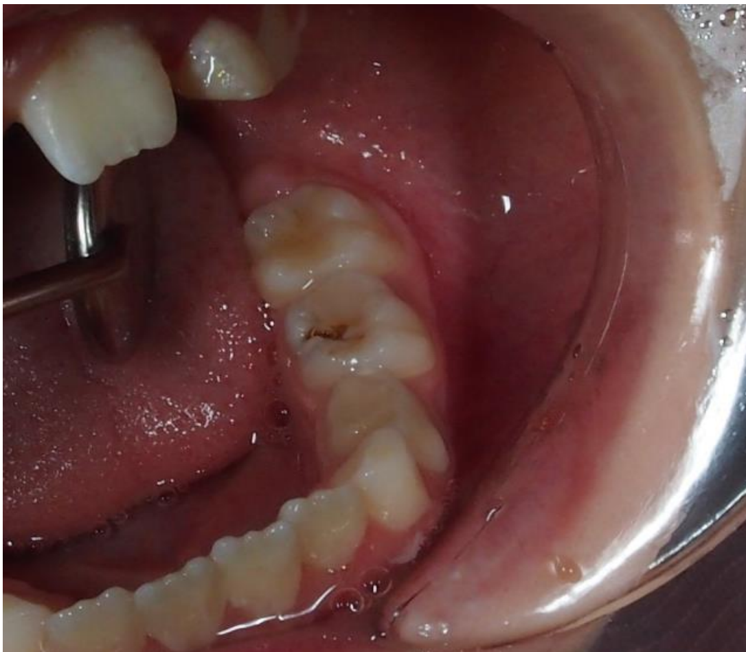
Slika 2. Kavitet zuba prije ART restauracije.