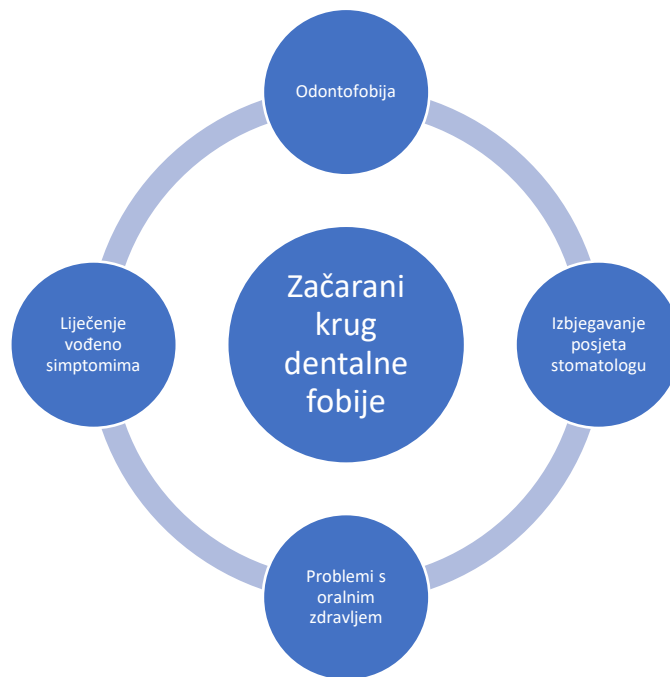
Slika 3. Začarani krug dentalne fobije. Preuzeto i prilagođeno iz (11).

Zanimljiv je i podatak da 11,6% ljudi koji nemaju strah od stomatologa u jednom trenutku upadnu u začarani krug zbog izbjegavanja posjeta stomatologu iz raznih razloga (cijena, nedostatak vremena, odsustvo interesa). Čak 70% ljudi koji su naveli visoki strah od stomatologa ne odlaže posjete stomatologu, što ih razlikuje od odontofobičnih pacijenata (11).