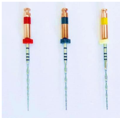
Slika 4. Reciproc instrumenti R25, R40, R50

Reciproc sistem stvara rotaciju od 150° u CCW smjeru pa 30° CW u drugom smjeru. Recipročni instrumenti posebno su oblikovani za upotrebu u recipročnom načinu rada. Razvijen je i prezentiran početkom 2011. godine (23). Sastoji se od tri instrumenta: R25 (crveni, 25/0,08), R40 (crni 40/0,06), R50 (žuti, 50/0,05) i pripadajućeg motora ( VDW Silver ili Gold Reciproc, VDW GmbH, Munich, Germany ) (Slika 4.). Poprečni presjek instrumenta je u obliku slova S omogućavajući očuvati primarni izgled kanala i završetak instrumentacije korištenjem samo jednog instrumenta, tzv. single tehnika. Sadrži pripadajuće paper points (papirnate štapiće za sušenje kanala) i gutaperka štapiće za single cone tehniku ili termoplastičnu tehniku punjenja korijenskog kanala. Reciproc sistem je uspješan i u reviziji starog punjenja iako se to ne preporuča zbog mogućih pogrešaka. Ova vrsta instrumenata namijenjena je jednokratnoj uporabi iako zbog svojih konstrukcijskih osobina i kvalitete materijala mogu podnijeti veliki broj instrumentacija.