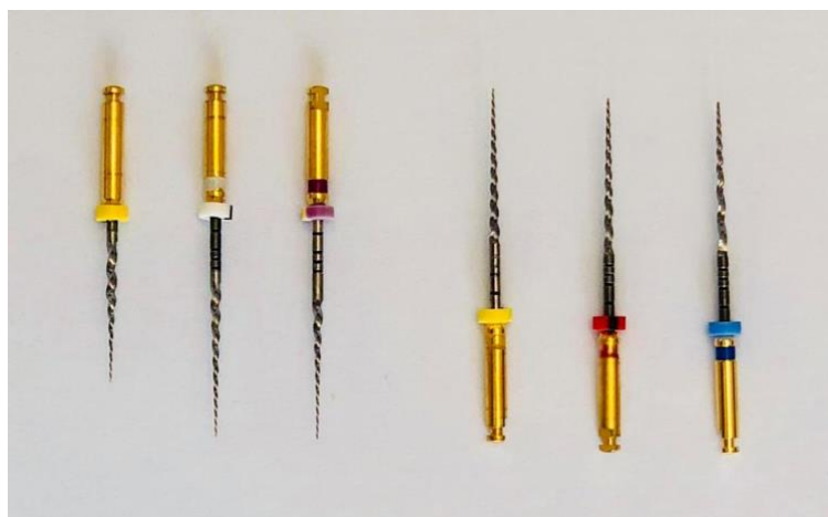
Slika 3. Protaper Universal instrumenti – SX, S1, S2. F1, F2 i F3