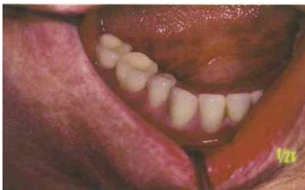
Slika 9. Proširene udubine na donjim molarima karakteristika su lingvalizirane okluzije (preuzeto iz 13)

Lingvaliziranom okluzijom postizemo uspostavljanje slobodnih dodirnih kretnji mandibule uz zadovoljavanje zahtjeva funkcije i estetike. Upotrebljavaju se gornji zubi s prominentnim palatinalnim kvržicama koje okludiraju s proširenim jamicama na donjim lateralnim zubima (Slika 9).