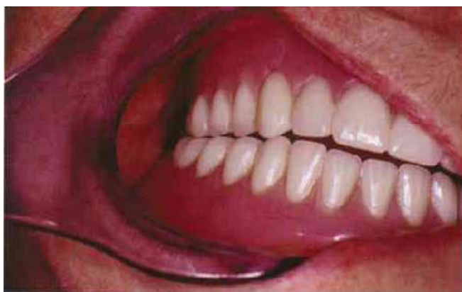
Slika 8. Kretanja mandibule u desnu stranu, zubi na radnoj strani klize jedan preko drugog (preuzeto iz 13)

Bilateralnu okluzijsku ravnotežu karakterizira postojanje harmoničnog odnosa gornjih i donjih zuba u svim centričnim i izvancentričnim položajima mandibule. Postoje stabilni, simultani dodiri gornjih i donjih zuba u maksimalnoj interkuspidaciji. Prilikom lateralnih kretnji zubi bi trebali ravnomjerno kliziti jedan preko drugog na radnoj strani. Kontakti na strani ravnoteže moraju postojati i ne smiju ometati klizne dodire na radnoj strani (Slika 8).