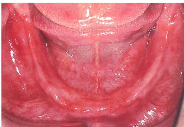
Slika 4. Ležište donje proteze (preuzeto iz 17)

Gubitak zuba neizbježno dovodi do resorpcije alveolarne kosti, no opseg resorpcije varira od osobe do osobe. Resorpcija je opsežnija u donjoj čeljusti nego u gornjoj zbog čega je teže izraditi dobru donju potpunu protezu i postići zadovoljstvo nošenja iste. Alveolarni greben može biti ravnomjerno i neravnomjerno resorbiran (može imati udubljenja i izbočenja koja mogu smetati stabilnosti i namještanju proteze na greben), a najteža je situacija kada je ekstremno atrofiran, odnosno postoji negativni alveolarni greben. Izgled i oblik grebena važni su nam za mogućnosti postave zuba i odabir oblika i veličine umjetnih zuba (6, 1).