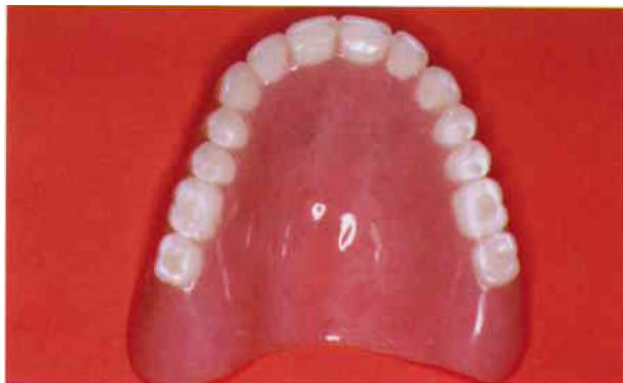
Slika 2. Gornja potpuna proteza (preuzeto iz 13)

funkcije stomatognatog sustava – mastikaciju, fonaciju, glutinaciju i estetiku (4) (Slika 2).