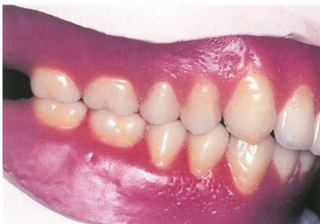
Slika 7. Završena postava svih zubi u gornjoj i donjoj potpunoj protezi (preuzeto iz 17)

Nakon što smo pravilno postavili prvi donji molar, slijedi postava drugog donjeg premolara, zatim i prvog, a na kraju postavljamo drugi donji molar (Slika 7). Drugi donji premolar postavlja se tako da mu je uzdužna osovina okomita na okluzalnu ravninu. Bukalna i lingvalna kvržica se postavljaju 2 mm iznad okluzalne ravnine. Zub okludira s marginalnim bridovima gornjeg prvog i drugog premolara.