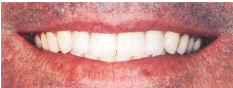
Slika 6. Osmijeh s protezama. Bukalni koridor je očuvan.

Što se tiče estetike postave lateralnih zuba, moramo poštivati bukalni koridor. Bukalni koridor je tamni prostor koji se formira između kutova usta i bukalnih ploha maksilarnih zuba tijekom smijanja (Slika 6). Važno ga je sačuvati pravilnim formiranjem zubnog luka jer daje dojam dubine, ali ne smije ostati prevelik jer ozbiljno narušava estetiku (16).