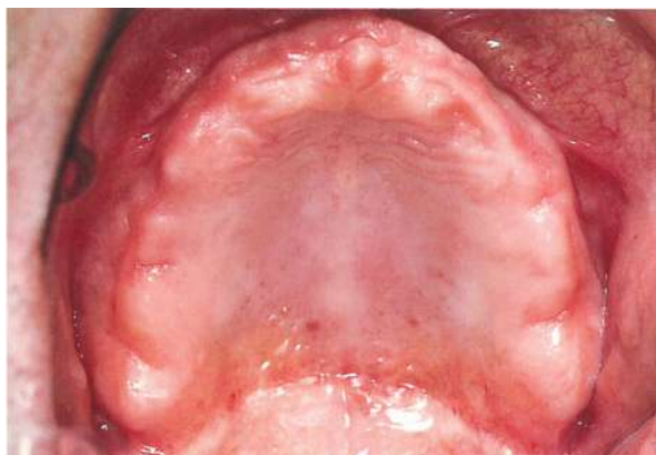
Slika 3. Ležište gornje proteze (preuzeto iz 17)

Općenito se smatra da potpuna proteza, kako bi se uspješno nosila, mora zadovoljiti zahtjeve potpore, retencije i stabilizacije (6, 7). Potporu pruža ležište proteze koje čine kost i meko tkivo koje ju pokriva. Ležište baze gornje proteze čine alveolarni greben, tvrdo nepce, tuber maksile i krista zigomatiko-maksilaris, iza koje se u bezubim ustima nalazi paratubarni prostor koji je važan za retenciju totalne proteze (Slika 3). Ležište donje proteze čine alveolarni greben, milohioidni greben, linea oblikva eksterna, trigonum retromolare i fovea retromilohioidea (Slika 4) (4, 6, 7).