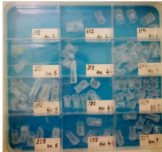
Slika 2. Različite veličine celuloidnih kapica