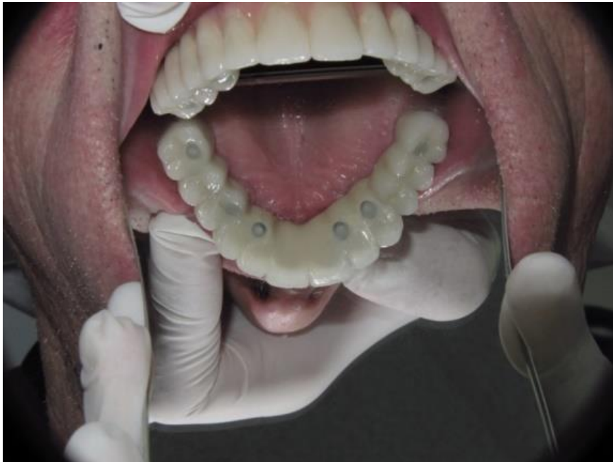
Slika 9. Zatvoreni otvori (rupe) za vijke (teflonska traka i tekući kompozit) na fiksnom protetskom radu nošenom dentalnim implantatima.