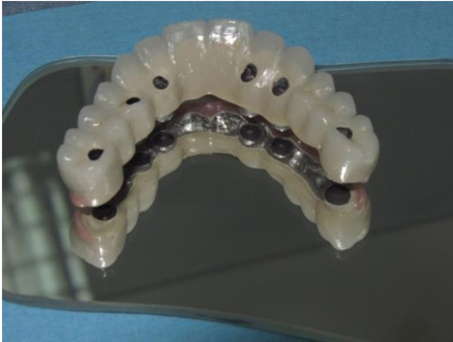
Slika 8. Izgled definitivnog fiksnog protetskoga rada koji se fiksira vijcima.