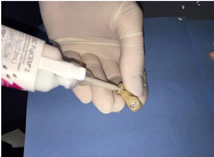
Slika 3. Punjenje fiksnog protetskog rada trajnim cementom.