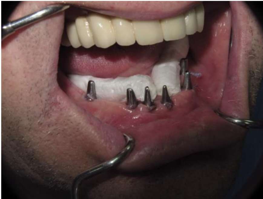
Slika 2. Priprema individualiziranih nadogradnji za cementiranje fiksnog protetskog rada (suho radno polje)

Slika 2. prikazuje individualizirane titanske nadogradnje fiksirane u dentalnim implantatima. Nakon provedenog čišćenja i dezinfekcije nadogradnje te unutrašnjim površinama fiksnog protetskog rada, slijedi aplikacija trajnog cementa (Slika 3.). Kako bi se što bolje očistio trajni ili privremeni cement nakon cementiranja fiksnog implanto-protetskog rada u sulkus oko nadogradnji mogu se postaviti končići (s adekvatnim instrumentom).