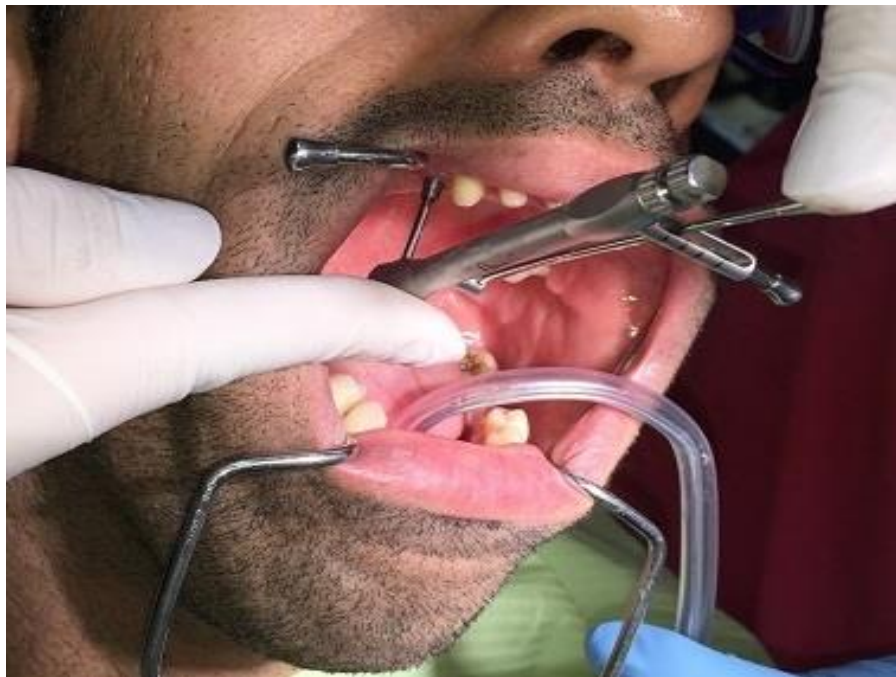
Slika 6. Upotreba protetskog ključa i moment ključa za fiksiranje protetskog rada ili nadogradnje u implantat.

Valja napomenuti da se gotov fiksni protetski rad može izravno fiksirati vijkom u implantat ili da između implantata i fiksnog protetskog rada postoji nadogradnja (npr. „multiunit“ nadogradnja kod all-on-4 sustava) koja se također vijkom fiksira u implantat, a gotov protetski rad pak vijkom u tu nadogradnju.