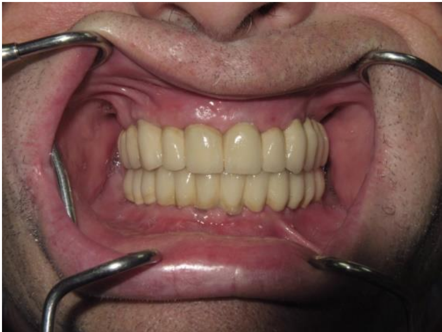
Slika 5. Završni izgled fiksnog implanto-protetskog rada nakon cementiranja.