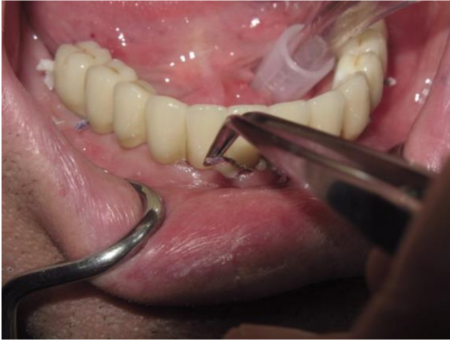
Slika 4. Skidanje končića nakon trajnog cementiranja staklenoionomernim cementom.