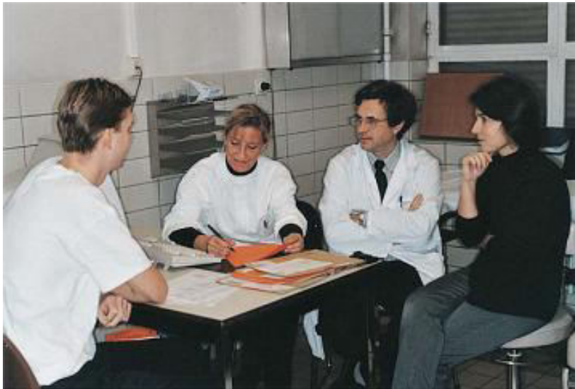
Slika 1. Stručni tim sluša pacijenta (18).