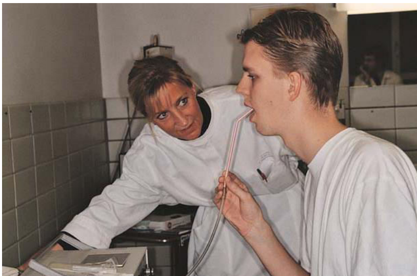
Slika 4. Uzimanje orofaringealnog zraka za elektronsko mjerenje hlapljivih komponenti (18).