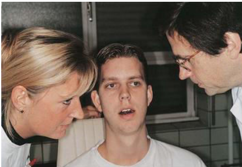
Slika 2. Određivanje izdahnutog zraka i uspoređivanje nalaza (18).