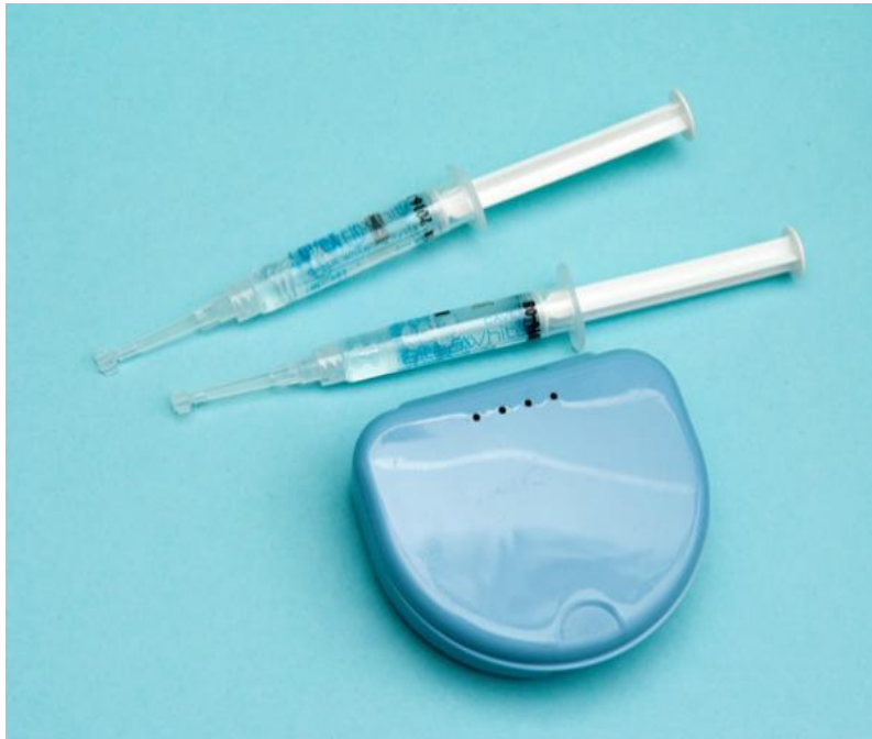
Slika 6. Individualna uduga za izbjeljivanje kod kuće.