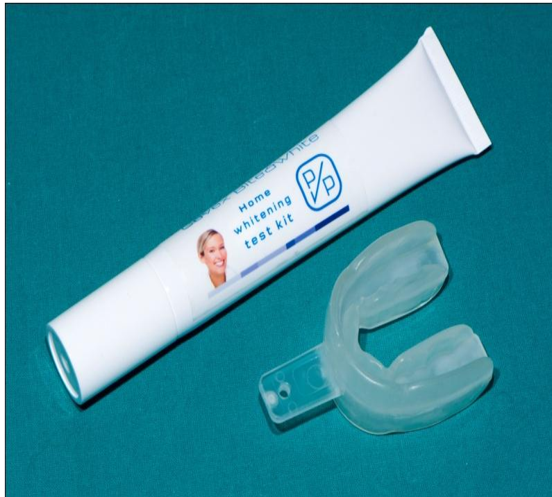
Slika 7. Over-the-counter set za izbjeljivanje (tvornički izrađena udlaga).