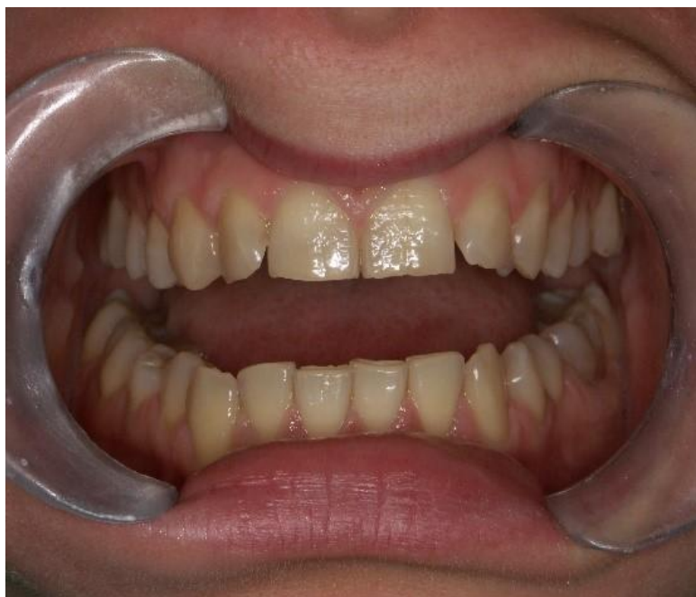
Slika 3. Opsežan gubitak cakline.