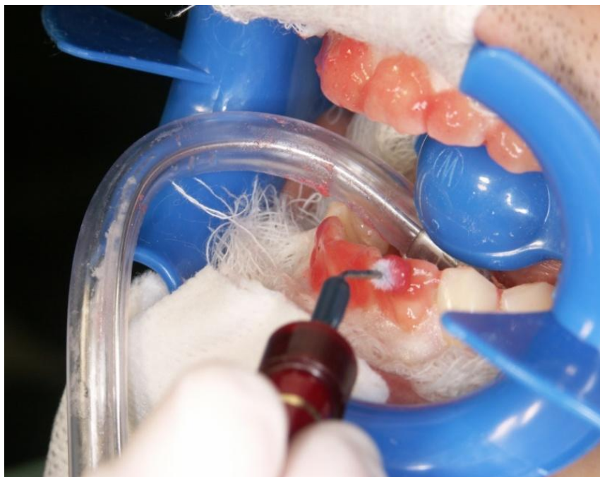
Slika 4. Profesionalno izbjeljivanje u ordinaciji ( dentist administred in office bleaching, power bleaching ).