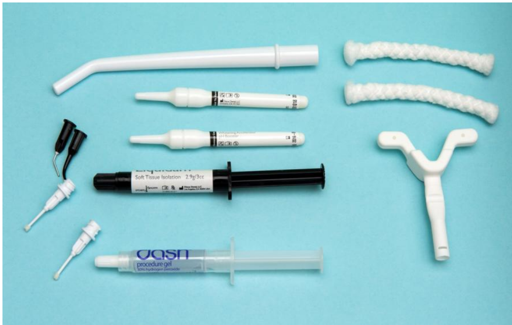
Slika 1. Preparat 30 %-tnog vodikovog peroksida Dash .

Vodikov peroksid snažan je oksidans, dostupan u različitim koncentracijama, ali najčešće u stabiliziranim 30 – 35 %-tnim otopinama (Slika 1). Te visoko koncentrirane otopine moraju se pažljivo primjenjivati jer su nestabilne, otpuštaju kisik brzo i mogu eksplodirati ako nisu pothlađene i pohranjene u tamnom spremniku. U primjeni, vodikov peroksid razgrađuje se na vodu i kisik. Tijekom aplikacije gel stvara interakciju s vlažnom strukturom zuba, a oslobođene molekule kisika odgovorne su za bijeljenje zuba. Za razliku od karbamid peroksida, vodikov peroksid temelji se na bazi vode. Zato se prilikom upotrebe vodikova peroksida smanjuje mogućnost dehidracije (1).