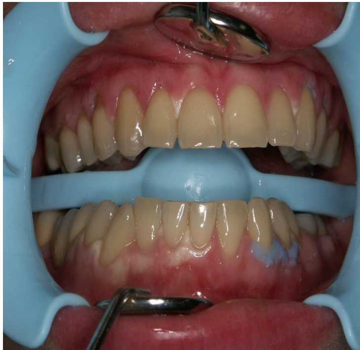
Slika 9. Opekotina i ulceracija cerviksne gingive iznad zubi 11, 12, 41, 42.