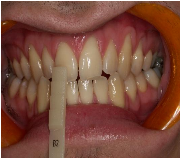
Slika 2. Preosjetljivost zbog eksponirane površine korijena.