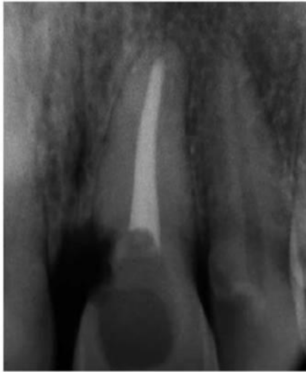
Slika 13. Vanjska resorpcija korijena.

i dobro zabrtvljeni ulaz u korijenski kanal u razini caklinsko-cementnog spojišta kako ne bi došlo do resorpcije zubnih vratova. Agresivne kemikalije i postupke trebalo bi izbjegavati jer su istraživanja pokazala da 30 %-tni vodikov peroksid nije neophodan za postizanje prihvatljivog ishoda liječenja (7).