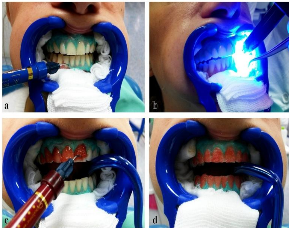
Slika 5. Ispravno postavljena zaštita mekih tkiva.