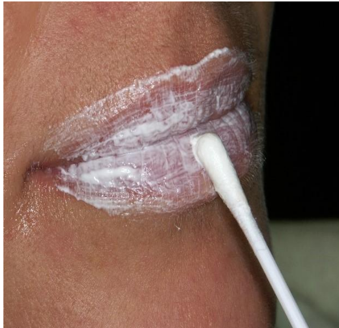
Slika 10. Slika orobaze za zaštitu usnica.