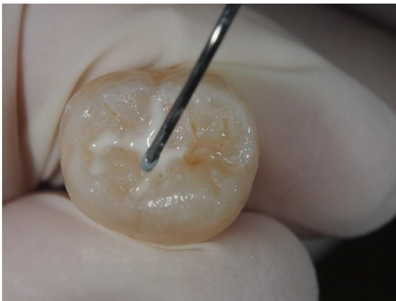
Slika 6. Popunjavanje fisura s drugim slojem Constic-a