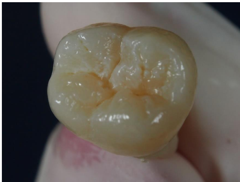
Slika 4. Intaktna očišćena okluzalna ploha molara