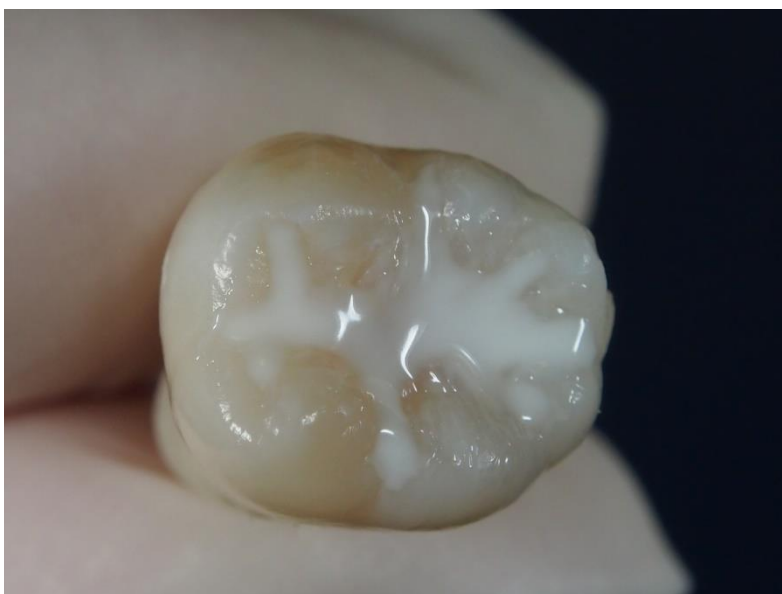
Slika 7. Završni izgled pečata nakon postupka polimerizacije