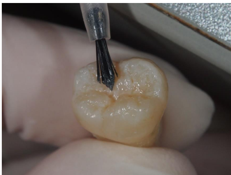
Slika 5. Postavljanje prvog tankog sloja Constic-a