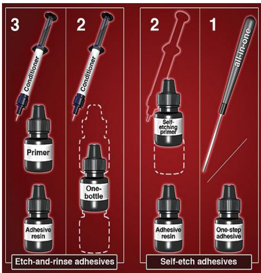
Slika 2. Klasifikacija adhezijskih sustava. Preuzeto: (18)