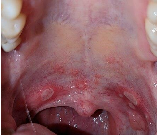
Slika 2. Klinička slika herpangine.

Dijagnosticira se na osnovi anamneze i kliničke slike, a za potvrdu se mogu raditi kultura virusa, PCR i ELISA (engl. enzyme-linked immunosorbent assay ). Diferencijalno dijagnostički u obzir dolazi primarni herpetični gingivostomatitis (lezije se mogu vidjeti po cijeloj oralnoj sluznici), streptokokna angina (različite morfološke promjene, javlja se u bilo koje doba godine), Bednarove afte (iako morfološki slične, ove se lezije pojavljuju na granici tvrdog i mekog nepca te su simetrično posložene) (1).