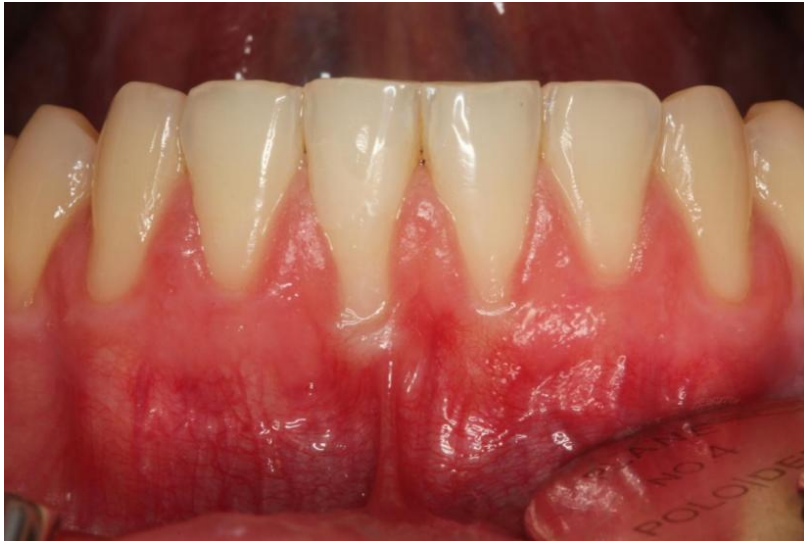
Slika 1. Prikaz početnoga stanja, recesije zuba s nedovoljnom visinom keratinizirane gingive.