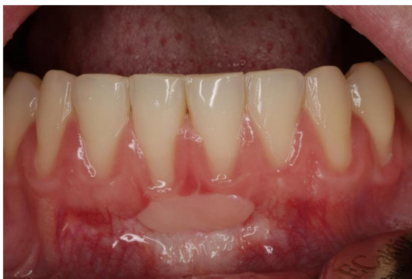
Slika 4. Prikaz stanja 6 mjeseci nakon operacije.