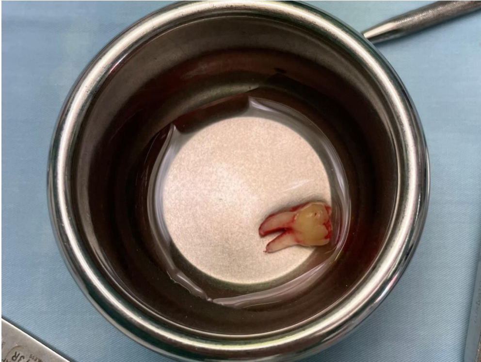
Slika 5. Zub donor u fiziološkoj otopini