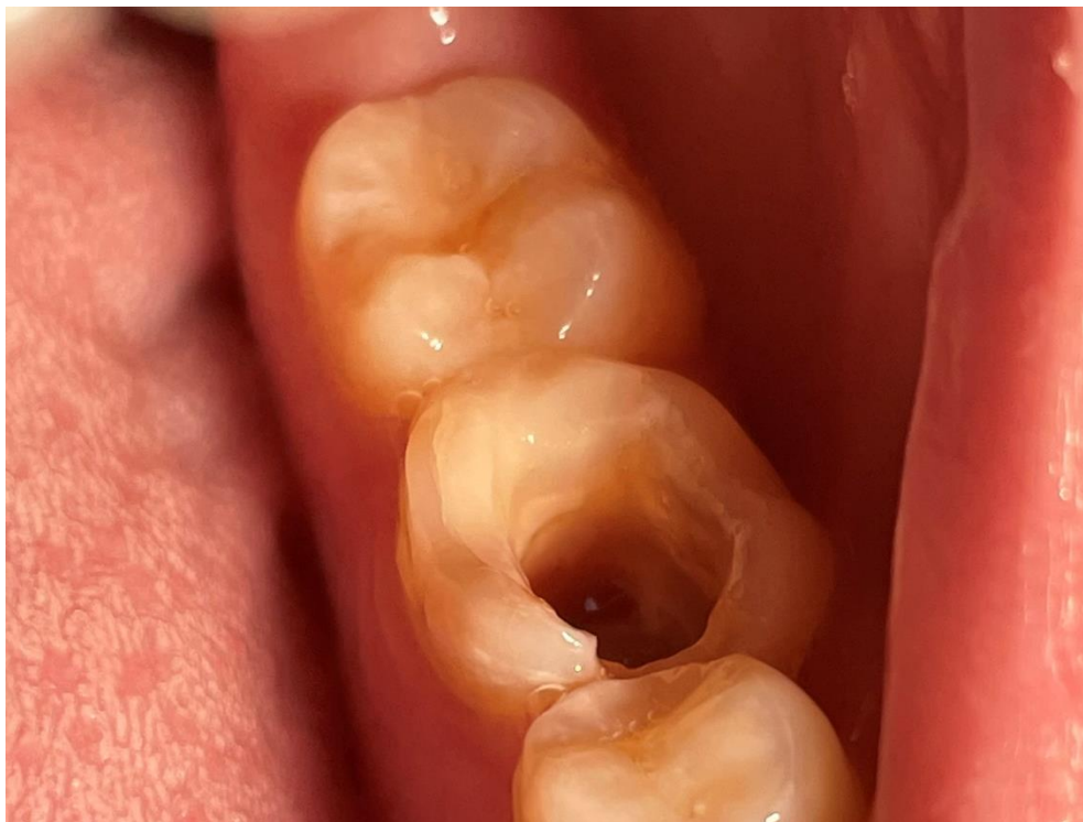
Slika 1. Klinički prikaz molarne regije dolje lijevo

Pacijentica u dobi od 19 godina upućena je na Zavod za oralnu kirurgiju sa Zavoda za endodonciju i restaurativnu dentalnu medicinu Stomatološkog fakulteta Sveučilišta u Zagrebu zbog nemogućnosti endodontskog liječenja donjeg lijevog prvog molara. Medicinska je anamneza pacijentice bez osobitosti. Kliničkim pregledom vidljiv je donji lijevi prvi molar s trepanacijskim otvorom koji se nije mogao zatvoriti zbog supuracije i bolova te nedostatak donjeg lijevog trećeg molara u usnoj šupljini. Na ortopantomogramu je vidljiv ekstenzivni periapikalni proces u području donjeg lijevog prvog molara te je zato indiciran za ekstrakciju. Također je vidljiv neizniknuti donji lijevi treći molar pravilnog morfološkog oblika sličnog prvom molaru, s otvorenim apeksima na oba korijena, što ga čini pogodnim za autotransplantaciju na mjesto prvog molara.