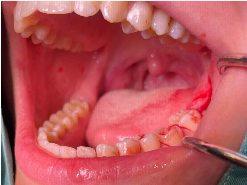
Slika 6. Zub donor postavljen u primateljsku alveolu