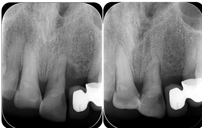
Slika 3. Dvodimenzionalna snimka intrakoštanog defekta neposredno prije i 6 mjeseci nakon provedenog liječenja.

Razvoj trodimenzionalnih snimki nadvladava ograničenja konvencionalnih intraoralnih radiograma, posebno kod uznapredovalih i kompleksnih slučajeva, dajući detaljne informacije o stupnju gubitka kosti, zahvaćenim furkacijama, vrsti resorpcije te njezinim dimenzijama (13). Međutim, dvodimenzionalne snimke još su uvijek zlatni standard u uzimanju parodontološkog statusa (13) (Slika 3.).