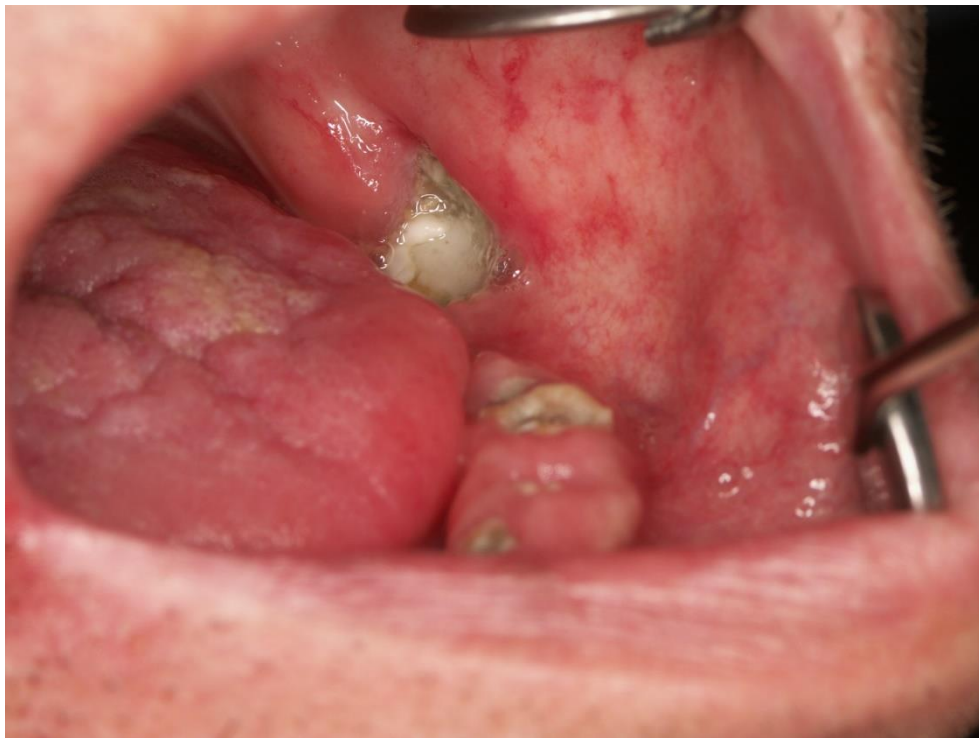
Slika 2. Osteoradionekroza – eksponirana kost u usnoj šupljini.

Dijagnoza ORN se postavlja kliničkim pregledom. U ustima se vidi područje eksponirane kosti koje perzistira najmanje tri mjeseca u pacijenta koji su bili zračeni u području glave i vrata (Slika 2). ORN se češće javlja u mandibuli koja ima deblji kortikalis i slabije je prokrvljena od maksile. Pacijenti se mogu žaliti na bol, zadah iz usta, poremećaj okusa i slično. Simptomi nemoraju biti prisutni, pogotovo ne u ranim stadijima bolesti (22-24). Histološki nalaz ORN je hipovaskularizirano tkivo sa smanjenim brojem osteoblasta, osteoklasta, osteocita i drugih stanica u tom predjelu (Slika 3) (19,20). Površina rane može biti inficirana mikrobima iz usne šupljine međutim infekcije nema u dubljim slojevima rane (7).