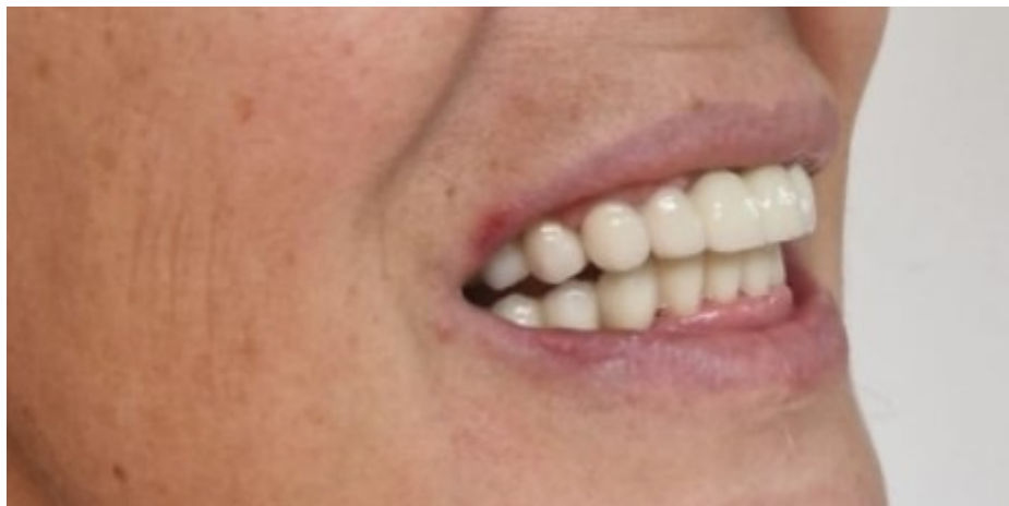
Slika 8. Završen protetski rad iz profila.