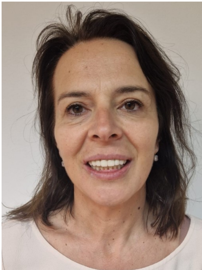
Slika 10. Završni izgled pacijentice.