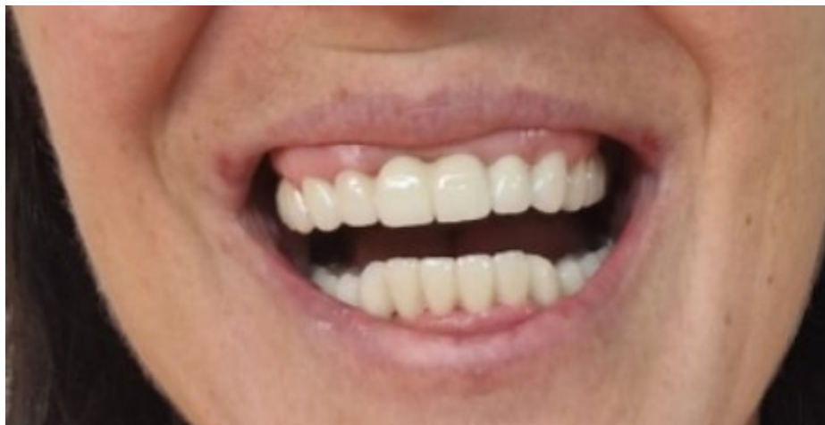
Slika 7. Završen protetski rad od cirkonij-oksidge keramike.