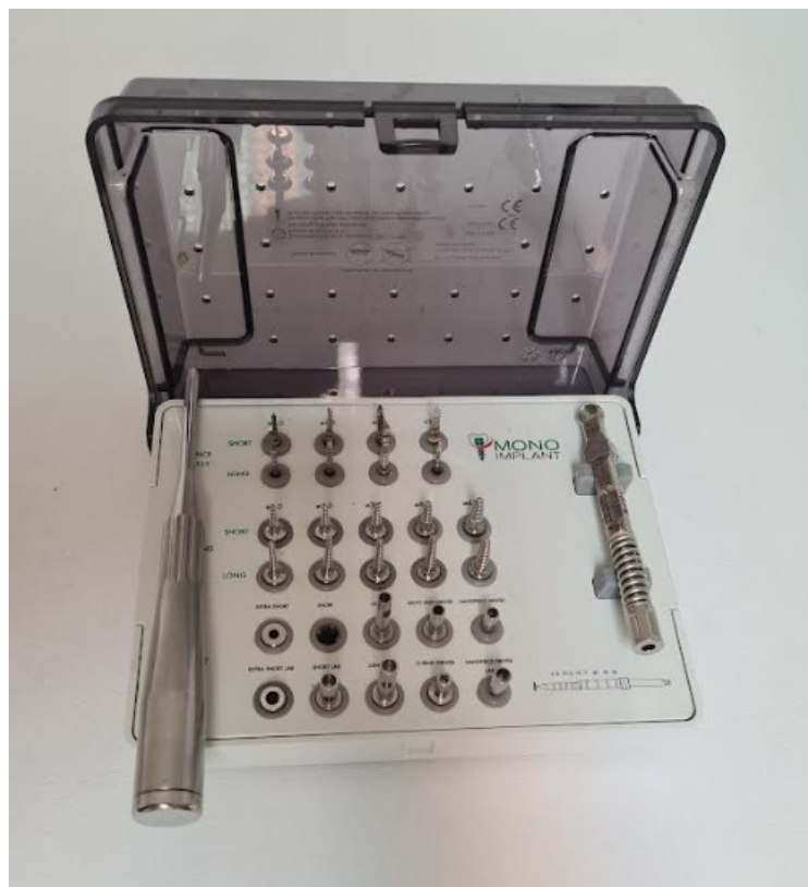
Slika 3. Instrumentarij za kiruršku ugradnju jednodijelnih implantata.