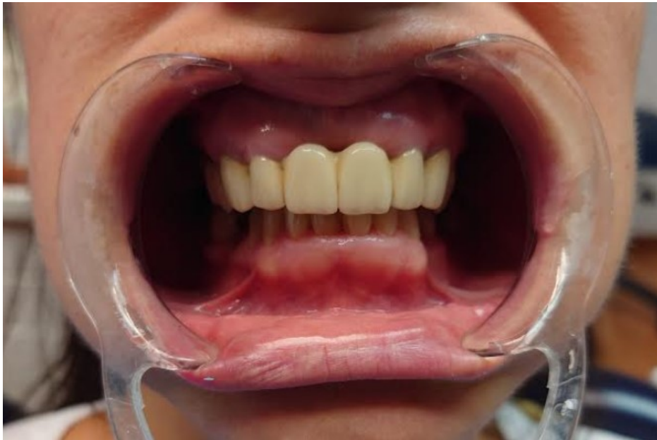
Slika 1. Početni izgled pacijentice.

Time je nedostatak prednjih zuba riješen u tri posjeta sa zadovoljavajućim estetskim rezultatom na jednodijelnim implantatima.