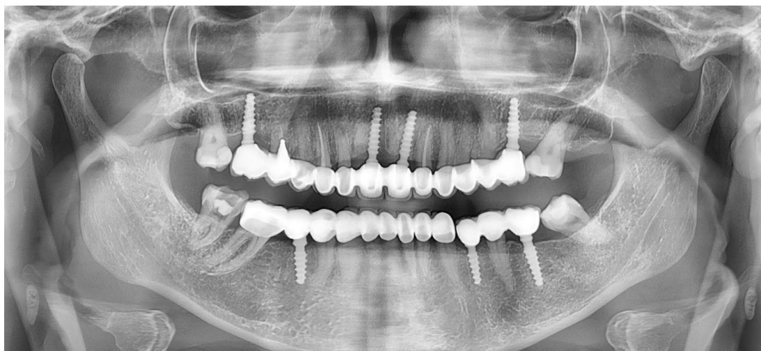
Slika 11. Kontrolni ortopantomogram nakon godinu dana.