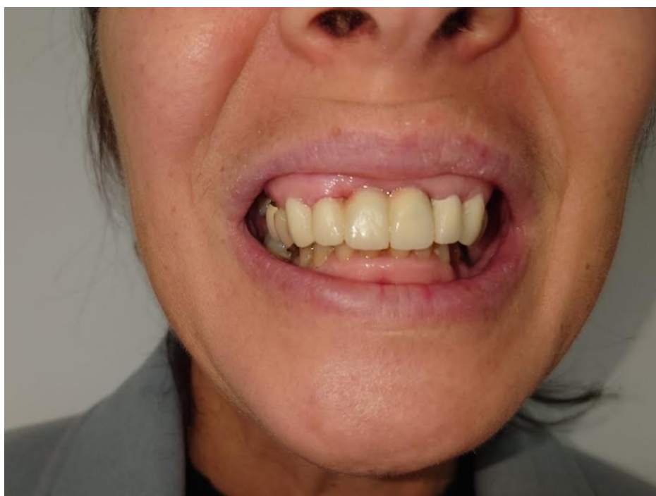
Slika 5. Cementiran privremeni protetski rad u gornjoj čeljusti.