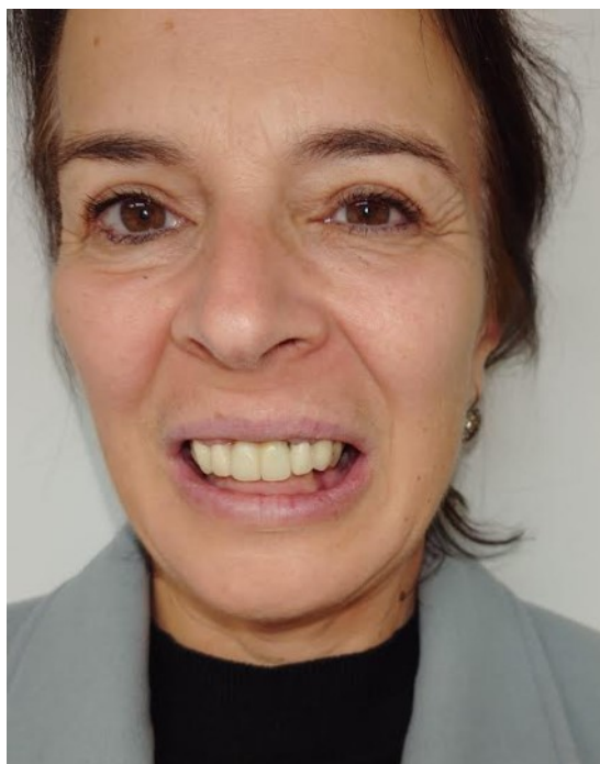
Slika 6. Cementiran privremeni protetski rad u gornjoj čeljusti.