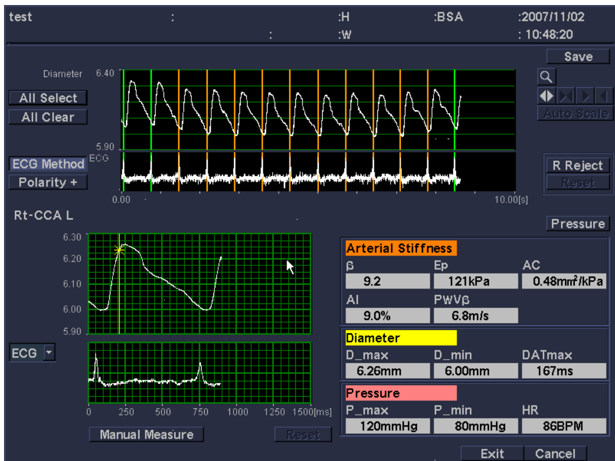
Slika 2. Prikaz programske aplikacije eTracking .

Mjerenja IMT vrijednosti su izvedena na distalnom zidu ACC prema standardiziranim smjernicama (91). Ultrazvučne preglede je provodio isti iskusni istraživač koji nije znao kojoj skupini pripada pojedini ispitanik. Pregled je uvijek počeo identifikacijom ACC. Prikazom ACC u B-modu analizirana je stijenka, intima, te eventualna prisutnost plakova. U hemodinamičkom spektru analizirane su sistoličke i dijastoličke brzine te je procijenjen cirkulacijski otpor. Parametri za opisivanje krutosti arterije dobiveni su jednostavnim pokretanjem programske aplikacije ( Echo Tracking, eTracking ) nakon ultrazvučnog pregleda krvnih žila. Pokretanjem programa dobivena je krivulja iz koje je odabrano 5 reprezentativnih ciklusa te je program na grafičkom sučelju izračunao vrijednosti opisane u nastavku (Slika 2).