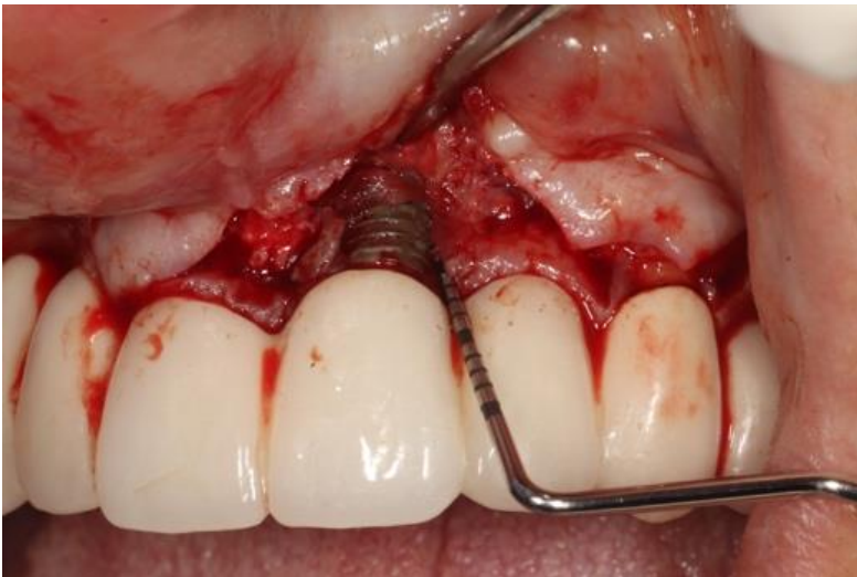
Slika 7. eksponirana površina implantata nakon odizanja režnja, sondiranje intrakoštanog defekta iznosi 6 mm.

Nakon odizanja režnja (Slika 7.) i uklanjanja granulacijskog tkiva (Slika 8.), površina implantata je mehanički i kemijski dekontaminirana (Slika 9.).