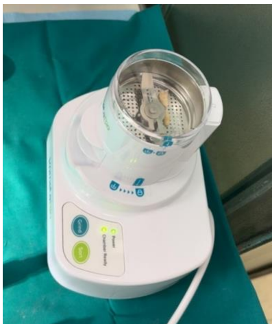
Slika 2. prikazuje uređaj spreman za mljevenje zuba.

Nakon uključivanja uređaja, sterilna komorica se montira na uređaj okrećući je u smjeru suprotnom od kazaljke na satu dok se strelica na komorici i ikona lokota uređaja ne poklope i upali zelena lampica „Chamber Ready“ (Slika 2.).