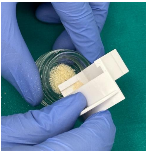
Slika 3. prikazuje miješanje čestica dentinskog grafta veće i manje frakcije.

Na prednjoj se strani komorice nalaze dva pretinca sa česticama usitnjenog zuba. U gornjoj ladici su čestice veličina 300-1200 \mu\text{m} , a u donjoj ladici manje od 300 \mu\text{m} . Čestice se premještaju u sterilnu posudicu odvojeno ili se miješaju zajedno (Slika 3.).