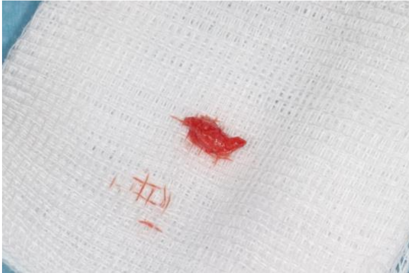
Slika 8. prikazuje uklonjeno granulacijsko upalno tkivo.