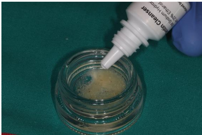
Slika 4. prikazuje čestice grafta u procesu čišćenja od organskih tvari.

Količina materijala dobivenog usitnjavanjem zuba je dvostruko veća u odnosu na izvorni volumen. Tako pripremljeni dentin može se koristiti odmah za augmentaciju ili sušenjem suhom sterilizacijom pet minuta na 140 stupnjeva pohraniti za kasniju upotrebu (28).