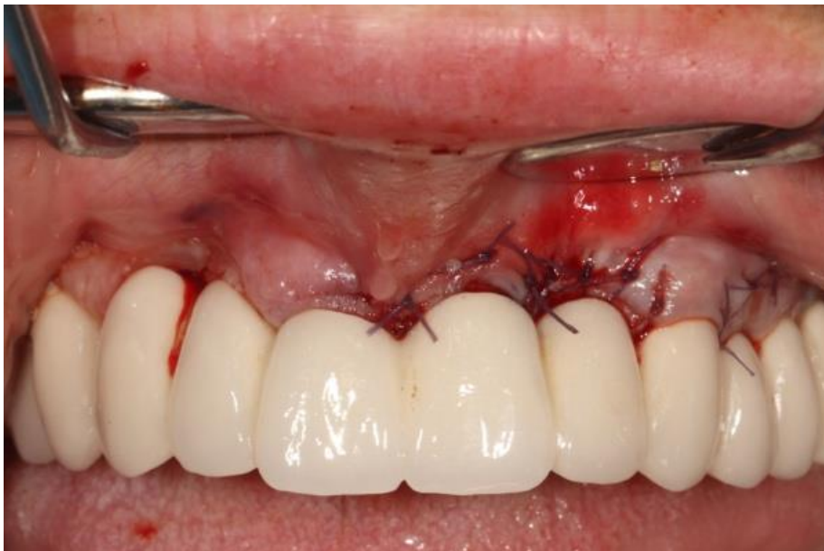
Slika 11. Šivanje režnja preko augmentiranog područja.

Rezultati regenerativnog liječenja periimplantitisa su praćeni u 18-o mjesecom periodu pokazujući fiziološke dubine sondiranja (2 mm), zdravo meko tkivo oko implantata i vertikalni dobitak kosti 3-5 mm. Gotovo svi prethodno eksponirani navoji implantata su prekriveni novostvorenom kosti, a razlika čestica grafta i okolne autologne kosti se ne uočava.