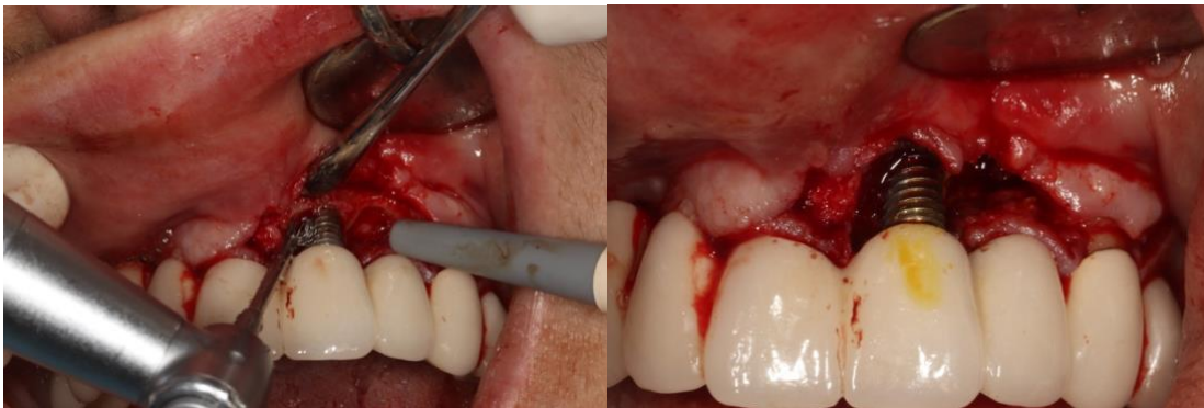
Slika 9. Čišćenje površine implantata titanskom četkicom i 3%-tnom otopinom vodikovog peroksida te otopinom joda.

Mineralizirani dentinski graft je u jednakom omjeru pomiješan s mineraliziranom spužvastom kosti (alograft) i hidratiziran fiziološkom otopinom. Tako pripremljen graft je postavljen oko implantata do razine okolne kosti (Slika 10.). Materijal je prekriven membranom i režanj sašiven u prvobitni položaj kako bi fiksirao koštani graft (Slika 11.).