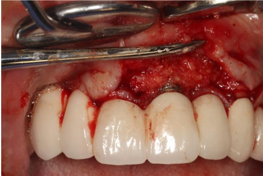
Slika 10. Augmentirano područje koštanog defekta česticama mineraliziranog dentinskog grafta.