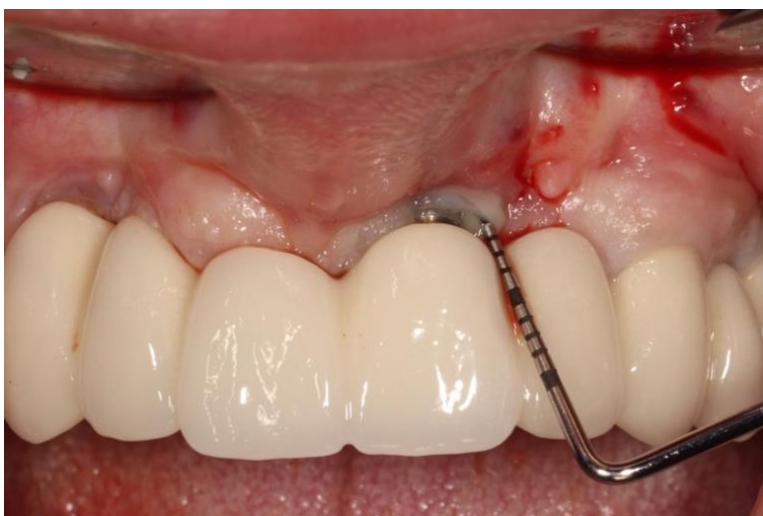
Slika 5. prikazuje recesiju oko implantata 21 s dubinama sondiranja 6 mm i prisutnim znakovima upale (Bop +).

U istraživanju Horowitz i sur. (51) nailazimo na pacijenta kojem je prije 12 godina ugrađen implantat. Kliničkim pregledom se otkriva recesija između dva središnja sjekutića (Slika 5.). Radiološko ispitivanje (Slika 6.) pokazuje veliki gubitak kosti oko sjekutića i 30%-45% gubitka kosti oko implantata s dubinama sondiranja oko 6 mm. Središnji sjekutić uz implantat je iz parodontoloških razloga izvađen i korišten kao mineralizirani dentinski graft, pripremljen prema protokolu (24).