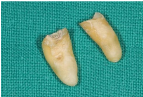
Slika 1. prikazuje očišćen zub spreman za pripremu grafta.

Izvađeni zub mora biti očišćen od svih umjetnih materijala poput punila u slučaju prethodnog endodontskog tretmana ili ispuna. Uklanja se biofilm, mineralizirane zubne naslage, krunice, karijesne lezije, obojeni dentin i ostatak parodontnog ligamenta. Materijal se uklanja pomoću rotirajućih nasadnih instrumenata i tungstenovog karbidnog svrdla. Nije potrebno odvajati krunu od korijena niti uklanjati caklinu. Pusterom osušen zub mora biti postavljen u sterilnu komoru grindera (Slika 1.).