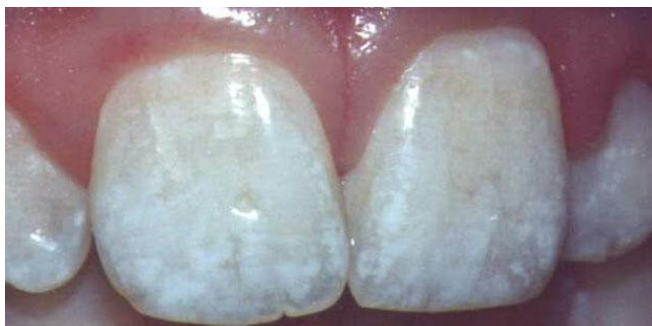
Slika 2. Dentalna fluoroza. Preuzeto (20)

može varirati od bijele boje cakline kod blage forme fluoroze pa do žuto-smeđih ili čak smeđih diskoloracija kod jačih oblika (16).