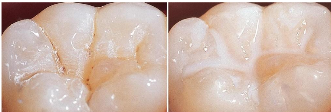
Slika 6. Pečačenje zuba. Preuzeto (38)

Ismail i sur. u četverogodišnjem su programu pečačenja jamica i fisura otkrili da se karijesne lezije rjeđe pojavljuju, čak u 46% slučajeva, na pečaćenim zubima nego na onima bez njih. Učinkovitost pečatnog materijala ovisi o mogućnosti penetracije, otpornosti na trošenje, načinu rukovanja i netopivosti u oralnom okruženju. Cjelovitost i retencija pečata najvažniji su čimbenici za njegovo uspješno djelovanje, ali zahtijevaju adekvatnu primjenu i kontrolu na redovitim kontrolnim pregledima (4).