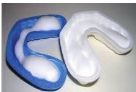
Slika 1. Žlica za fluoridaciju gelom. Preuzeto (16)

Redukcija karijesa seže od 40 do 75% (14). Gelovi (5000 - 12500 ppmF) se najčešće primjenjuju u konfekcijskim žlicama, a ne koriste se kod djece mlađe od 6 godina zbog opasnosti od gutanja. Vodice za ispiranje također se ne koriste kod djece mlađe od 6 godina, postoje s dnevnom ili tjednom koncentracijom fluorida te se koriste pod nadzorom (15).