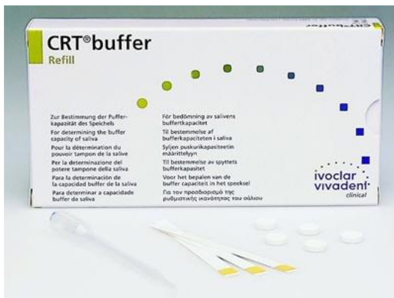
Slika 9. CRT buffer. Preuzeto (42).

oko 6.5. Time se onemogućuje razvoj patogenih mikroorganizama kojima odgovara promjena pH vrijednosti (9). Isto tako, puferski su sustavi u slini sposobni neutralizirati kiseline koje mogu oštetiti zube. Utvrđivanjem puferskog kapaciteta sline može se ustanoviti kako dobro puferski sustav preuzima ovaj važan, zaštitni posao u svakom pojedinačnom slučaju. Određivanje pH vrijednosti sline temelji se na promjeni boje indikatorskih trakica u žutu (niski kapacitet), zelenu (srednji kapacitet) i plavu (normalni kapacitet). Žuta boja označava pH od 4 ili manje, što nam govori da slina nema sposobnost podizanja pH vrijednosti te je time rizik za nastanak karijesa povećan. Test procjene rizičnosti od karijesa CRT buffer pruža nam pouzdane rezultate već nakon pet minuta (42).