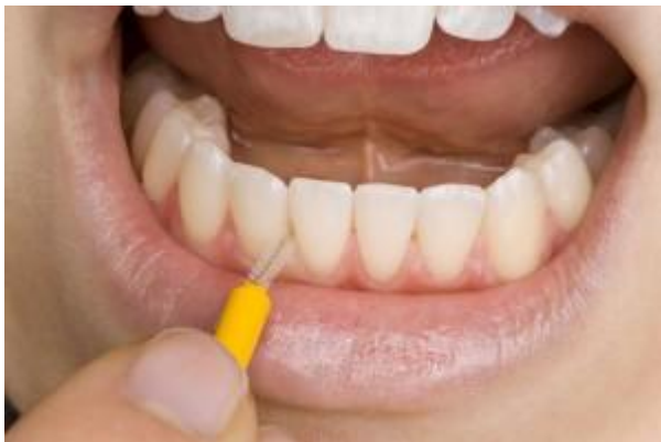
Slika 5. Interdentalna četkica. Preuzeto (28).

normalno i uobičajeno. Naime, kod ljudi koji ne koriste interdentalne četkice u interdentalnom prostoru uvijek postoji određena količina plaka. Zbog plaka je gingiva blago upaljena i prilikom uvođenja interdentalne četkice reagira krvarenjem. Pravilnim provođenjem interdentalne higijene ovo se krvarenje postupno smanjuje i nakon nekog vremena (oko tjedan dana) potpuno nestaje. Praćenje smanjenja krvarenja može poslužiti kao metoda samokontrole učinkovitosti interdentalne higijene – prestanak krvarenja ukazuje na odsutnost plaka, odnosno dobro očišćene interdentalne prostore (21).