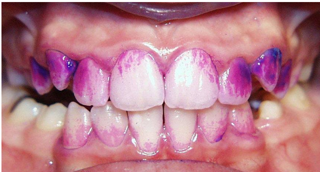
Slika 7. Plak test. Preuzeto (40).