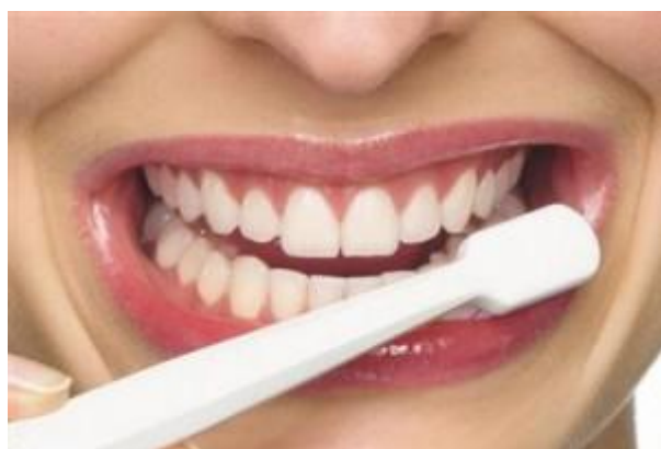
Slika 4. Postupak čišćenja donjih zubi. Preuzeto (24)