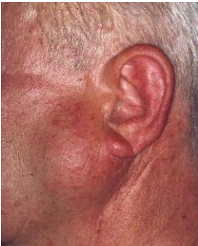
Slika 4. Warthinov tumor. Preuzeto iz (15).