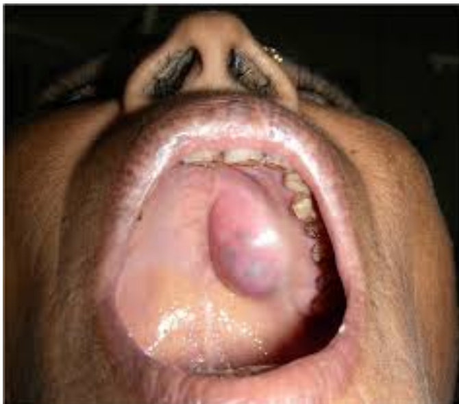
Slika 3. Pleomorfni adenom na nepcu. Preuzeto iz (14).

Prognoza bolesti je dobra uz odgovarajuć kirurški postupak.