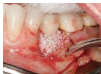
Slika 11: Ispunjavanje defekta koštanim nadomjestkom. Preuzeto: (16)

Za augmentaciju se upotrebljava autogena, alogena i ksenogena kost te kombinacija različitih transplantata. Koštani nadomjesci vode stanice koje sudjeluju u regeneraciji i inkorporiraju se u novonastalu kost, što rezultira ispunjavanjem defekta. Uspoređujući rezultate dobivene augmentacijom autogenim i ksenogenim graftom, autogeni je pokazao manji postoperativni gubitak kosti nego ksenogeni graft (15).