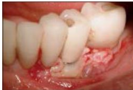
Slika 13: Prekrivanje defekta dvostrukom PRF membranom.

PRF se sastoji od polimeriziranog fibrinskog matriksa u kojemu su stanice trombocita, leukocita, citokini i cirkulirajuće matične stanice koje otpuštaju različite faktore rasta. PRF